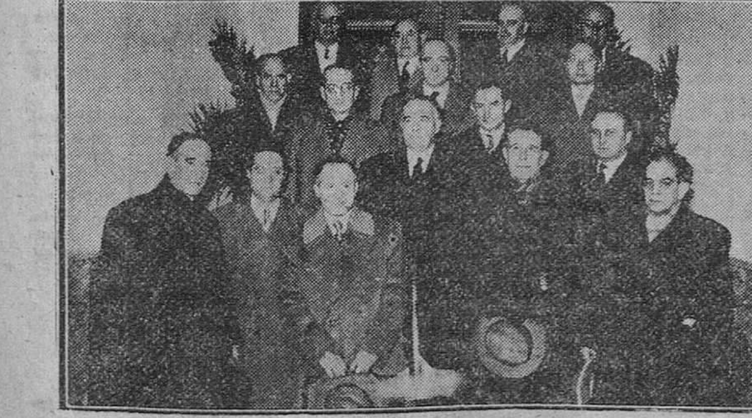
Se han reunido en nuestra ciudad los presidentes de las Cámaras de la Propiedad Urbana del Norte de España, para tratar de importantes asuntos que afectan a dichas entidades. En la fotografía de "Fede" aparece un grupo de los asistentes a dicha reunión, celebrada ayer.