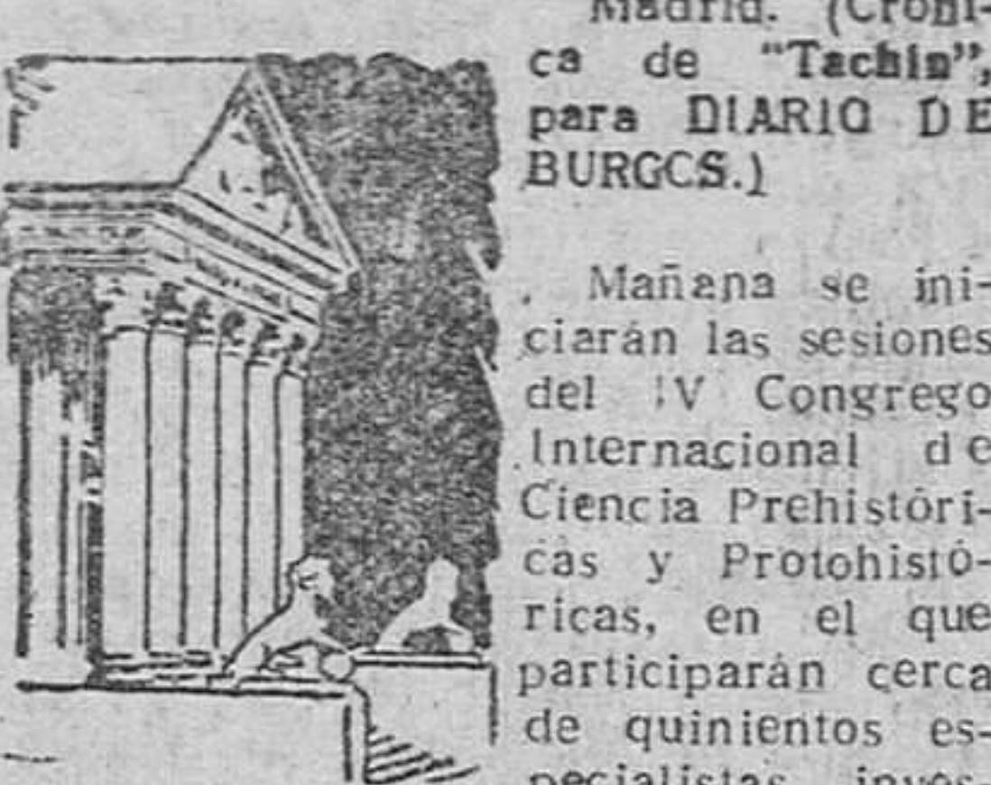
Madrid. (Crónica de "Tachib" para DIARIO DE BURGOS.)

Avenencia entre Otto Skorzeny y "Domingo". - Comentarios a unas palabras del Papa