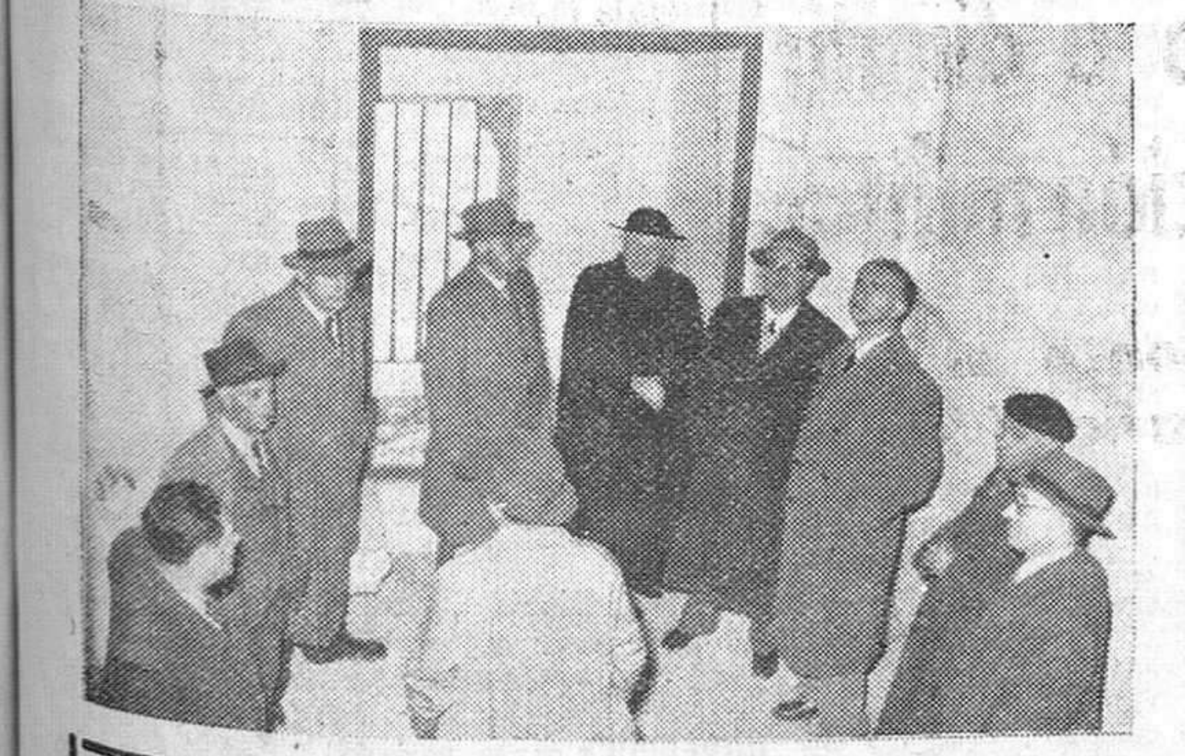
Ayer visitó diversos monumentos arquitectónicos de nuestra ciudad, acompañado de varias personalidades burgalesas, el comisario general del Patrimonio Artístico Nacional, don Francisco Iniguez, que aparece en nuestra fotografía (en cuarto lugar por la derecha), admirando las obras de restauración realizadas en la histórica "Casa de Miranda".