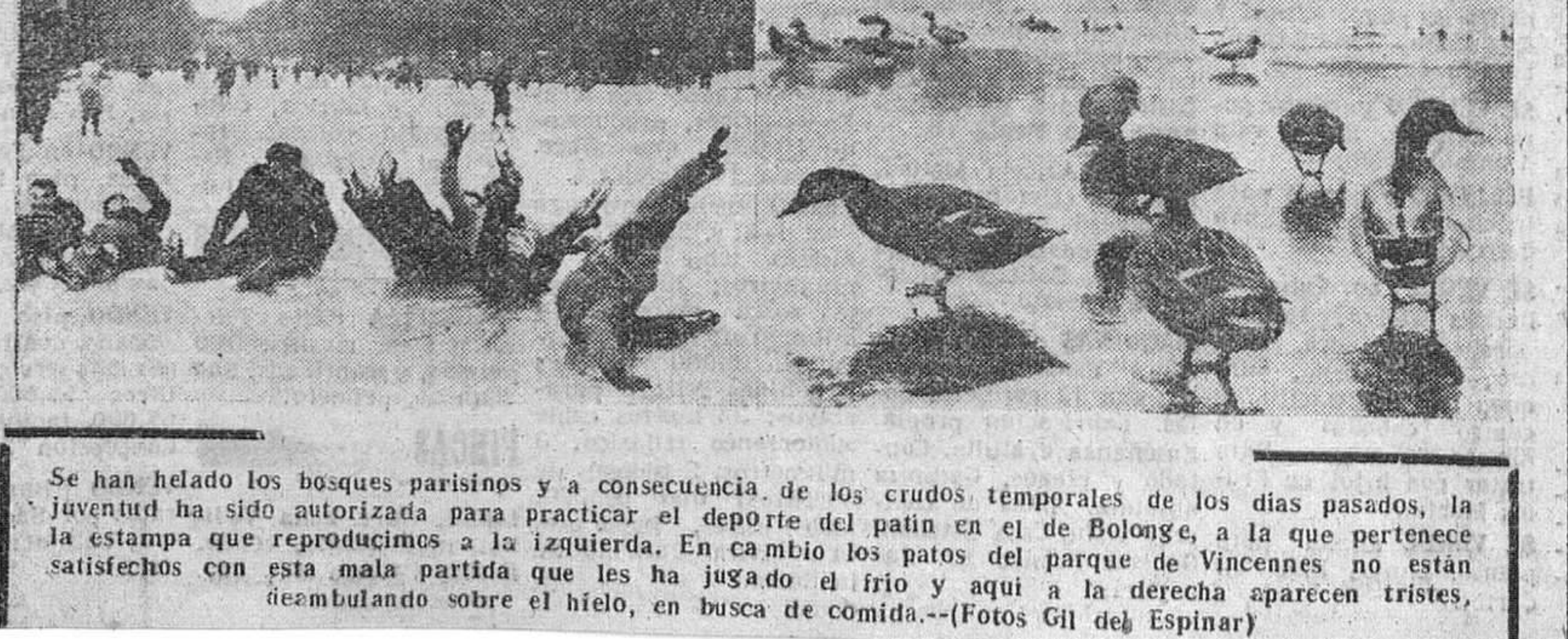
Se han helado los bosques parisinos y a consecuencia de los crudos temporales de los días pasados, la juventud ha sido autorizada para practicar el deporte del patín en el de Bolongne, a la que pertenece la estampa que reproducimos a la izquierda. En cambio los patos del parque de Vincennes no están satisfechos con esta mala partida que les ha jugado el frío y aquí a la derecha aparecen tristes, deambulando sobre el hielo, en busca de comida.