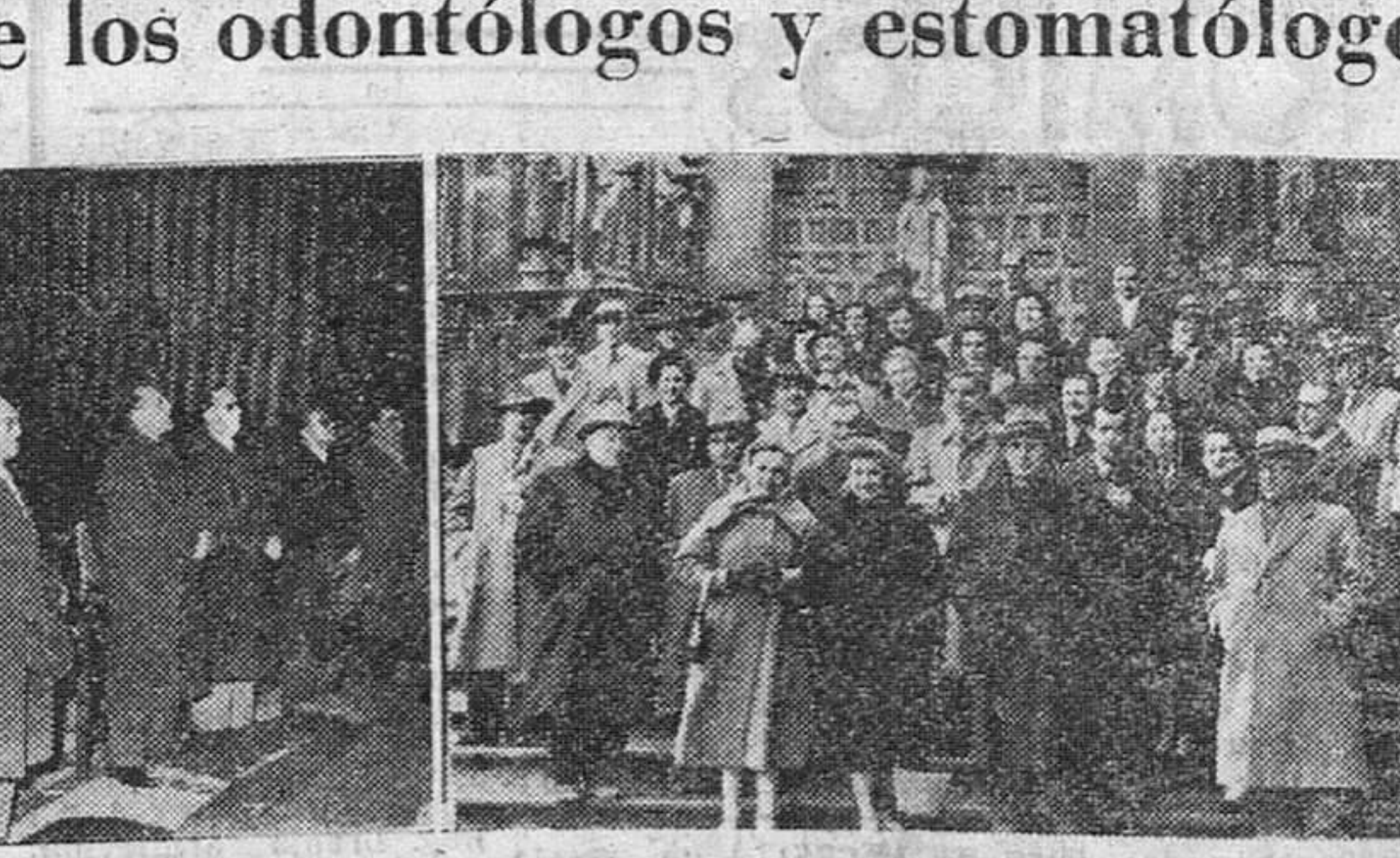
Los odontólogos y estomatólogos de la octava región, celebraron ayer en nuestra ciudad, con diversos actos, la fiesta de su Patrona Santa Apolonia. En fotografía de la izquierda figura la presidencia de la solemne misa que tuvo lugar en el altar mayor de la S. I. Catedral y a la derecha, un grupo de colegiados, acompañados de sus familiares, a la salida del S. T. Metropolitano.