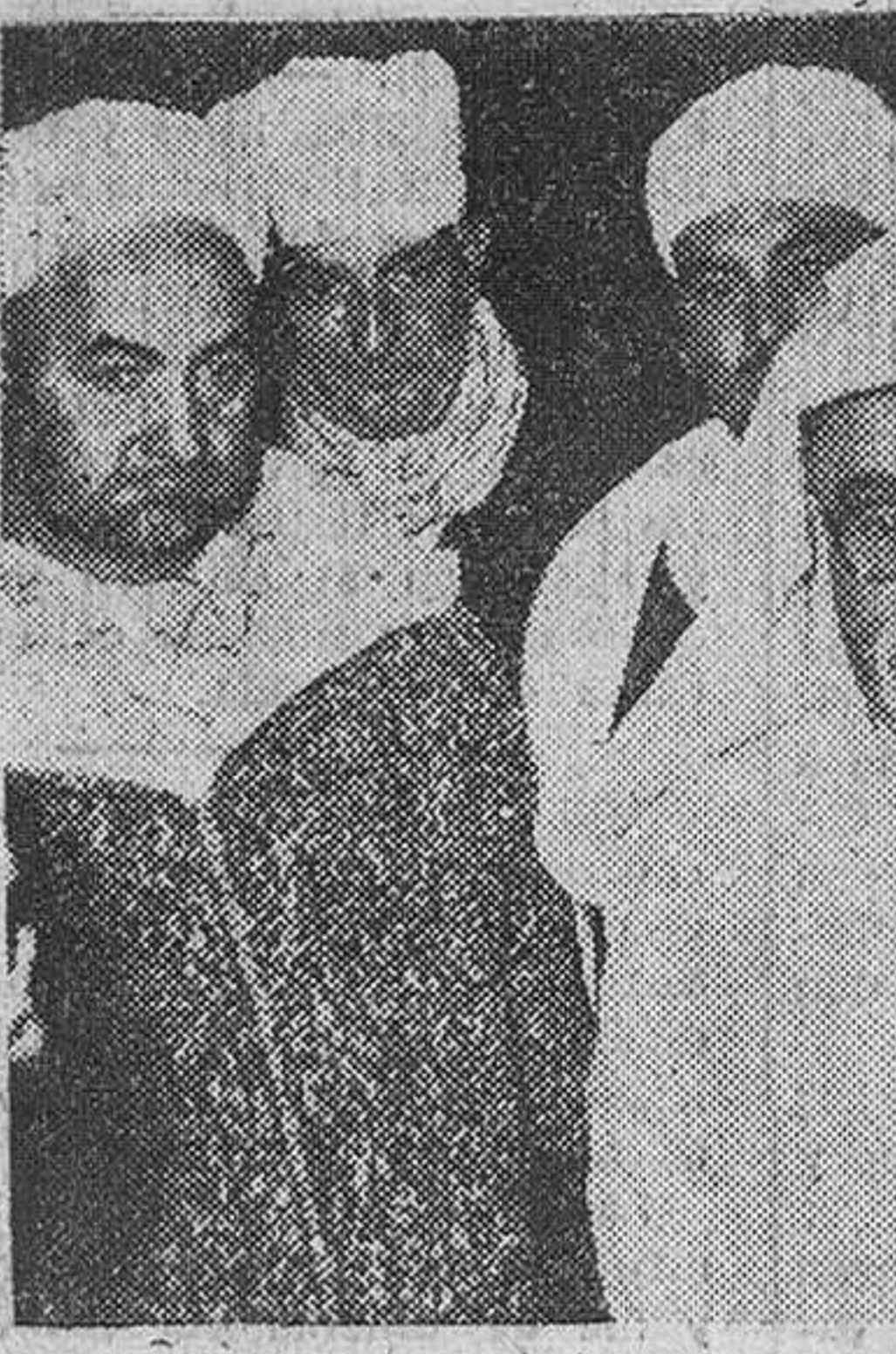
El Gran Visir del Gobierno jafliano, Sid Ahmed Ben contestando a las preguntas de Sid Abdelkrim El Haddad, acompañado de otros moros notables, los periodistas, a su llegada a la capital de España. (Foto Gil del Espinar).

Madrid. - El Gran Visir del Gobierno jafliano, Sid Ahmed Ben contestando a las preguntas de Sid Abdelkrim El Haddad, acompañado de otros moros notables, los periodistas, a su llegada a la capital de España. (Foto Gil del Espinar).