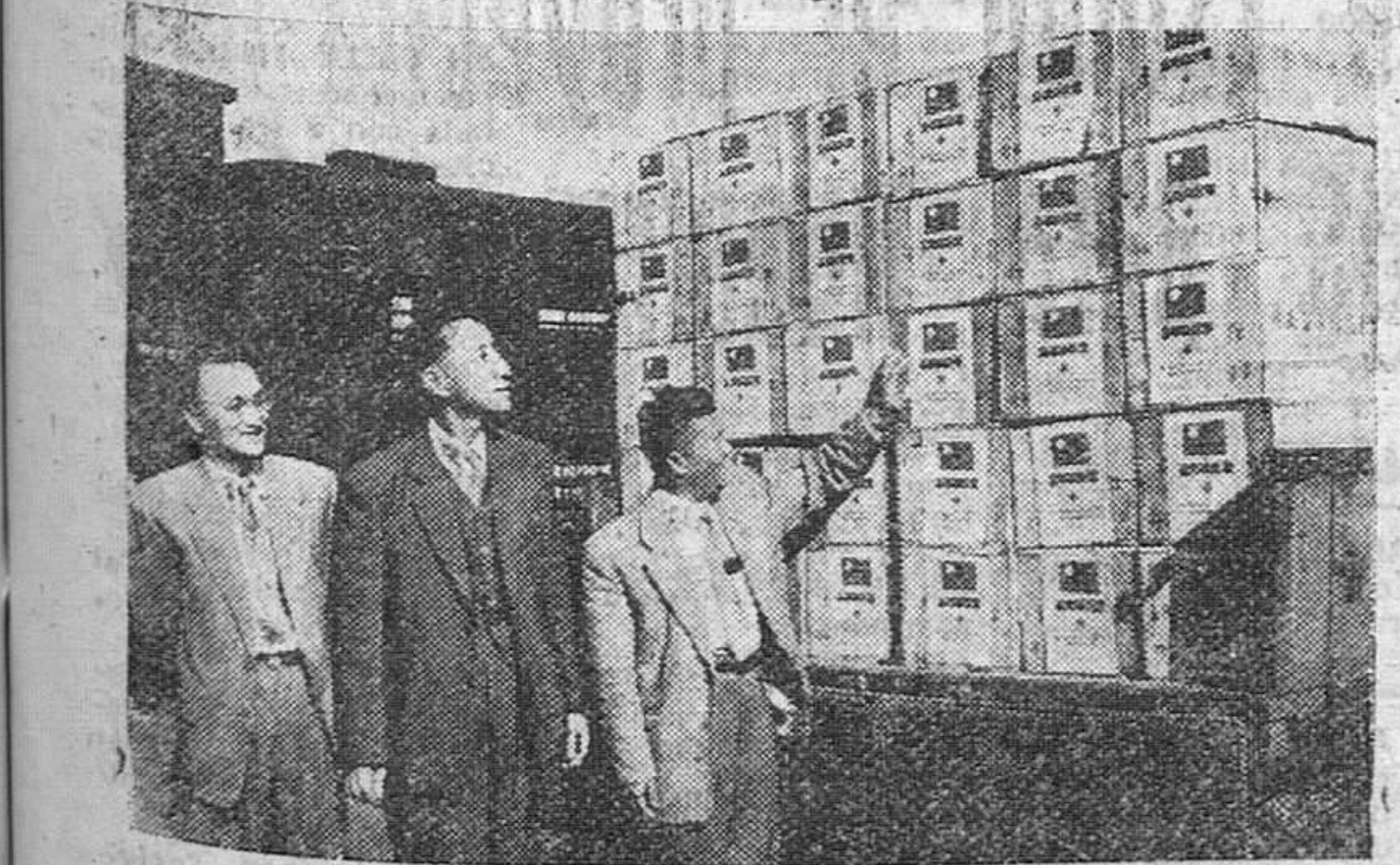
Típic. — Miembros de la Cruz Roja de China libre examinan los paquetes de comestibles y otros efectos, por una cuantía de 24 toneladas, que con motivo de la Navidad se han enviado a los chinos anticomunistas en Corea.