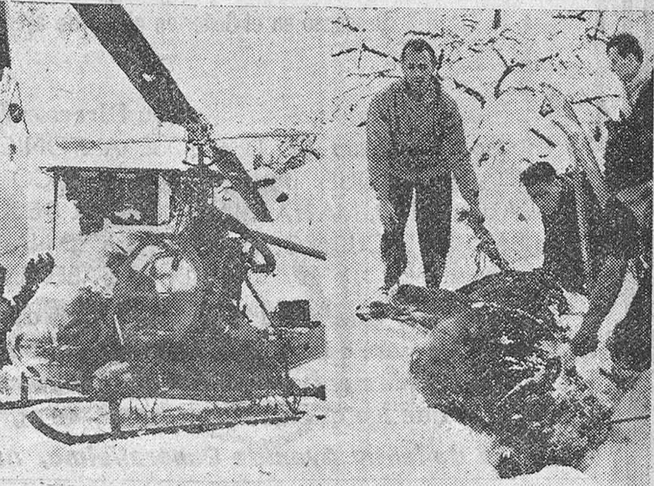
Zurich. — Las intensas precipitaciones de nieve en Suiza, han causado, además de muchos daños materiales, la muerte de numerosas cabezas de ganado. En las fotos que reproducimos aparece, en la izquierda, un helicóptero, habilitado con trineo, para el traslado de enfermos o heridos. A la derecha, un grupo de personas extrayendo de entre la nieve el cadáver de una vaca.