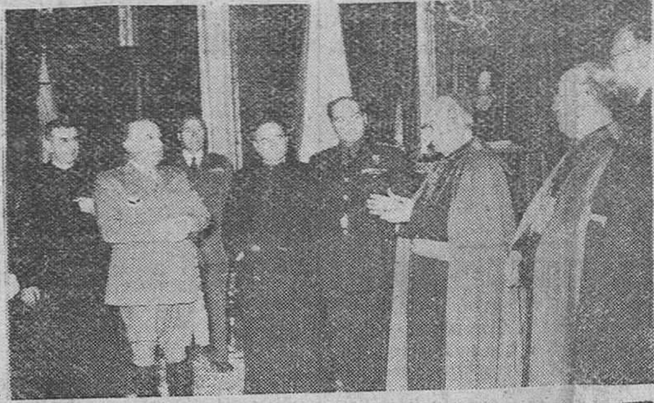
El Pardo. — Su Excelencia el Jefe del Estado recibió en audiencia especial a los Obispos de León y Astorga y 45 asesores eclesiásticos de Sindicatos, acompañados por el delegado nacional Sr. Solís.