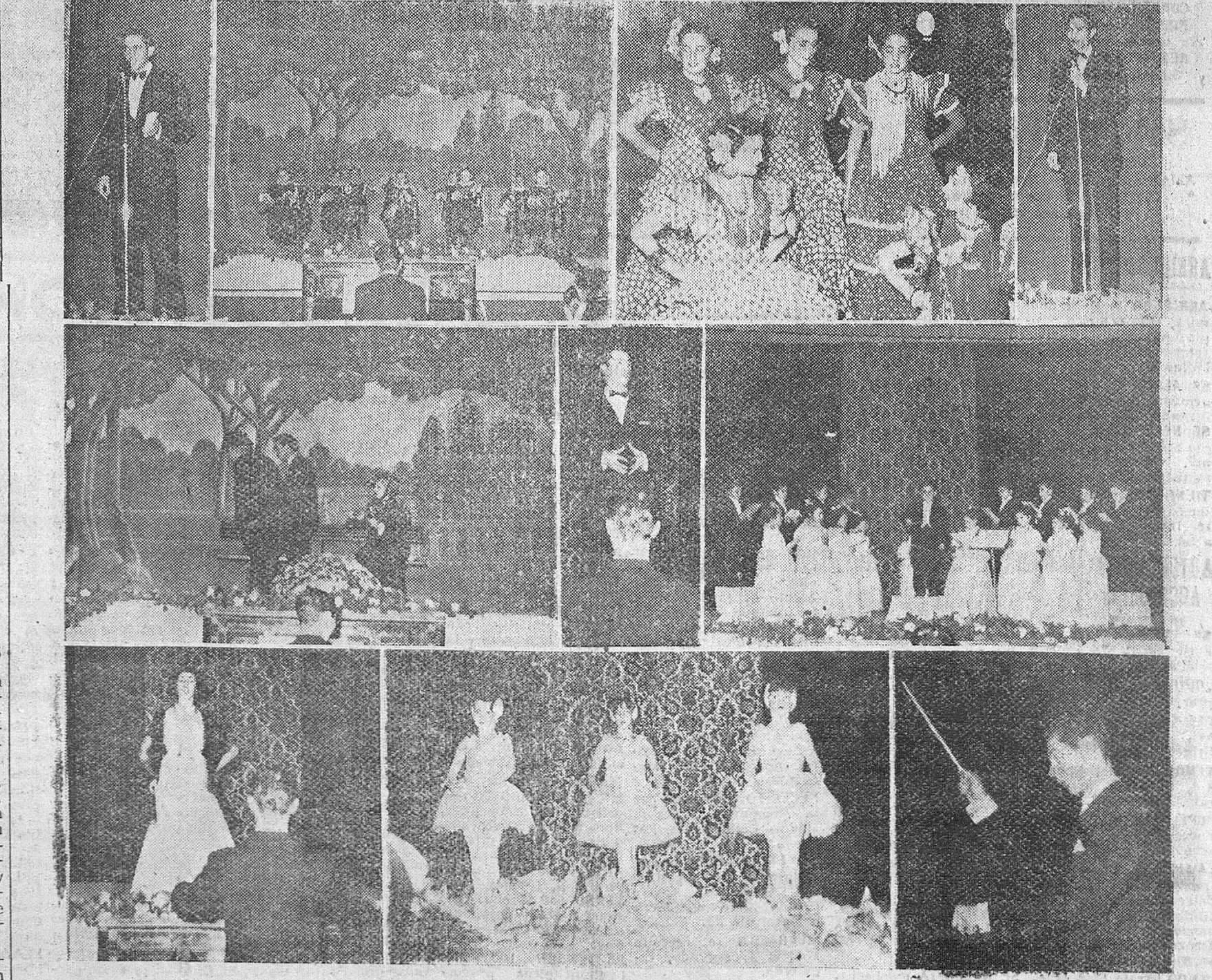
REPORTAJE GRAFICO DE "FEDE" SOBRE LA MAGNIFICA VELADA CON QUE SE DIO FIN EL DOMINGO AL CONCURSO DE MUÑECAS ORGANIZADO POR LA CAJA DE AHORROS DEL CIRCULO CATOLICO DE OBREROS...