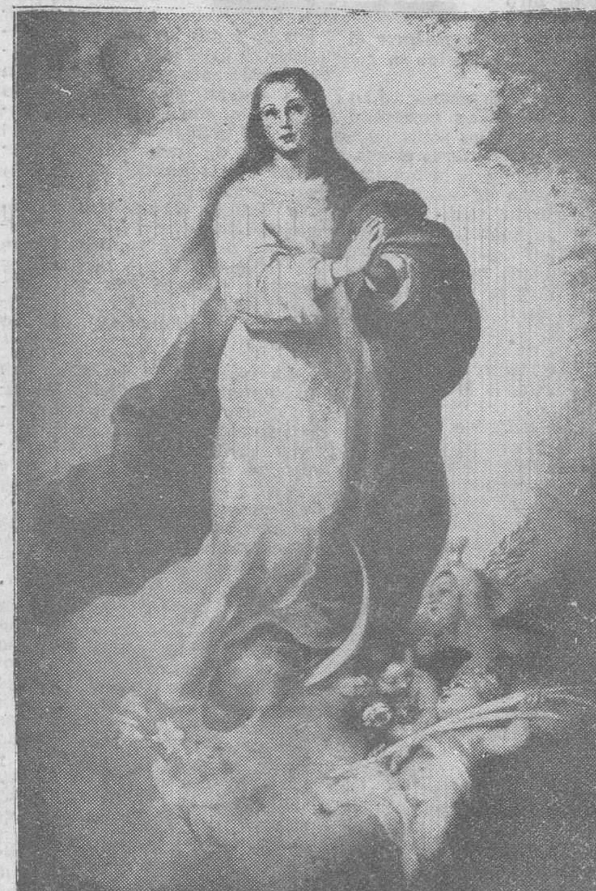
"Potuit, Decuit, Ergo fecit" (Juan Duns Escoto)

¿PUDO Dios, en su excelsa omnipotencia, preservar a MARIA del pecado común, original, triste legado de Adán a su menguada descendencia?