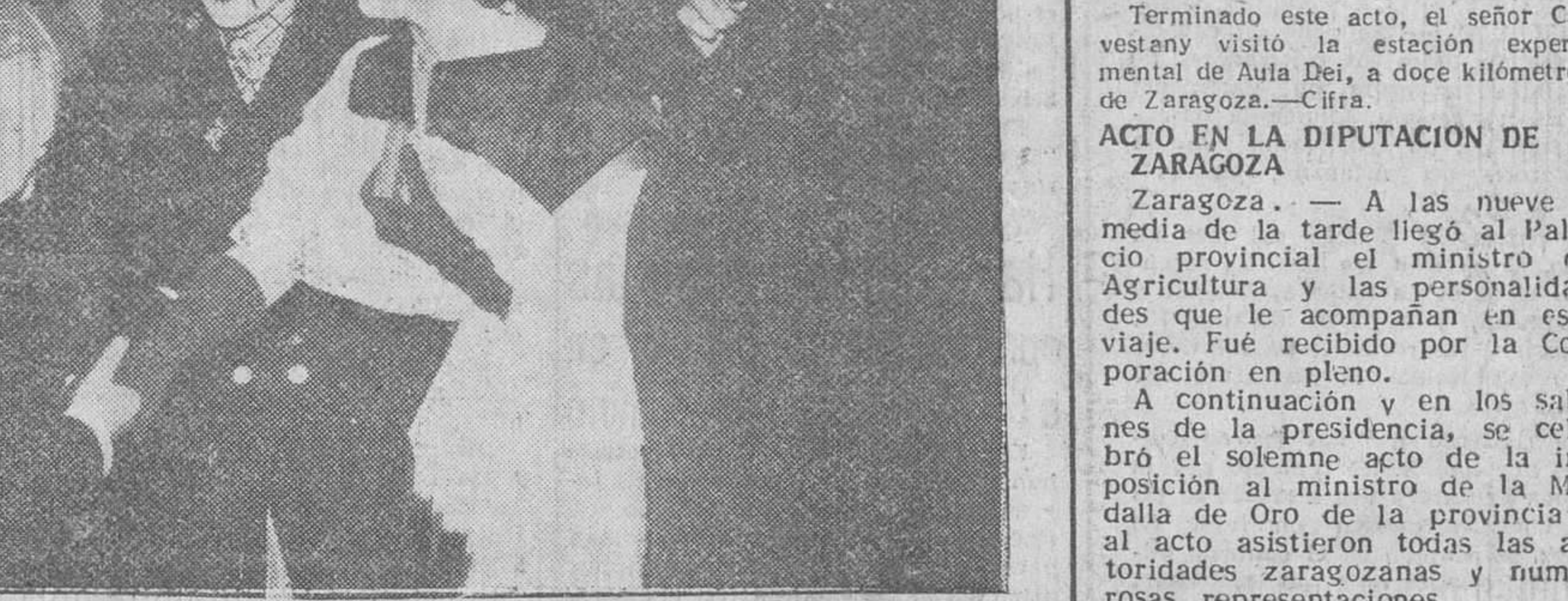
Madrid. — Se ha celebrado en un céntrico teatro, un festival artístico, a beneficio de la suscripción en favor de los damnificados por las recientes inundaciones en el Norte de España. La fiesta estuvo realzada por la presencia de la hija de S. E. el Jefe del Estado, marquesa de Villaverde, que aparece en la fotografía, a su llegada al teatro, para presenciar el espectáculo.

En el Ayuntamiento de La Laguna se ha celebrado una recepción en honor del señor Ruiz Giménez que penetró en el edificio acompañado por el alcalde. Asistieron las primeras autoridades militares, civiles y eclesiásticas. El alcalde pronunció un discurso de salutación, agradeciendo la ayuda ministerial a la Universidad de La Laguna y la resolución del problema de la enseñanza en Canarias.