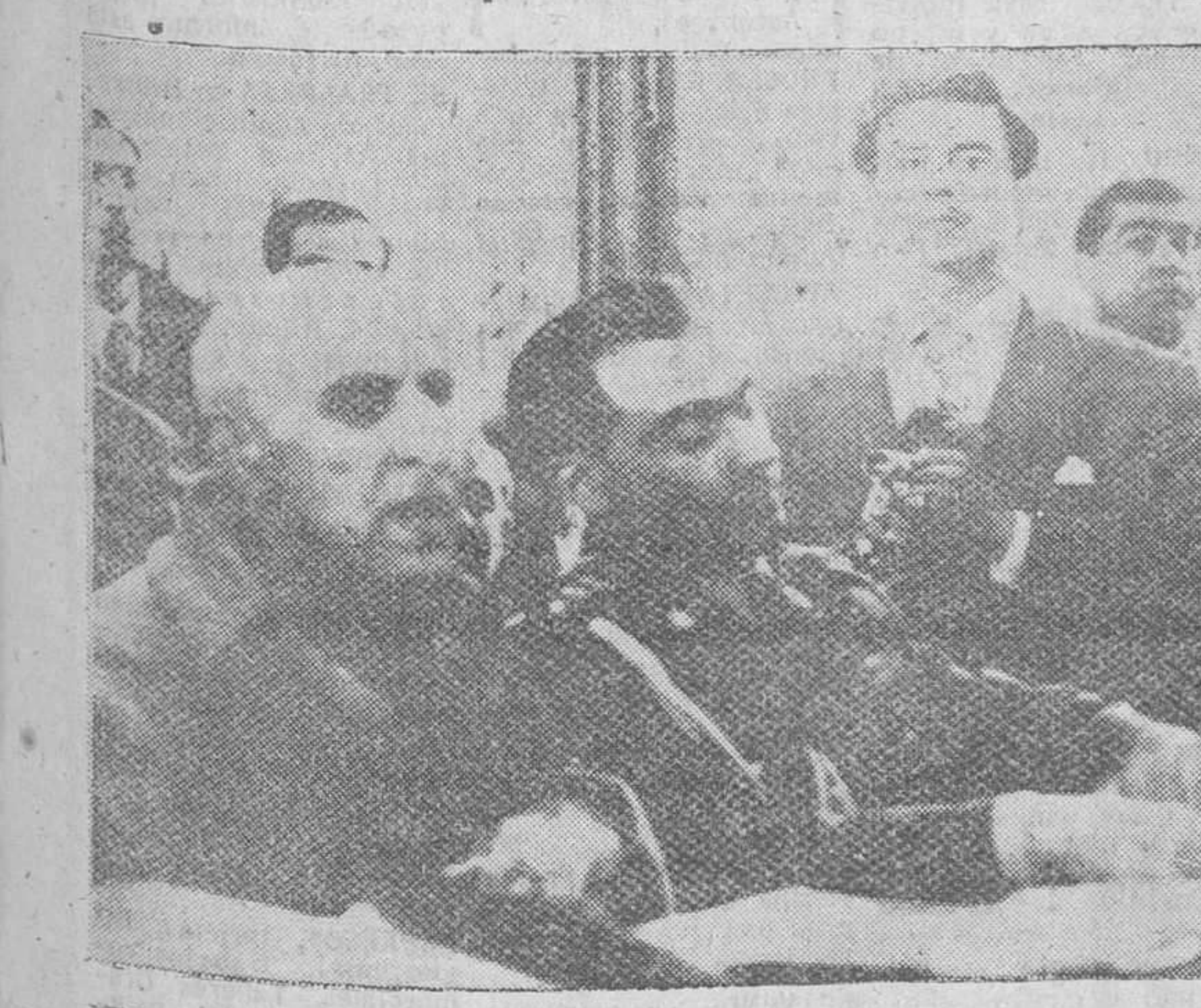
Teherán. — El doctor Mussadeq, fotografiado en el comienzo de la vista del proceso que se le sigue, acusado de alta traición al pueblo persa y al Sha. Su cara parece reflejar mucho escepticismo a los cargos que se le han formulado.