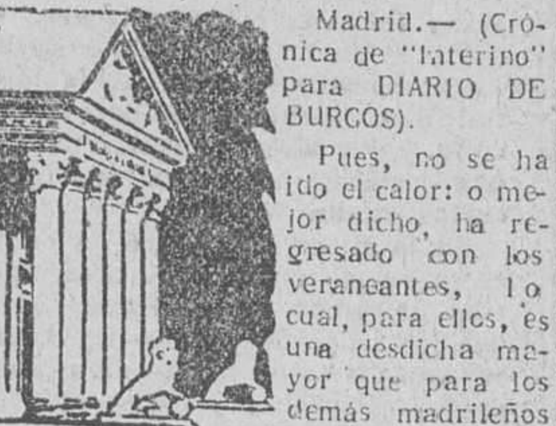
Observatorio reconoce que han fallado todas las predicciones sobre un cam...

El Club merengue no creará "problemas" a Di Stefano, que el domingo llegó a "pedir ánima". - Cincuenta pesetas cuesta bañarse en una piscina de El Escorial