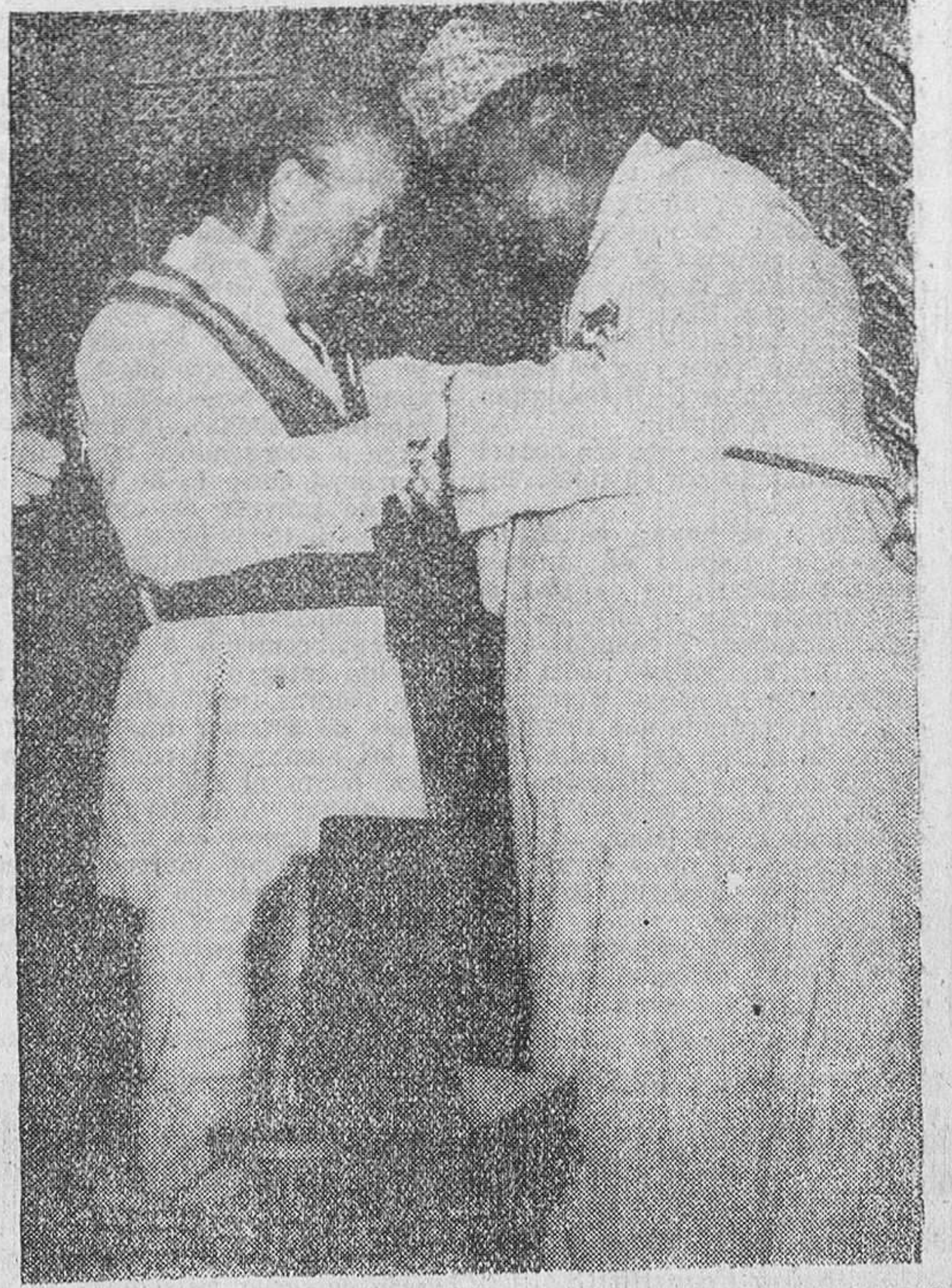
Tetuán. — S. A. I. el Jajifa, en el momento de imponer la banda de la Orden de Hassanía, al Alto Comisario de España en Marruecos, teniente general García Valiño, con motivo de la visita que éste le hizo en el palacio de Mexuar, para felicitarle en la Pascua de Aid El Kebir.

S. A. I. el Jajifa condecora al Alto Comisario de España