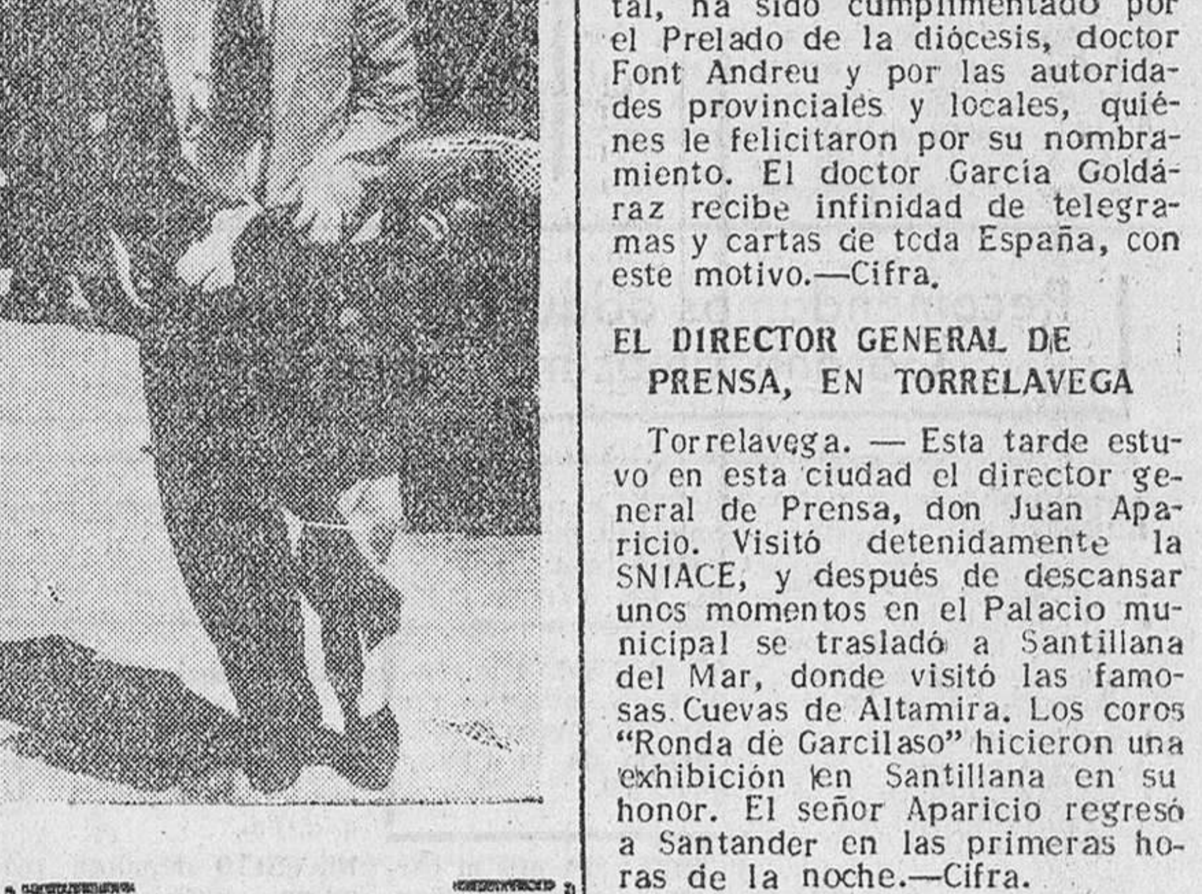
Barcelona. — Mr. Selwyn Lloyd, ministro de Estado de la Gran Bretaña y representante de su país en las Naciones Unidas, fotografiado a su llegada a la Ciudad Condal.