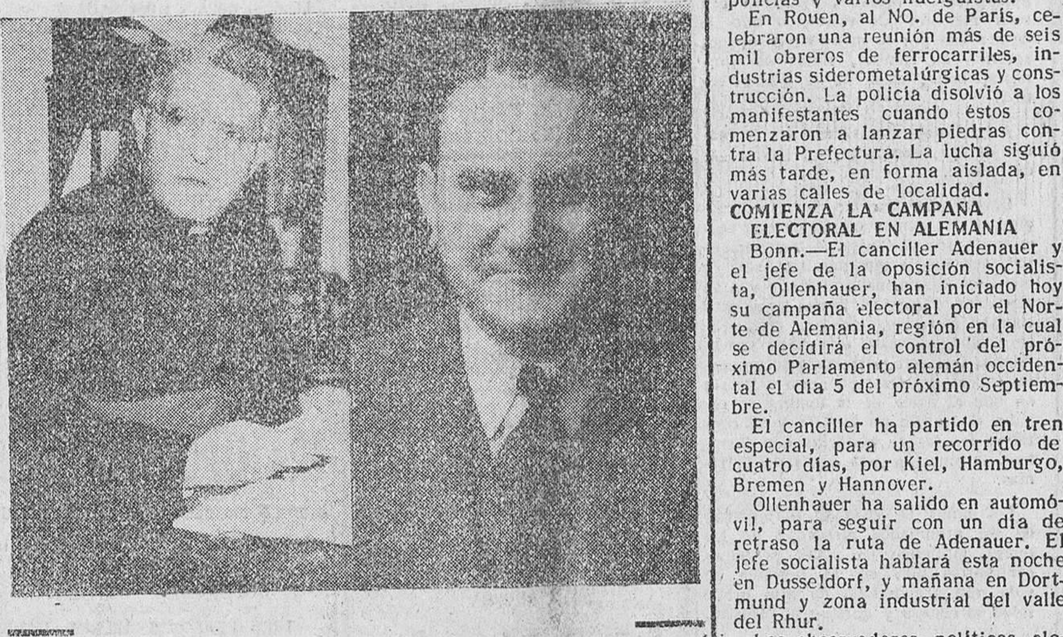
Monsiñor Domenico Tardini, Pro-secretario de Estado de Su Santidad para Asuntos Eclesiásticos Extraordinarios y el Excmo. Sr. Don Fernando María Castiella y Maiz, embajador de España en el Vaticano, que han negociado el nuevo Concordato firmado entre la Santa Sede y el Gobierno español.