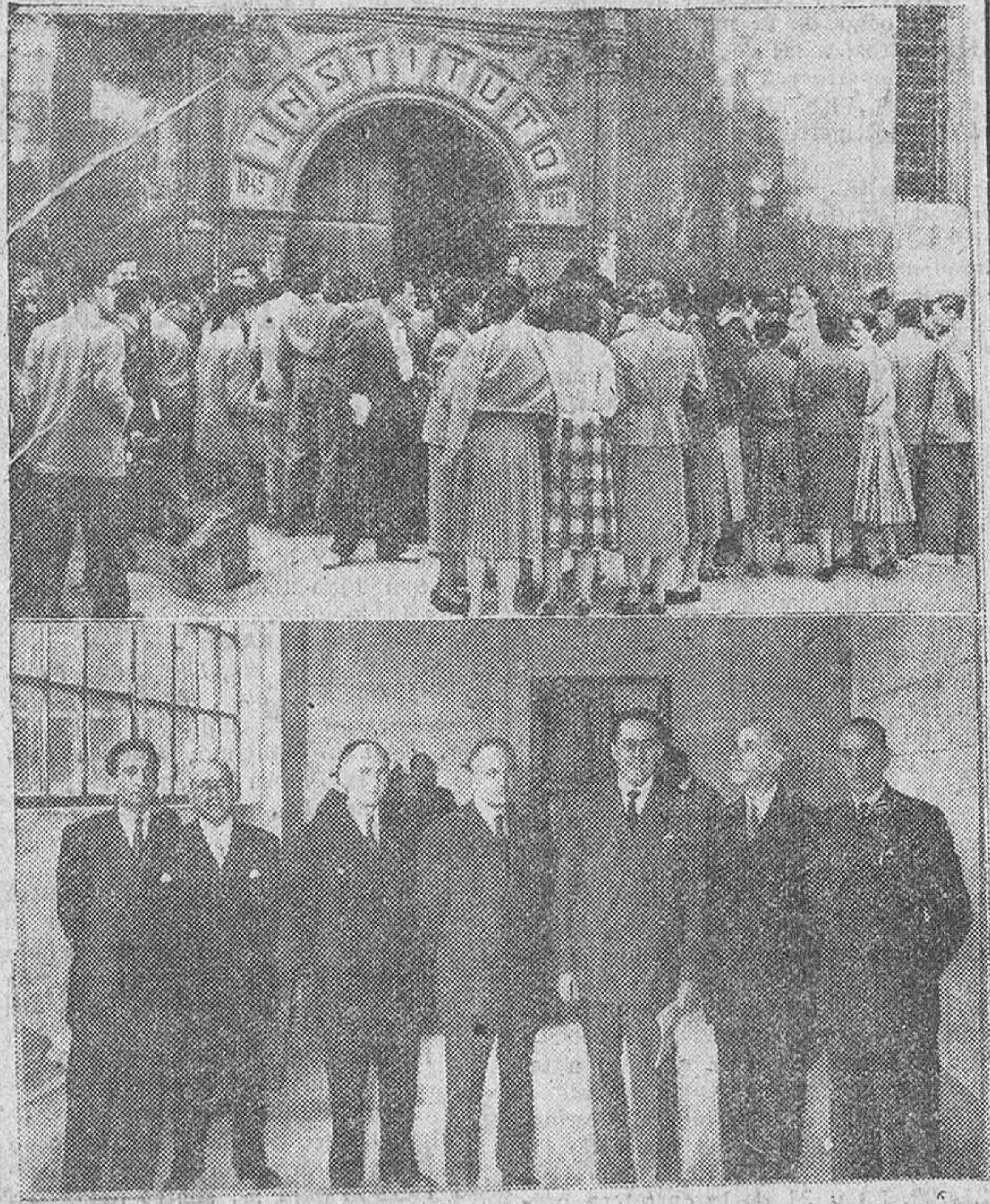
Por vez primera dieron comienzo ayer en nuestro Instituto de Enseñanza Media los ejercicios del Examen de Estado. En la primera de nuestras fotografías aparece un grupo de examinandos, disponiéndose a penetrar en dicho Centro, para la práctica del ejercicio escrito. En el grabado inferior, los catedráticos de Universidad y de Instituto, que forman parte de los Tribunales.

Examen de Estado en el Instituto de Burgos