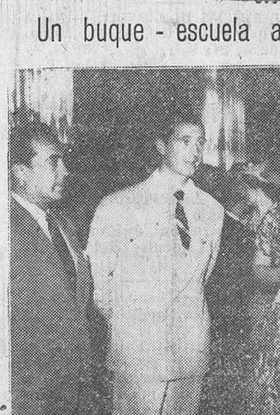
Barcelona. — Los marqueses de Villaverde, en su visita a la Diputación, acompañados de varios miembros del Congreso de Cirugía, que se celebra en la Ciudad condal.

Visita Toledo el ministro de Defensa ecuatoriano