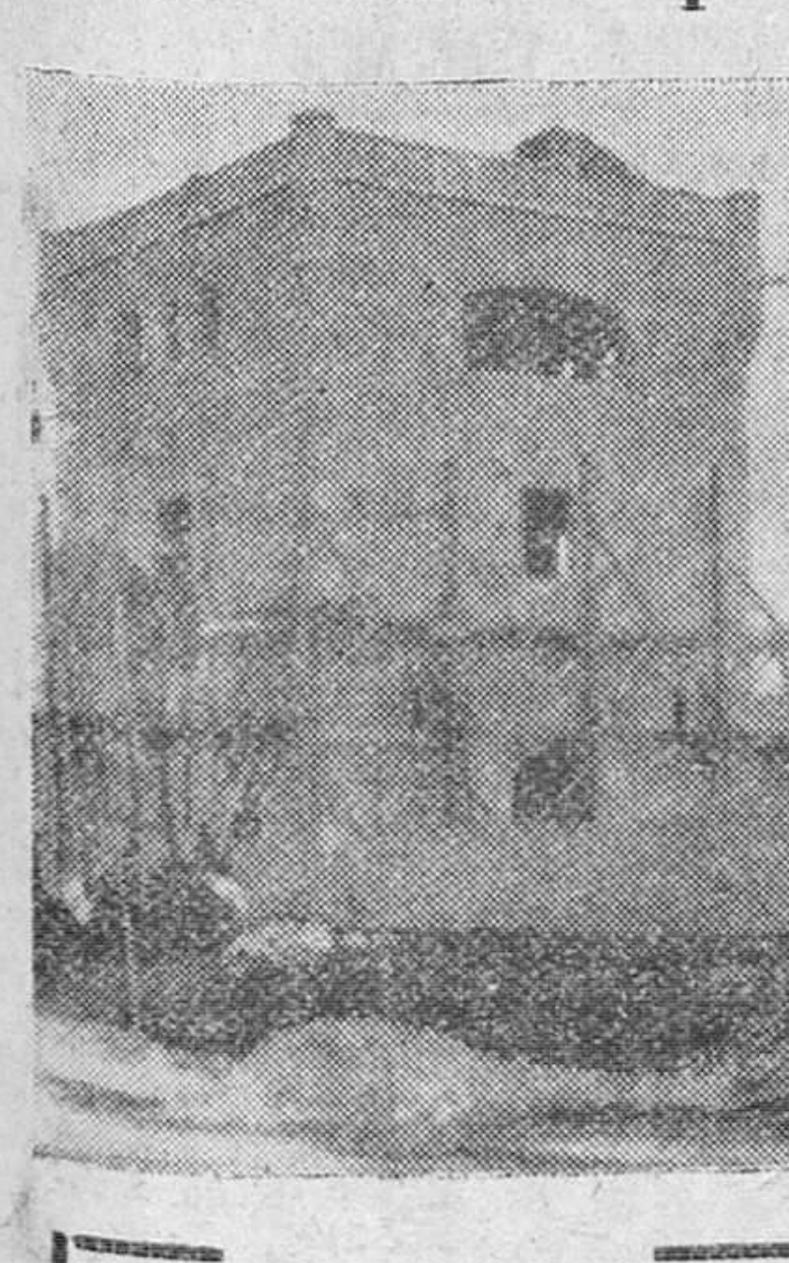
Perspectiva que ofrece la torre donde se exhibirán los productos típicos burgaleses, en la próxima Feria Internacional del Campo.