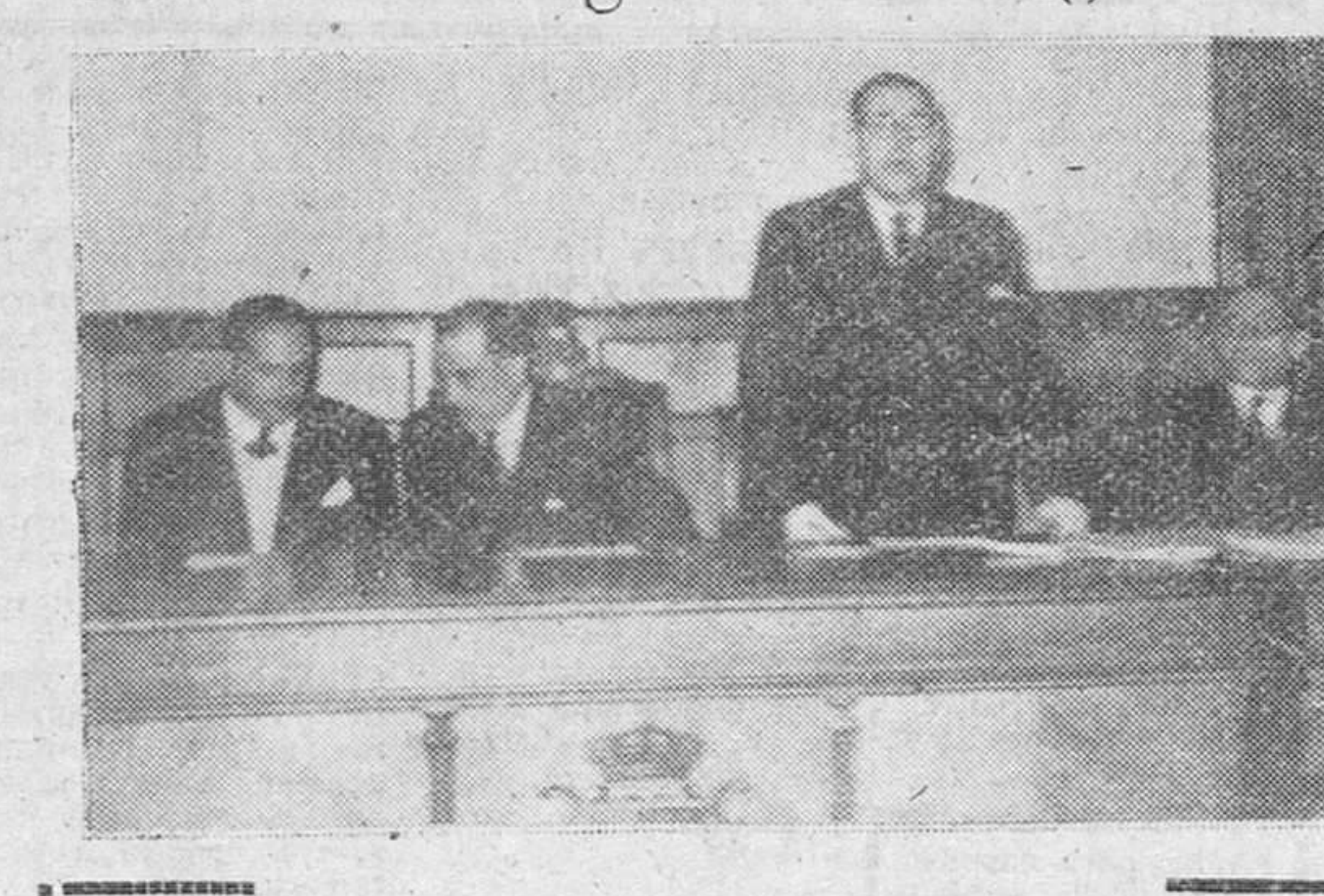
Celebraron ayer su fiesta los doctores y licenciados en Filosofía y Letras y Ciencias de nuestra ciudad. En nuestro grabado se recoge un momento del acto cultural, celebrado en la Diputación.