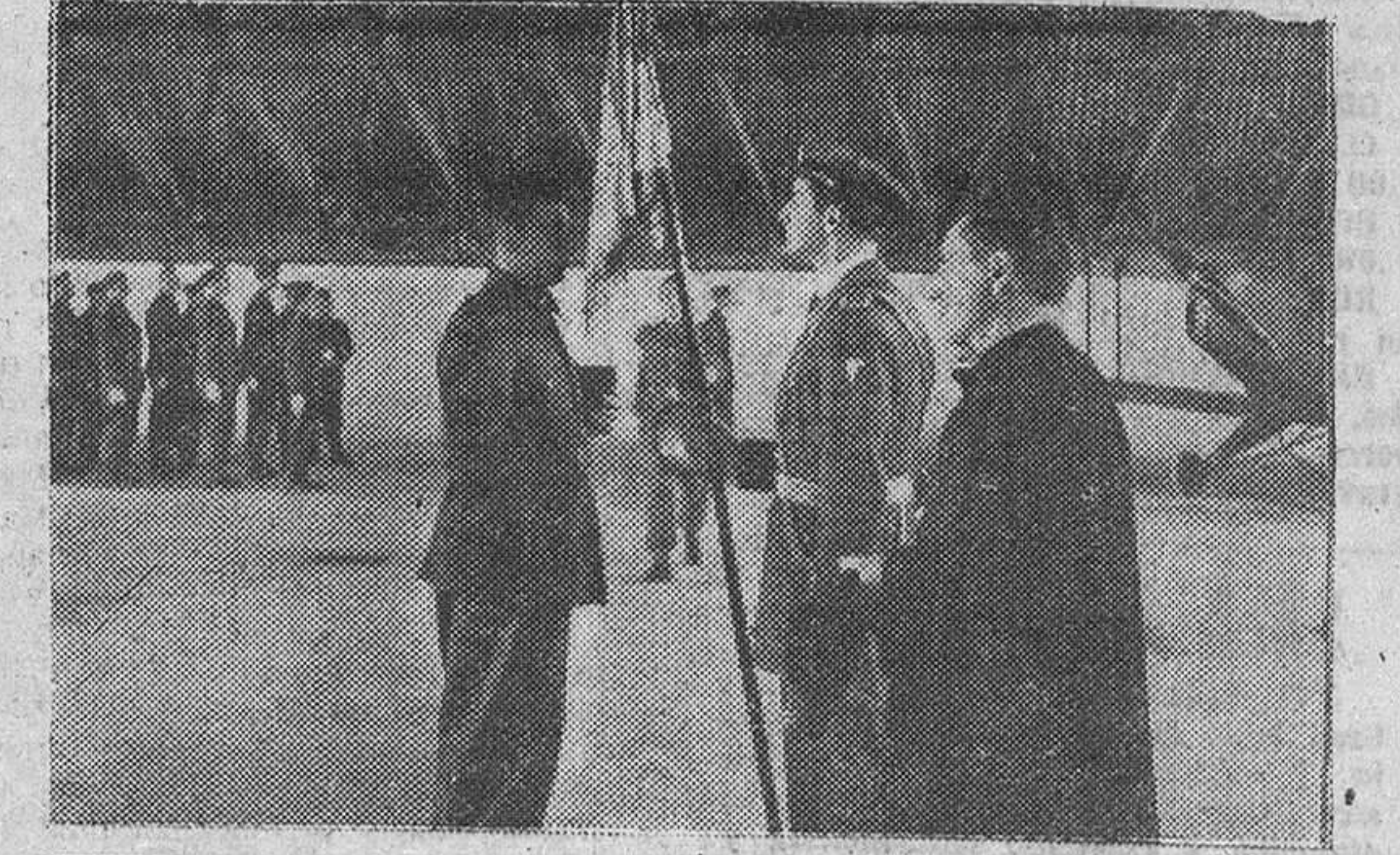
Un momento del solemne acto de la jura de la bandera, celebrado el pasado domingo en el aeródromo de Villafria.