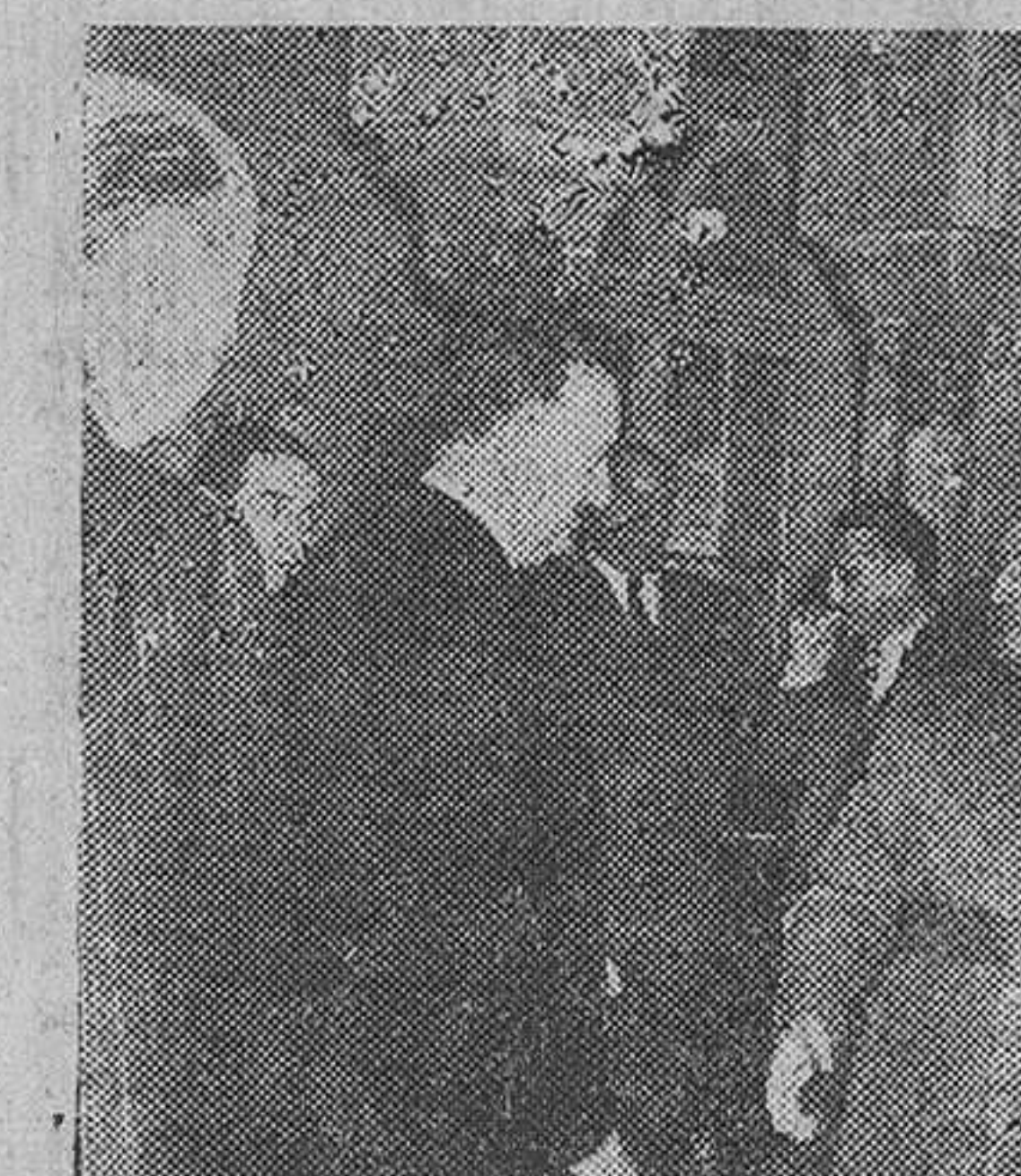
Sevilla. — S. E. el Jefe del Estado saludando a los ministros del Gobierno, a su llegada al Alcázar sevillano, momentos antes de reunirse en Consejo.