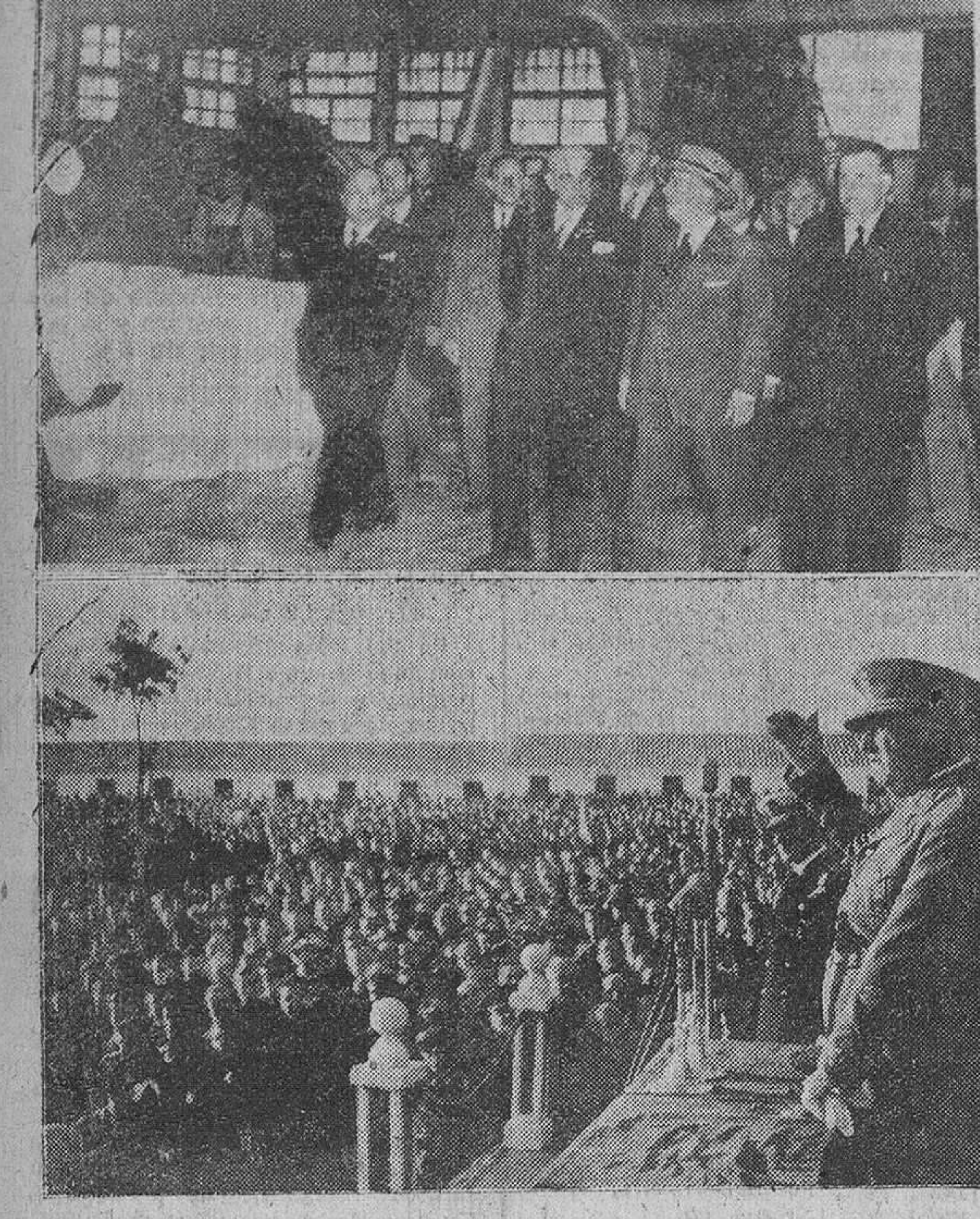
Sevilla. — Dos documentos gráficos de la estancia de S. E. el Jefe del Estado, en esta ciudad. En la parte superior, el Caudillo durante la visita a las factorías industriales "Hytasa", enclavadas en la barriada extrema del Cerro del Aguila. En la fotografía inferior, el Generalísimo hablando a la multitud, en el acto de entrega de viviendas en la barriada de Santa Teresa.

Madrid. — La Embajada argentina y la delegación "Eva Perón", en la ofrenda floral que realizaron en el parque "Eva Perón" como homenaje a la fundadora de la benemérita institución.