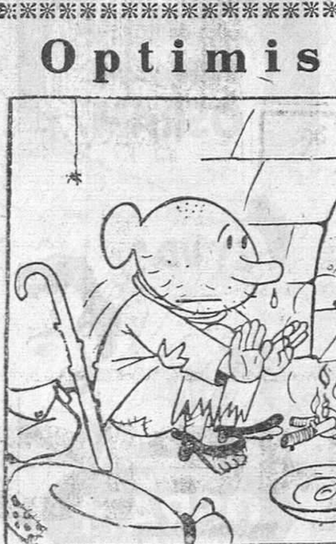
En medio de todo, hay motivo para estar contentos. Año de nieves, año de bienes.

La vida humana es una sucesión de actos, actos que no son únicamente personales ni es por regla general, conjunta y sus efectos trascienden a otras personas. Y así como los actos dignos y nobles de los individuos trascienden y favorecen a estos y a la Sociedad, los reprobables e indignos, son nocivos y tenemos el deber, padres, autoridades y todos, de evitarlos y corregirlos para salvar los perjuicios.