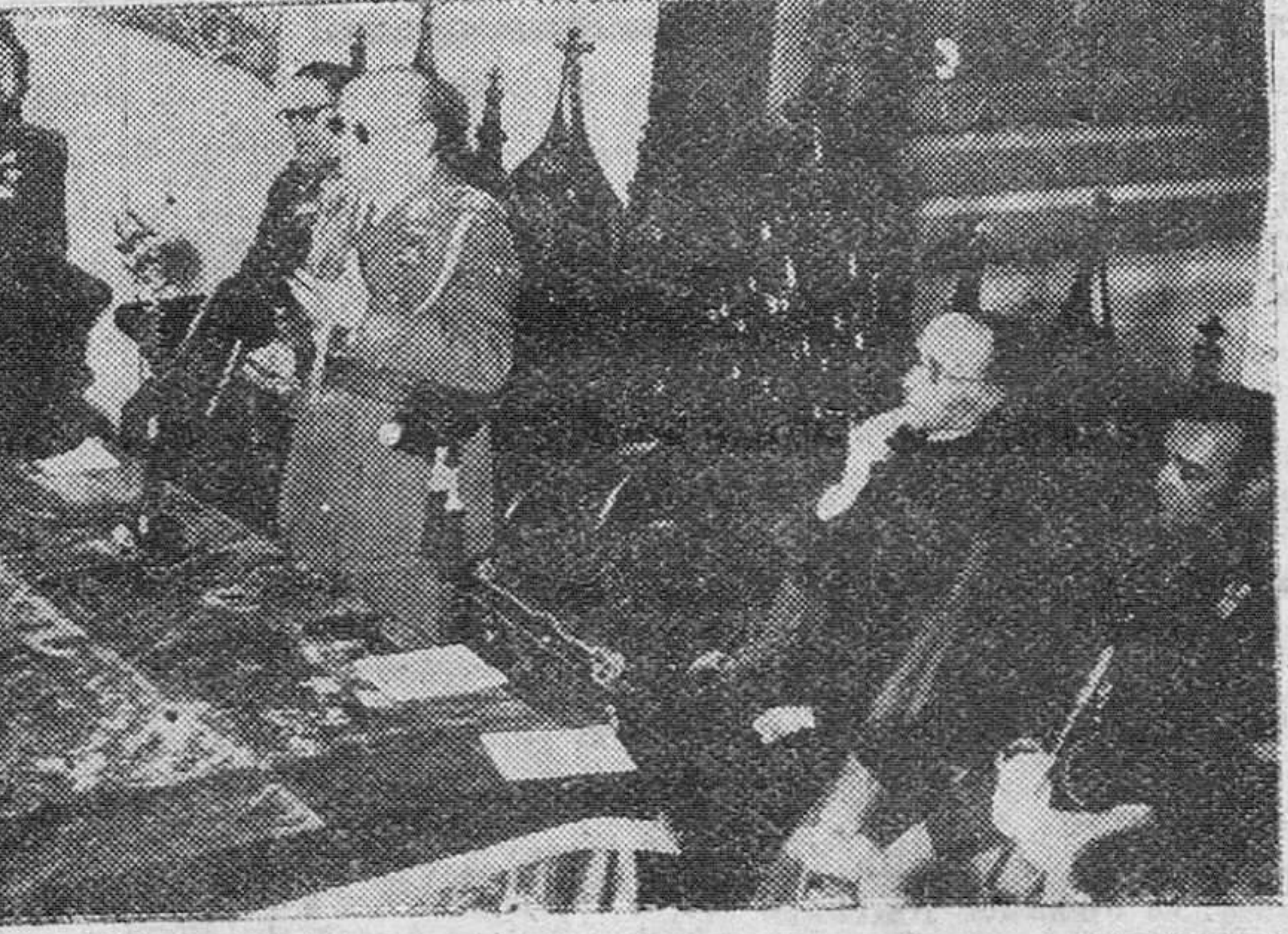
Apertura del I Congreso Nacional de Ex-combatientes Segovia.—El general Moscardó, acompañando de diversas personalidades, preside en el Salón del Acázar la apertura del I Congreso Nacional de Ex-combatientes.

Madrid.—Entre las disposiciones que mañana publica el "Boletín Oficial del Estado" figuran las siguientes ordenes del Ministerio de Hacienda: Se reducen los tipos impositivos del impuesto de Consumos de Lajo y Consumos; se gravan el tabaco torcido, habano; se dictan normas para la celebración de conciertos con las empresas de transportes que utilicen el gas oil como carburante, para el pago del impuesto sobre los transportes interiores de la contribución de Usos y Consumos; se aclaran los preceptos que regulan el gravamen sobre el benzol de producción nacional para usos distintos del de carburante, correspondiente al impuesto sobre el petróleo y sus derivados, integrado en la contribución de Usos y Consumos; se modifican las indemnizaciones del personal facultativo de los servicios provinciales de Catastro y de la riqueza rústica.—Cifra