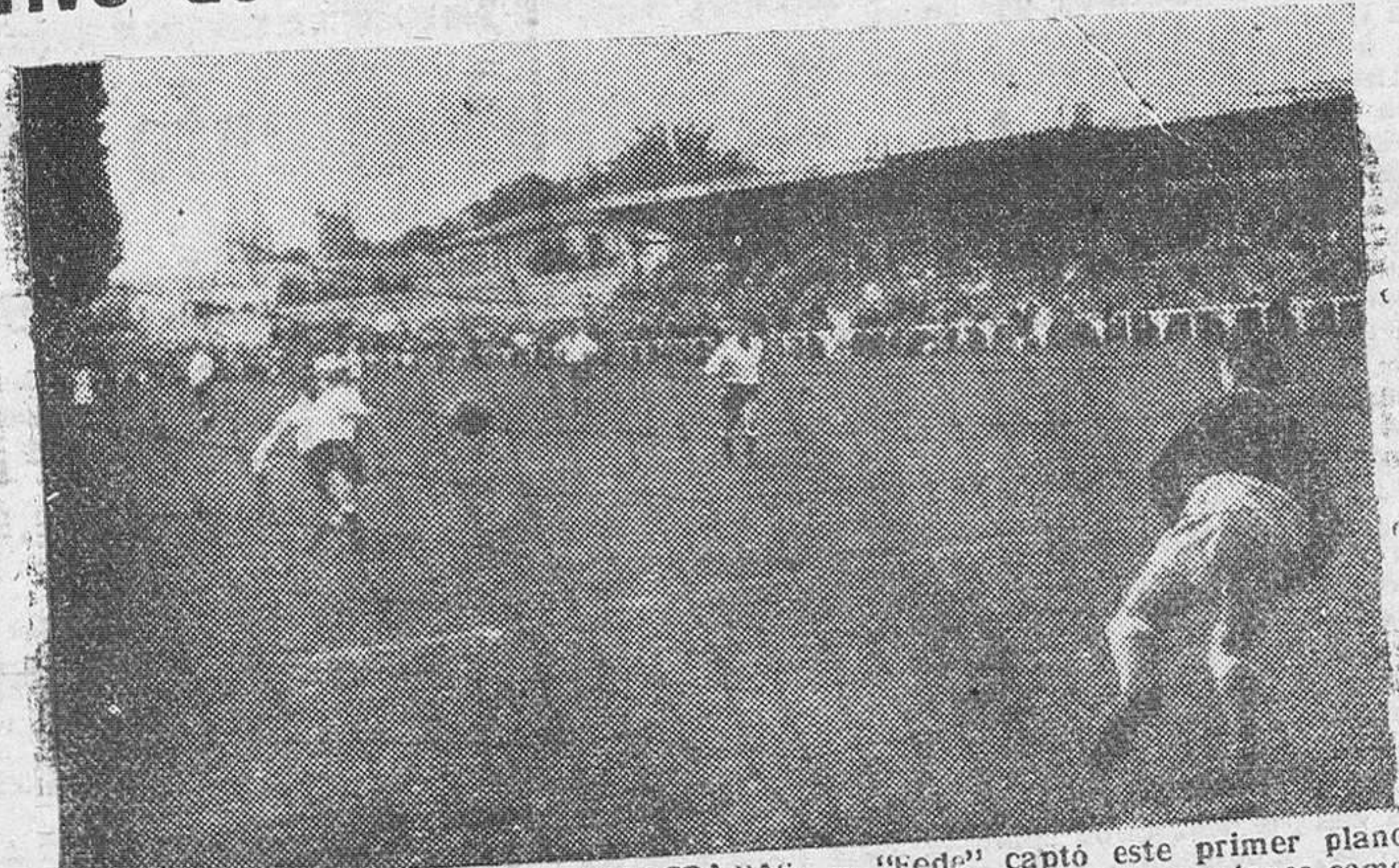
UNA DE LAS OPORTUNIDADES MALOGRADAS. — "Fede" captó este primer plano del partido jugado el domingo y en el que se malograron varias ocasiones como la que aparece en nuestro grabado

En Segunda División destacan los triunfos del Lérica y del Jaén, en Barcelona y Granada