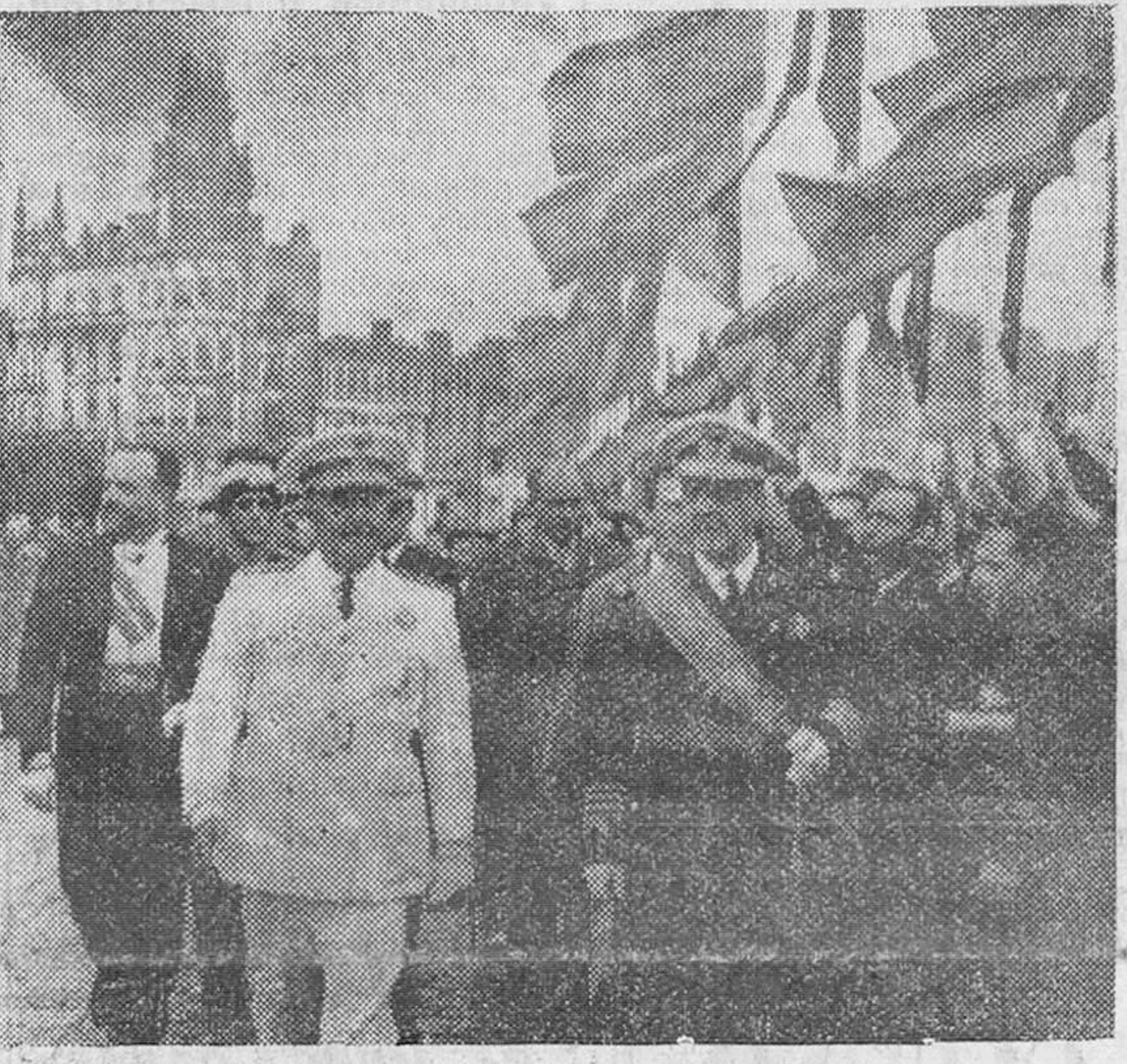
LLEGADA DEL JEFE DEL ESTADO A LA CORUÑA. La Coruña.—Su Excelencia el Jefe del Estado, a su llegada a esta capital, es aclamado por la multitud que le esperaba en el puerto a pesar de la inclemencia del tiempo.