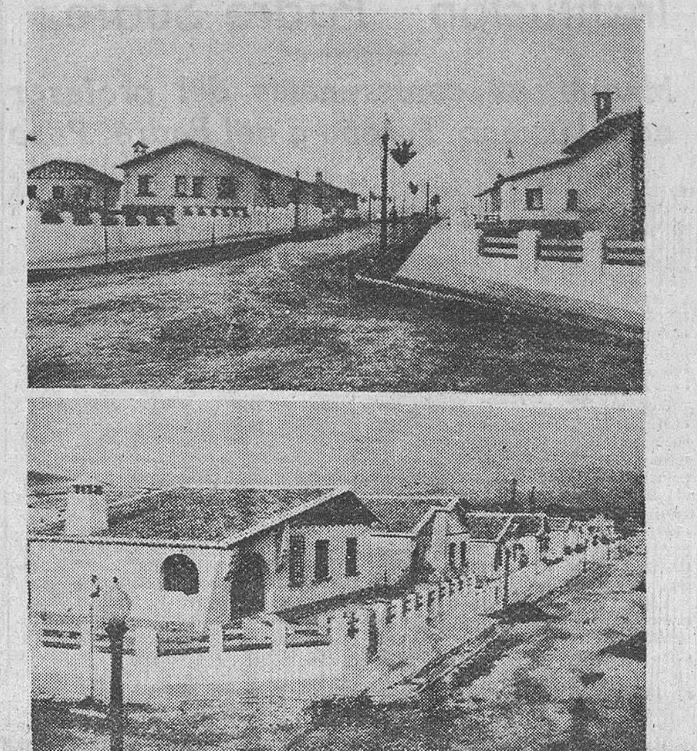
Perspectiva de una de las calles del poblado de F.F.F.S.A., que hoy será inaugurado solemnemente en Miranda de Ebro y un detalle de las nuevas viviendas.