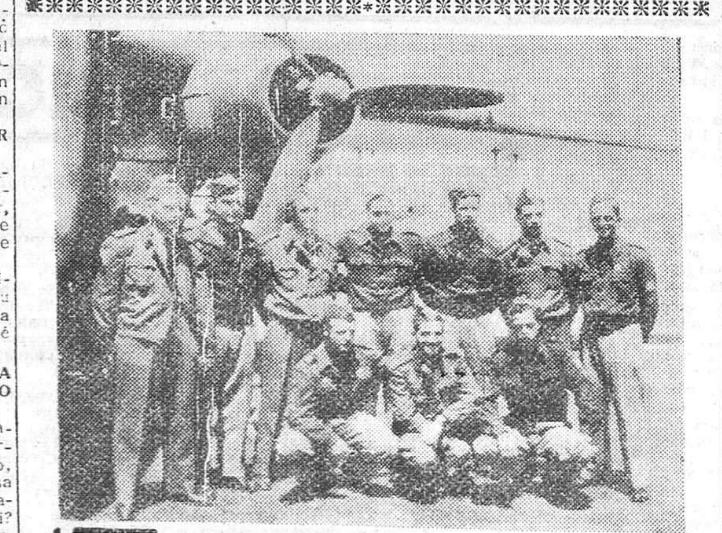
Cadetes de aviación españoles y portugueses a Estados Unidos se fotografiaron en el aeropuerto de Barajas momentos antes de tomar el avión que les conducirá a Estados Unidos en viaje de estudios, en reciprocidad con los cadetes norteamericanos.