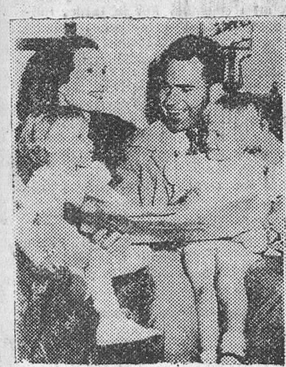
Nixon, candidato a la Vicepresidencia por el partido republicano, aparece aquí en la intimidad del hogar, rodeado de su familia.