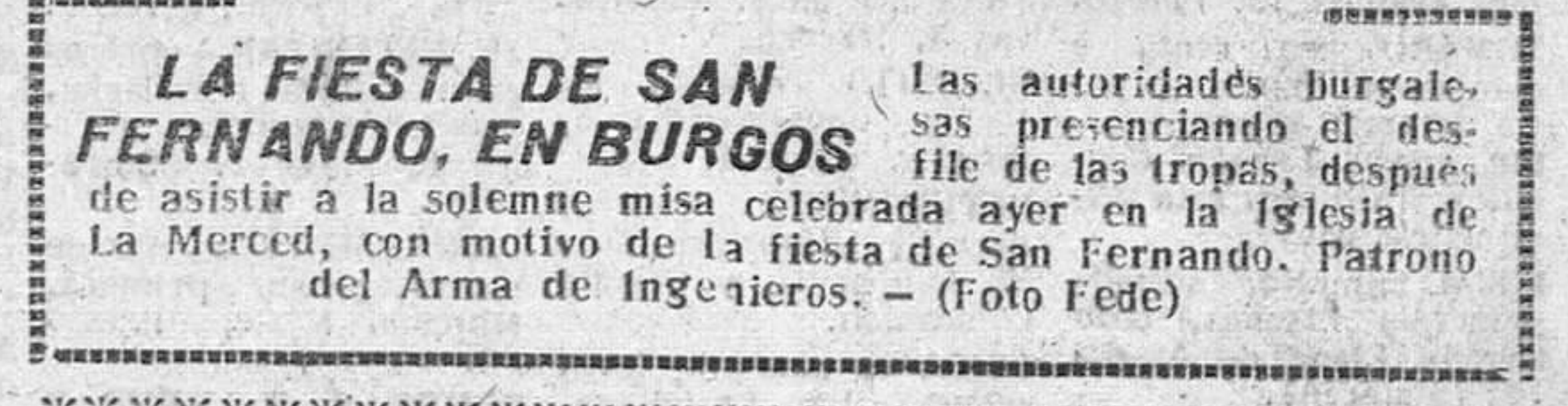
LA FIESTA DE SAN FERNANDO, EN BURGOS. Las autoridades burgalesas presenciando el desfile de las tropas...