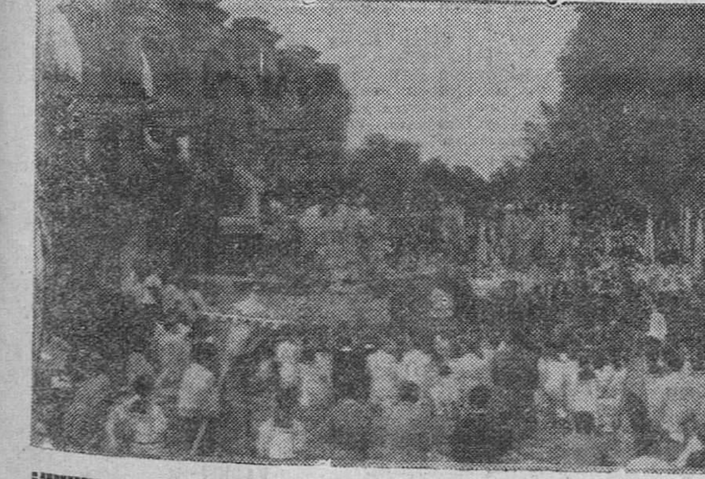
Fiesta eucarística infantil en Burgos Dos documentos gráficos de la solemnisima fiesta eucarística infantil celebrada ayer tarde en nuestra ciudad, de adhesión al XXXV Congreso Eucarístico Internacional de Barcelona. A la izquierda, centenares de niños burgaleses, la ceremonia celebrada, como se sabe, en el Paseo de la Isla.