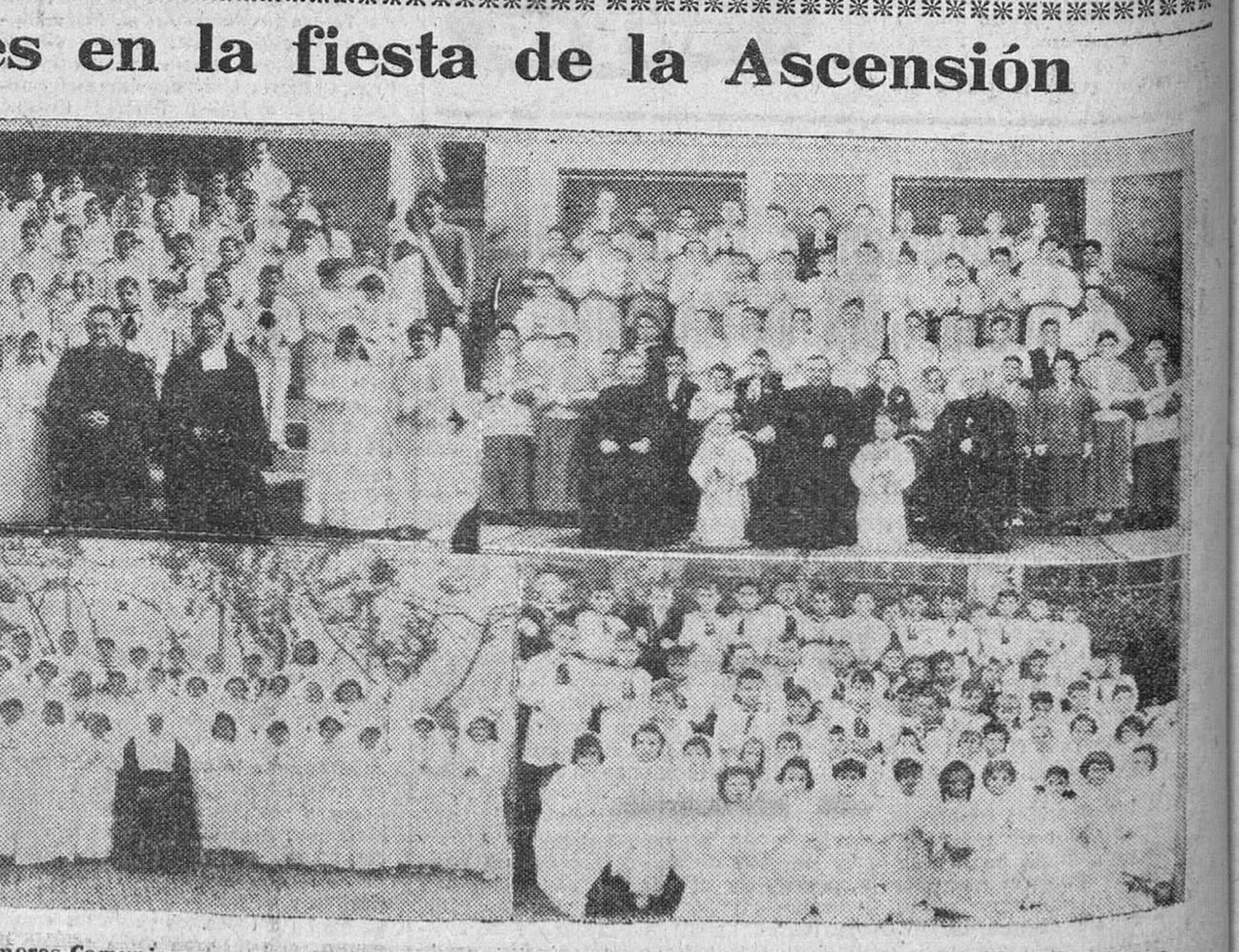
Climularon ayer, festividad de la Ascensión, las solemnidades de las Primeras Comuniones en nuestra ciudad. En el reportaje gráfico de "Fede" aparecen en los dos primeros grabados, los comulgantes del Colegio "La Salle"; en el tercero, los del de "San Antonio" y en el plano inferior, grupos pertenecientes a la "S. E. S. A.", Colegio de la Milagrosa y Seminario de San Jerónimo.