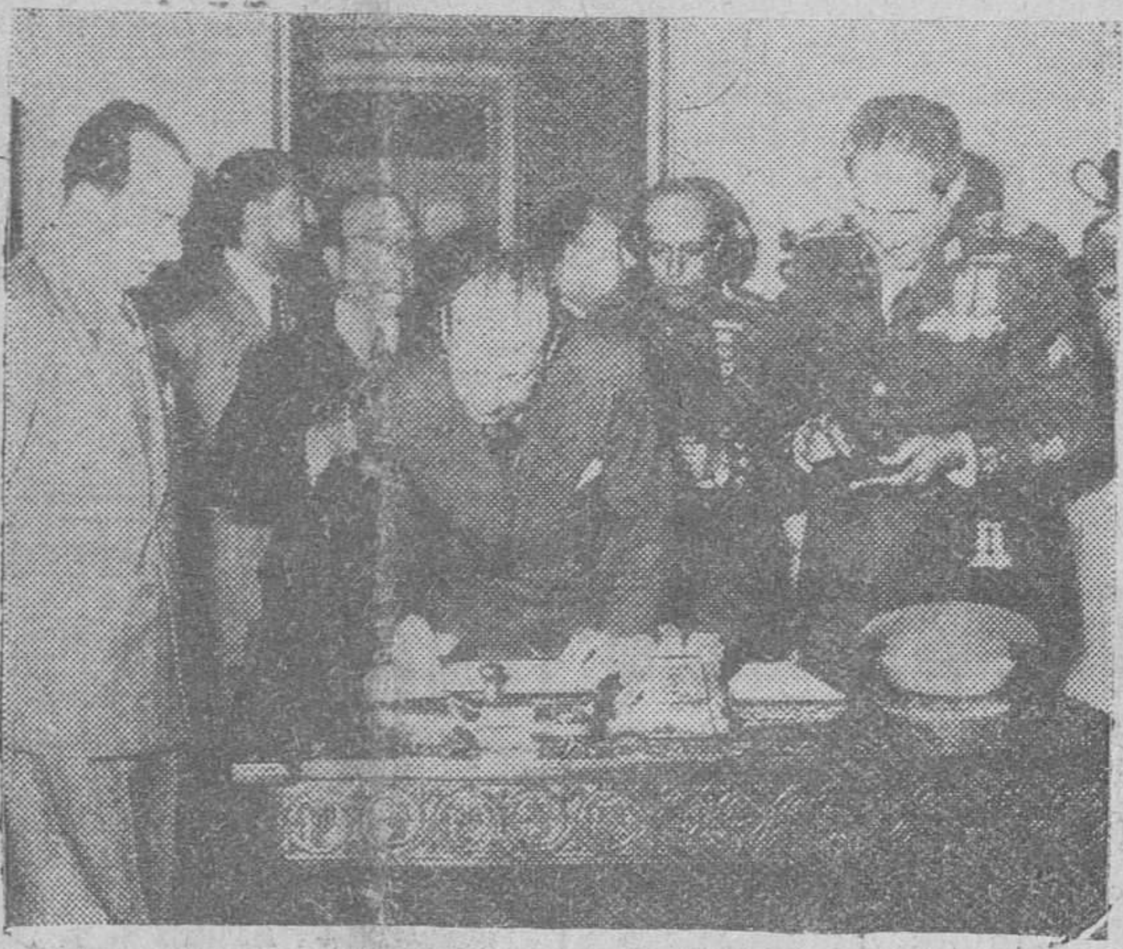
Damasco.— Los miembros de la Misión española, en el momento de firmar en el Libro de Honor de la Presidencia de la República, al poco tiempo de su llegada a la capital siria.

Washington.—La guerra entre el Japon y las potencias aliadas, termina oficialmente a las 15,15 (hora española) del próximo lunes, momento en que el secretario de Estado de los