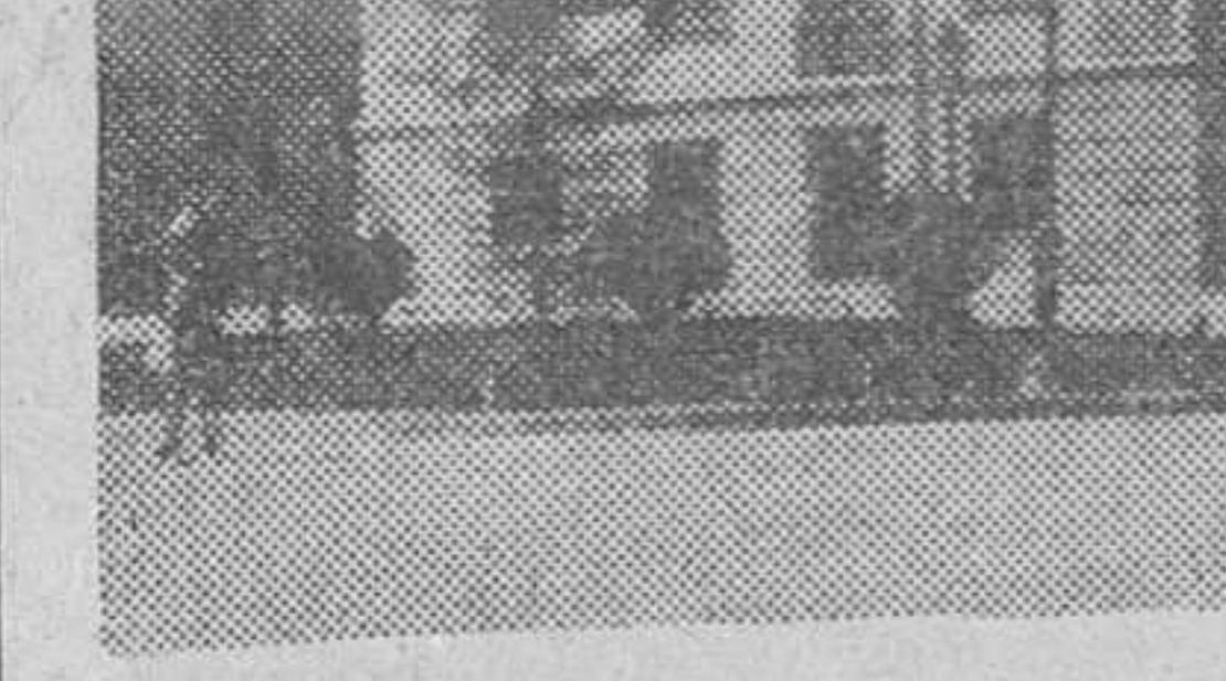
Inauguración de un grupo escolar Madrid.—Una vista del grupo escolar "República Argentina", dotado de dispensario escolar, que ha sido inaugurado en Madrid, con asistencia del ministro de Educación Nacional, patriarca obispo de Madrid-Alcalá y el alcalde de la capital.

Antes de marchar, los marineros norteamericanos entregaron un generoso donativo al Prelado para las atenciones benéficas.