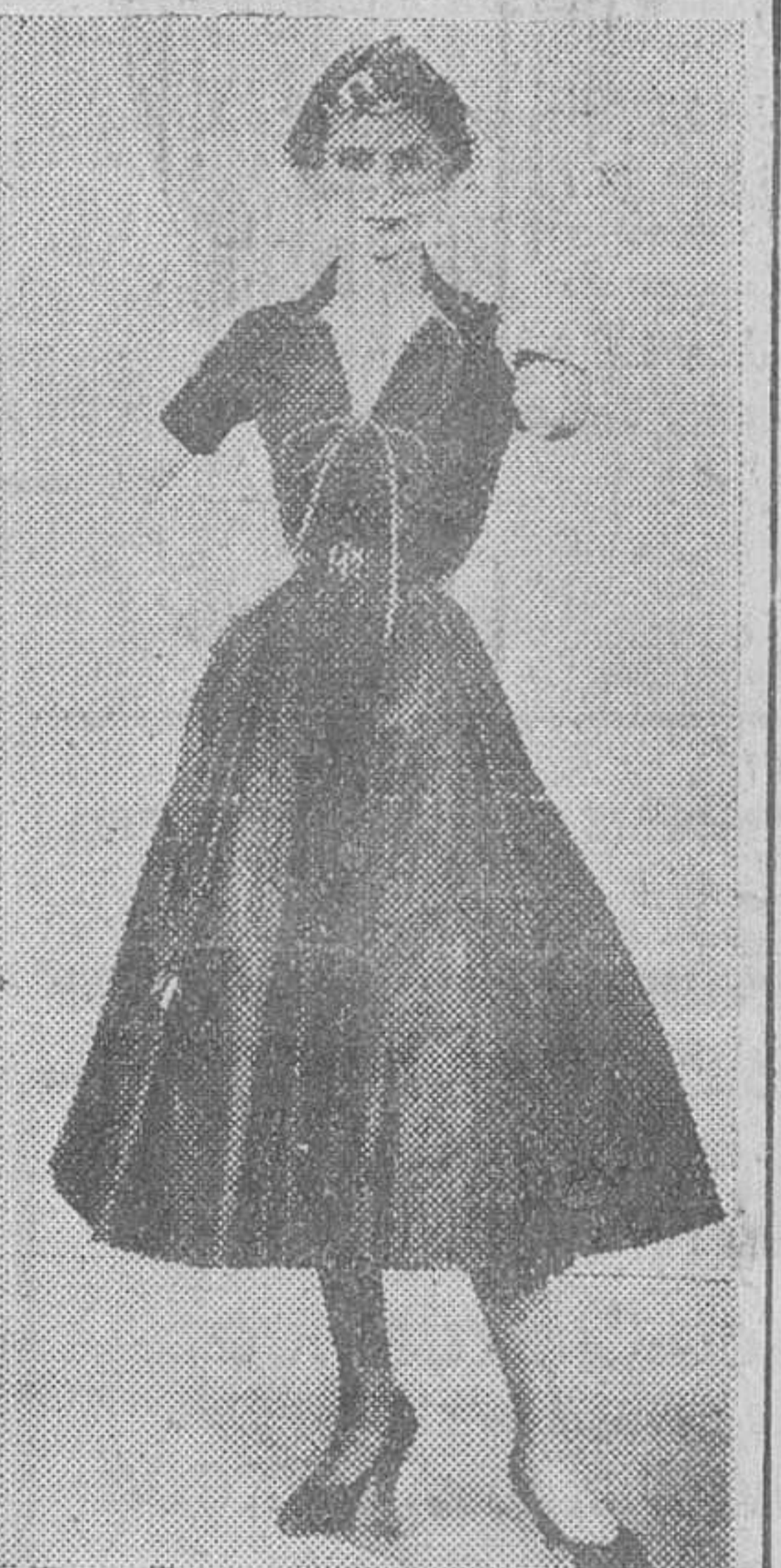
Vestido de tafetán negro para la noche con cordón rojo en tafetán cinturón cuero

un modisto, que es el último descendiente de una dinastía de grandes costureros, los Worth. El primero que usó este nombre fue lanzado por la emperatriz Eugenia, en una época en que únicamente las mujeres se dedicaban a confeccionar vestidos. El biznie-