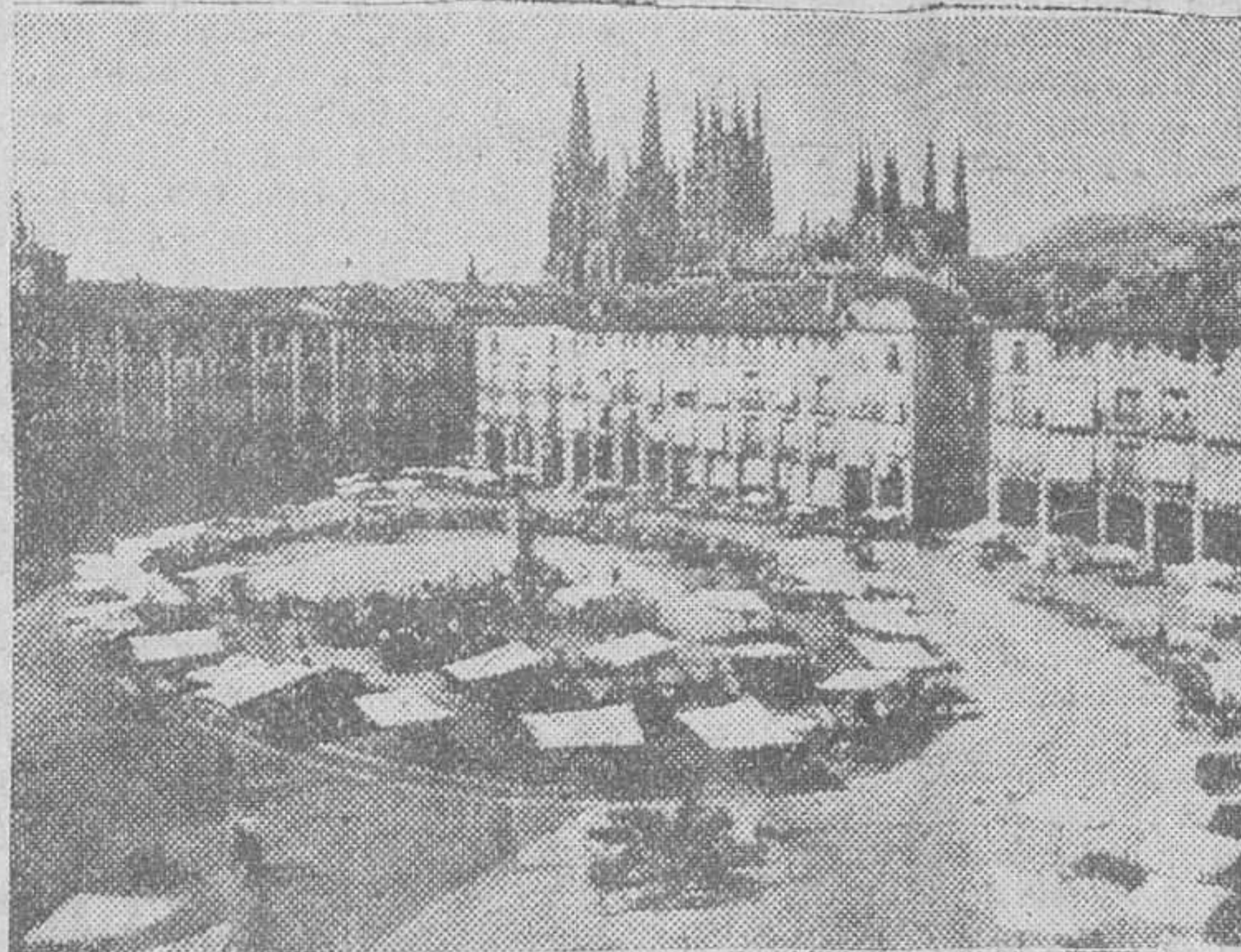
PERSPECTIVA DE LA PLAZA MAYOR A FINES DE SIGLO

va calle directa a la Plaza del Rey San Fernando, a través de la calle de Sombrecilla, los técnicos municipales, en lugar de estimar la Plaza Mayor como un lugar de recreo, la consideraron como un foco de tráfico importantísimo y de aparcamiento. Máxime si se considera que la carencia de zonas modernas de aparcamiento de vehículos en Burgos es evidente y se hace sentir de modo especial en época estival, por su condición de ciudad veraniega y turística. Es decir, el Ayuntamiento se encontraba ante dos soluciones. Hubo diversas reuniones para ver de estudiar la posibilidad de arborizar uno y otro aspecto y el Municipio aceptó el criterio sustentado en el plano de ensanche, sobre el cual se está replanteando. O lo que es igual, se sacrificó la aspiración meramente artística en beneficio del sentido práctico.