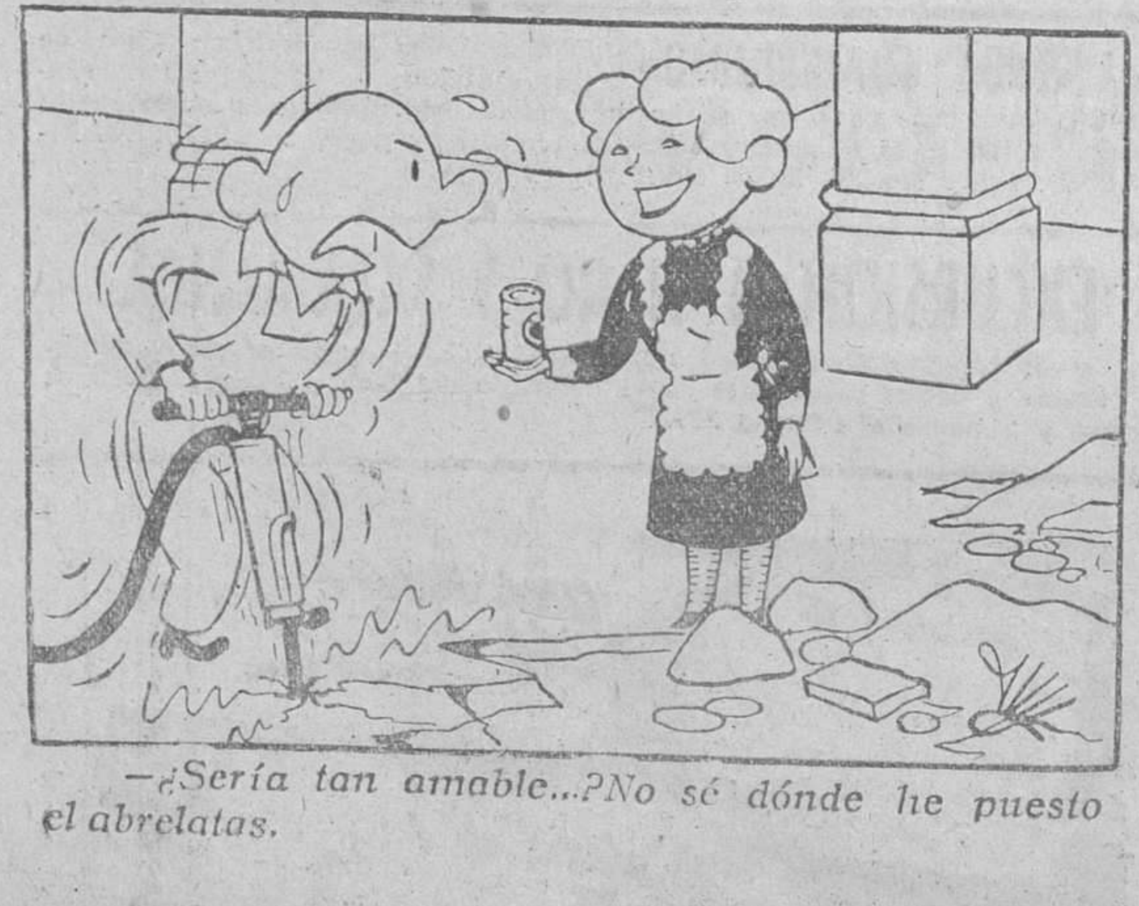
—Sería tan amable...? No sé dónde he puesto el abrelatas.