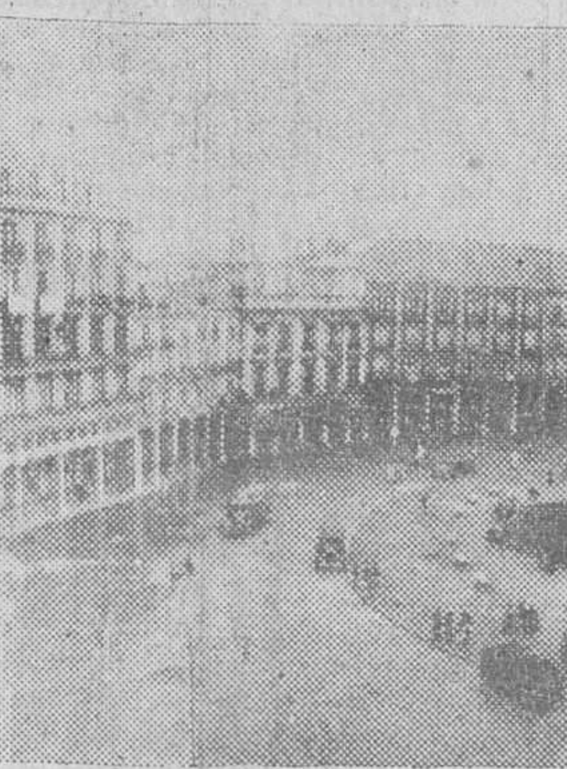
ASI ESTA HOY LA PLAZA MAYOR, DISPUESTA PARA SER OBJETO DE LA HONDA TRANSFORMACION A QUE SE REFIERE NUESTRO REPORTAJE.

En resumen: la vieja Plaza Mayor se remozará. Falta le hacía, ya que su estado era bien decrepito e impropio, dada su condición de centro y corazón mismo de la ciudad. La transformación que se acomete es, desde luego, muy interesante y trascendente por la serie de ventajas de todo tipo que lleva anejas. Y esas ventajas se harán más ostensibles y muy gratas para los burgaleses, si sirven de base para estudiar una ordenación relativa de cuantos edificios integran el núcleo urbano de nuestra querida Plaza Mayor.