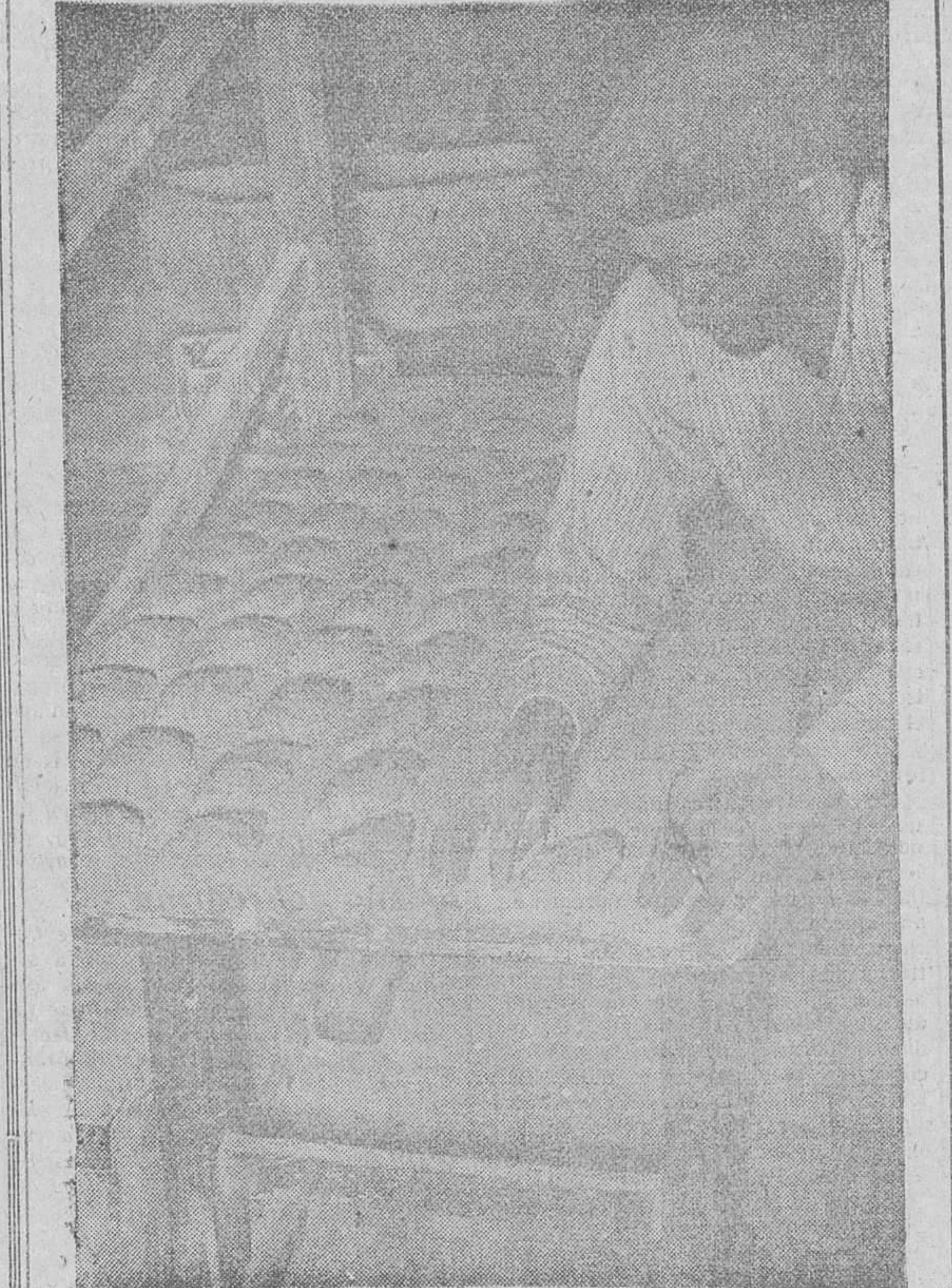
CON LA DISPOSICION RECIENTE DEL GOBIERNO REFERENTE AL SUMINISTRO COMPLEMENTARIO DE PAN, LAS TAJONAS TRABAJAN LABORIOSAMENTE PARA ATENDER A SU CLIENTELA QUE, CON GRAN SATISFACCION, HAN VISTO EL INCREMENTO DE ESTA FUNDAMENTAL BASE ALIMENTICIA.

propio interés, deben prestar al Gobierno, es muy probable que se dé un gran paso en el próximo año para la venta libre de pan y normalización del mercado triguero.