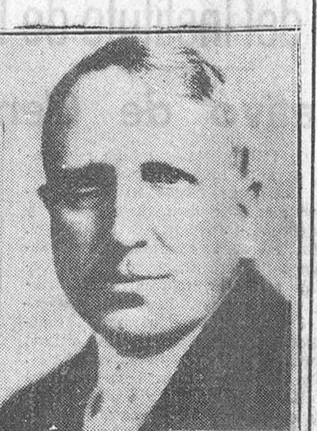
William Randolph Hearst, promotor del periodismo sensacionalista y enemigo implacable del comunismo, ha muerto a la edad de 88 años.