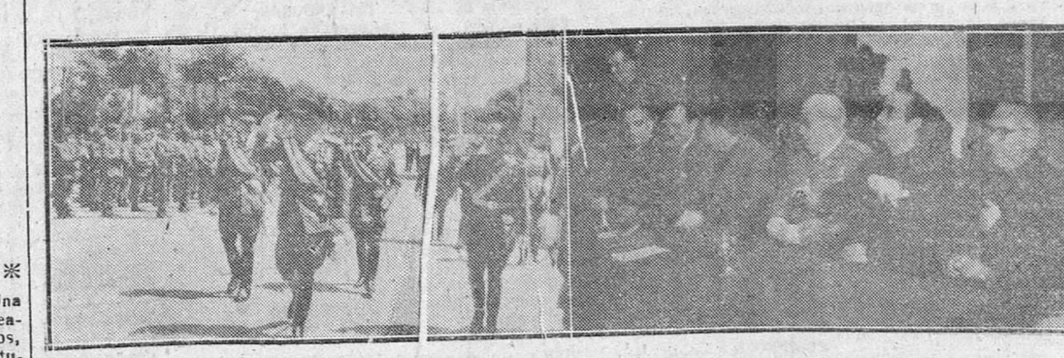
A la izquierda, el teniente general Yagüe revisando a las tropas de Sanidad que asistieron a la misa celebrada ayer, con motivo de la fiesta de su Patrona, Nuestra Señora del Perpetuo Socorro. A la derecha, presidencia del acto de clausura de la Semana Pedagógica, que ha venido desarrollándose durante los últimos días en nuestra ciudad.