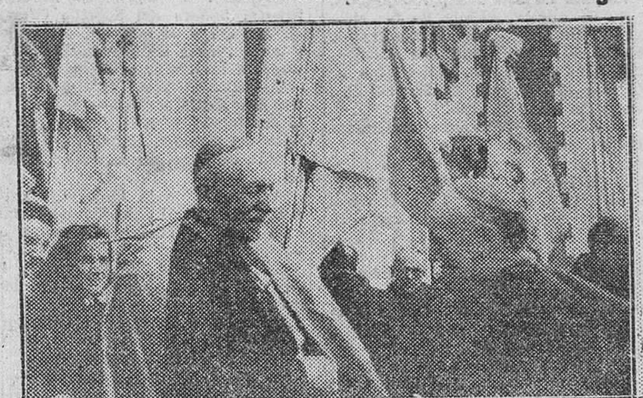
El secretario de la Congregación de Propaganda Fide, monseñor Constantini despidiéndose de nuestro reverendísimo Prelado, después de visitar el Seminario del Instituto Español para Misiones Extranjeras