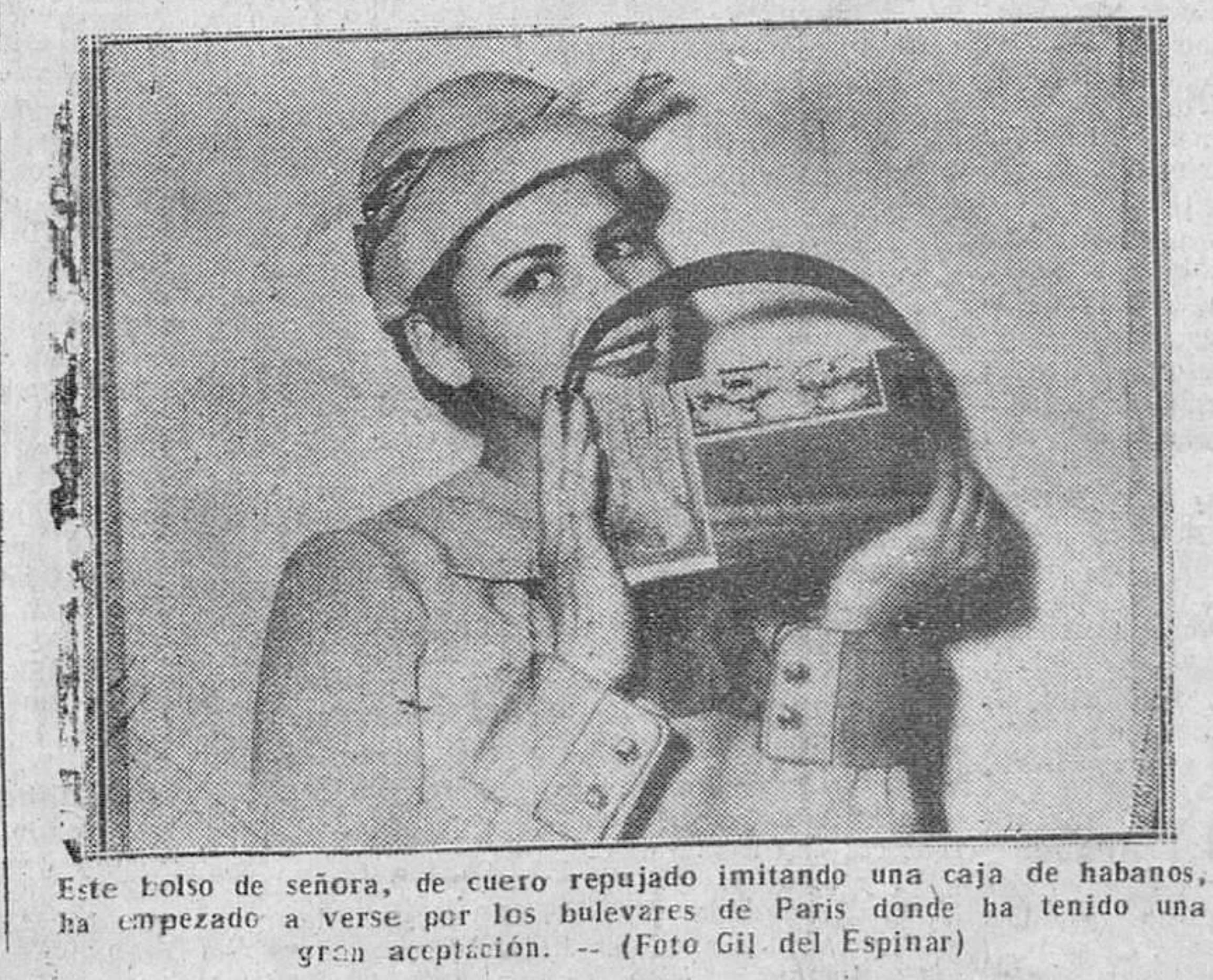
Este bolso de señora, de cuero repujado imitando una caja de habanos, ha empezado a verse por los bulevares de París donde ha tenido una gran aceptación.