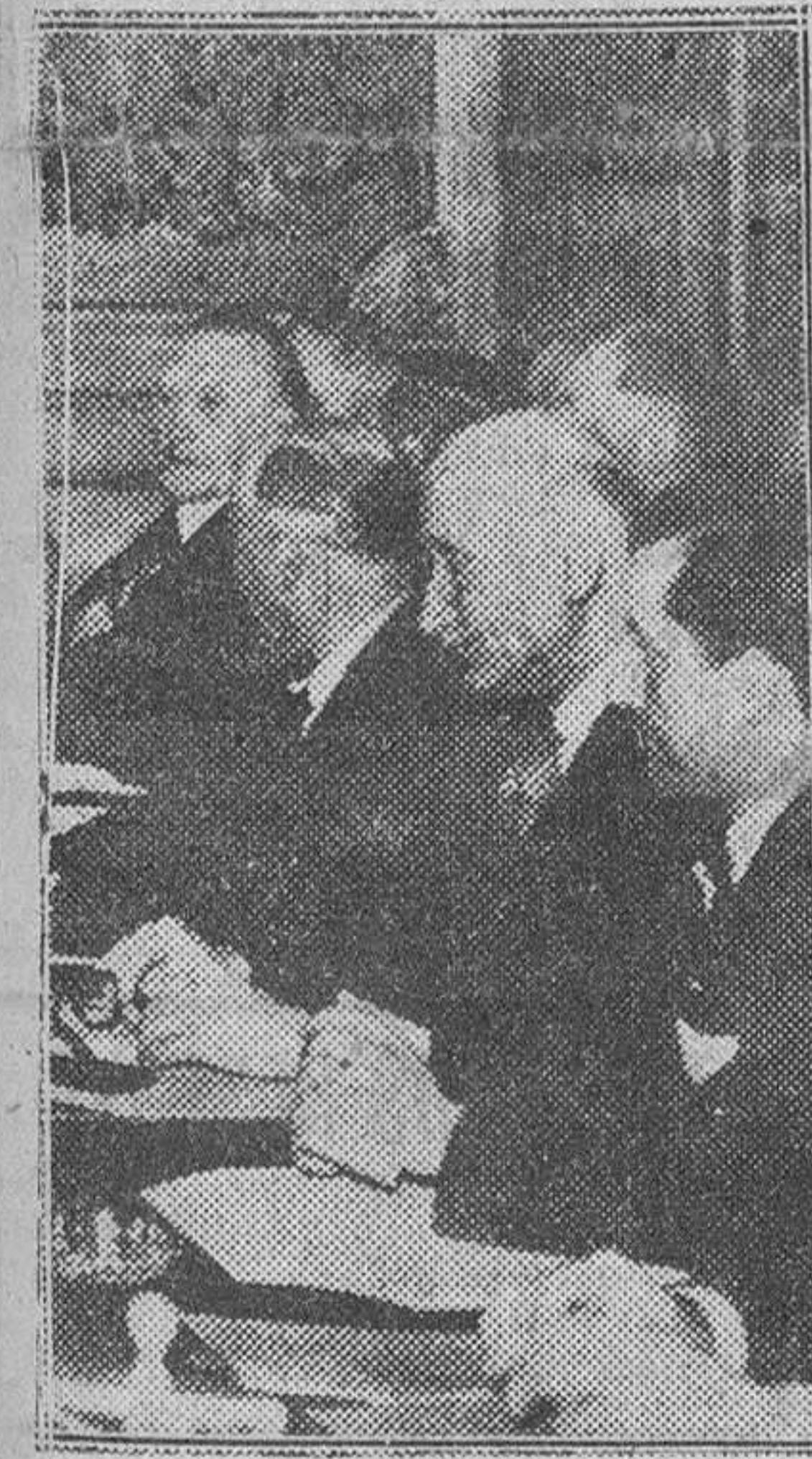
Paris. — Un momento de la Conferencia sobre el Plan Schuman celebrada en París con asistencia de su autor. La nota predominante de la reunión estuvo en la presencia del canciller Adenauer, que representaba a su país.

Pleno auge de la exportación de naranja española a Francia