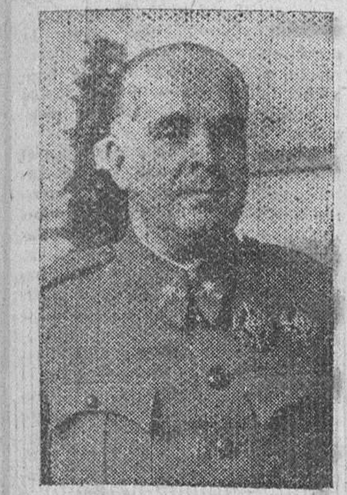
RASGOS BIOGRAFICOS DEL ILUSTRE SCLDADO

Por orden del Generalísimo, los restos del Alto Comisario en Marruecos serán trasladados a la Península en un cañonero