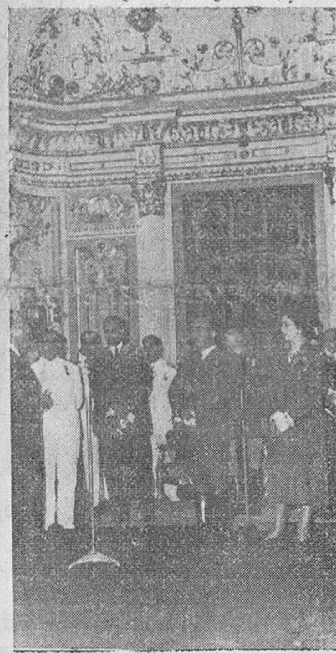
El alcalde de la ciudad de Las Palmas, capital de Gran Canaria, da la bienvenida a S. E. el Jefe del Estado y a su distinguida esposa, en la recepción celebrada en el Ayuntamiento de dicha capital.—(Scrip).