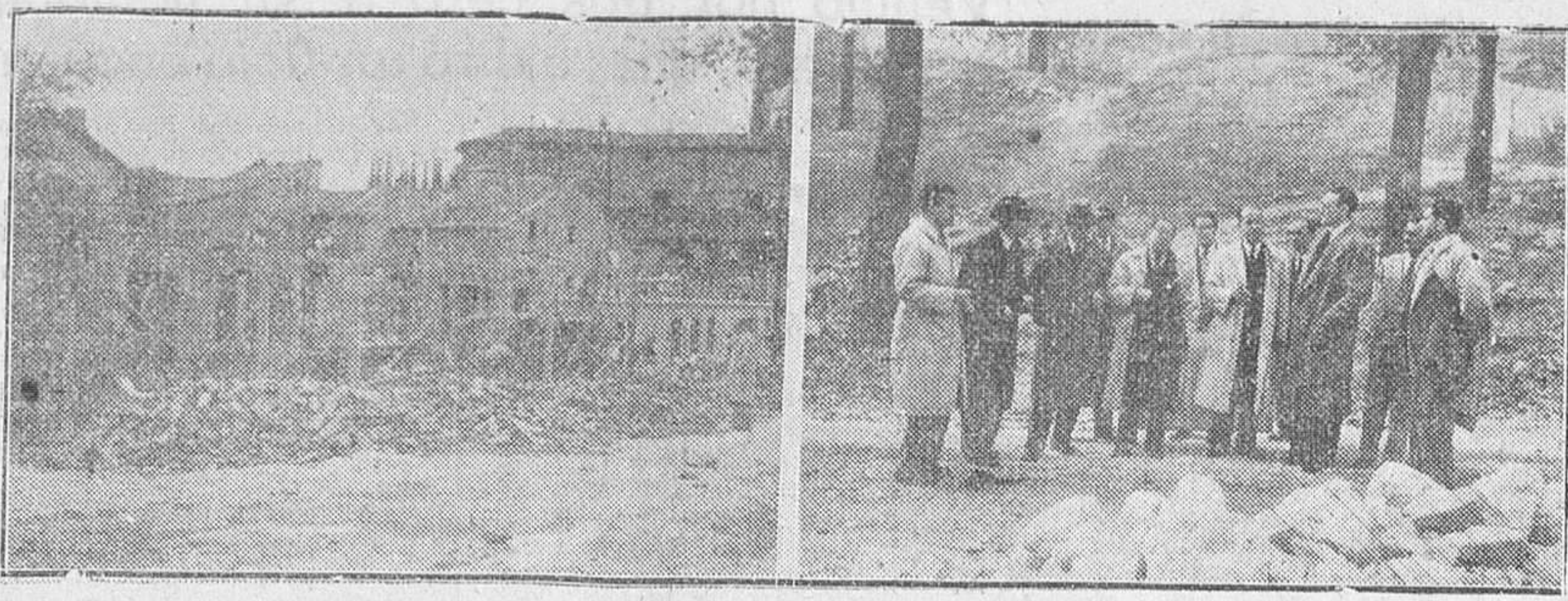
EN EL BARRIO DE SAN ESTEBAN, COMO ES SABIDO, SE ESTA CONSTRUYENDO EL PRIMER BLOQUE DE VIVIENDAS CON QUE LA CAJA DE AHORROS MUNICIPAL INICIA SU AMPLIO PLAN DE TRANSFORMACION DEL BARRIO DE SAN ESTEBAN. EN NUESTROS GRABADOS, UN ASPECTO DE LA SITUACION ACTUAL DE LAS OBRAS Y EL ALCALDE, CON EL DIRECTOR-GERENTE, CONSEJEROS Y FACULTATIVOS EN LA VISITA EFECTUADA CON MOTIVO DEL DIA UNIVERSAL DEL AHORRO.