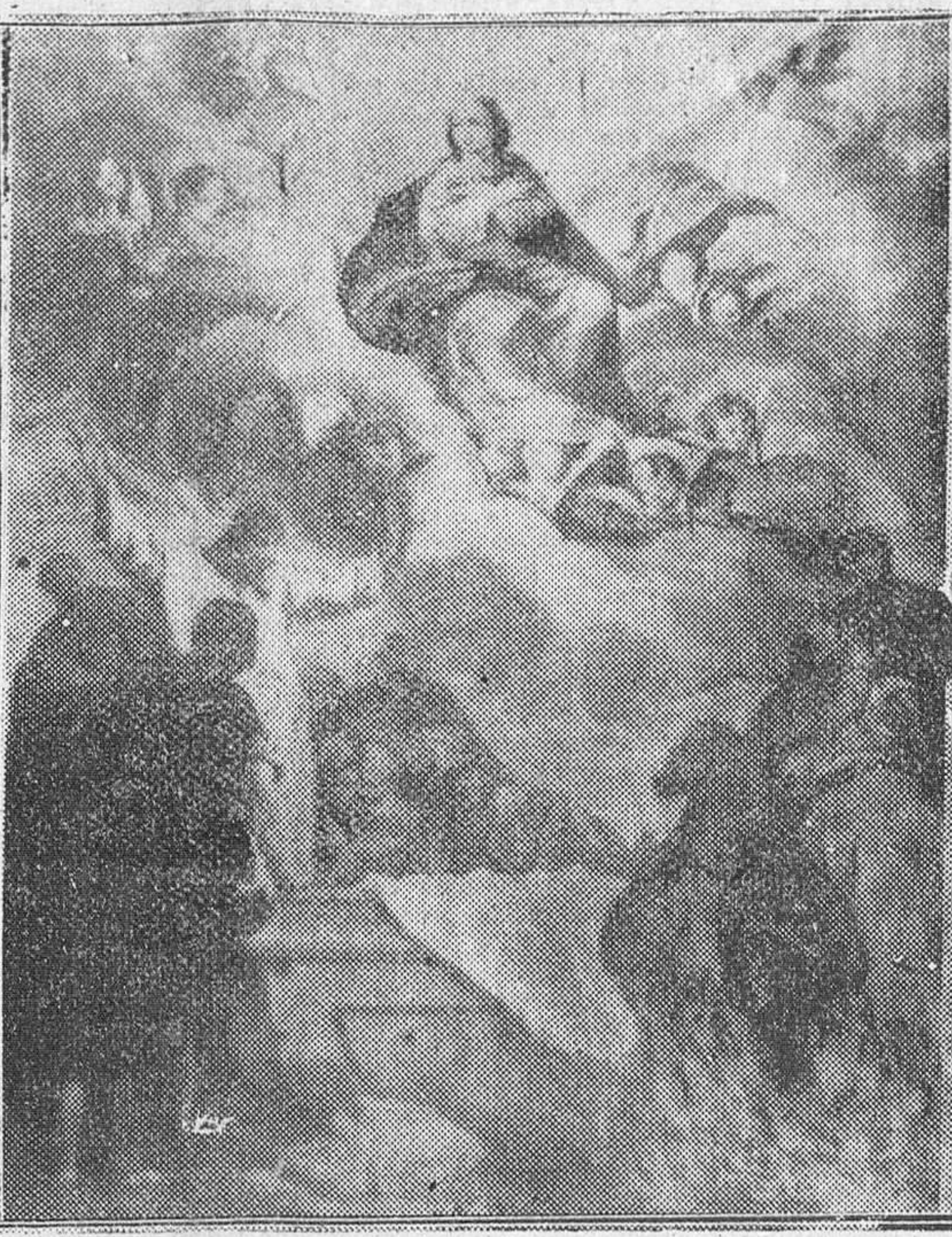
CUADRO DE LA GLORIOSA ASUNCION DE LA SANTISIMA VIRGEN A LOS CIELOS Y QUE FORMA PARTE DEL RICO TESORO ARTISTICO DE NUESTRO TEMPLO CATEDRALICIO.