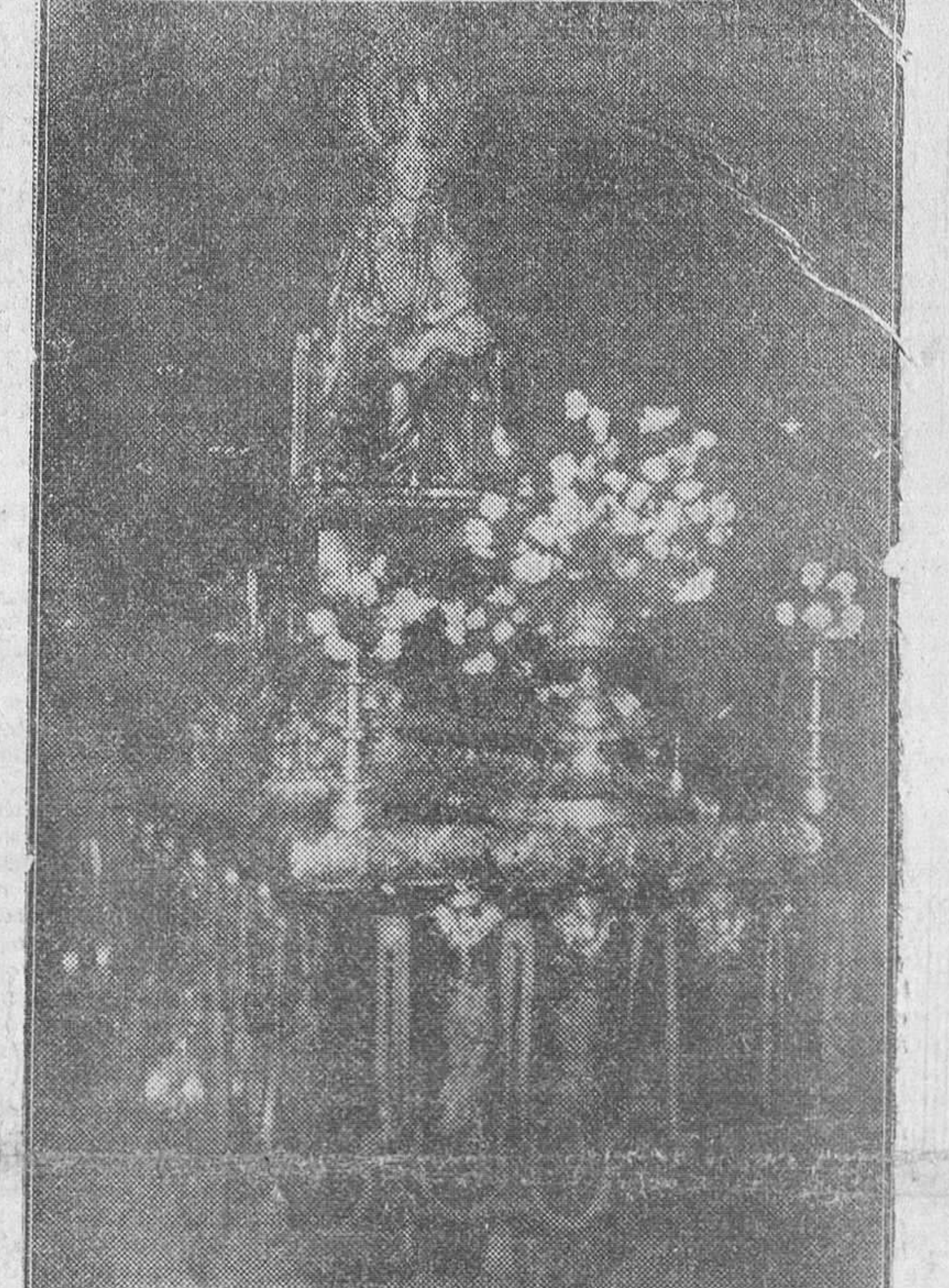
CON SOLEMNISIMOS ACTOS, DE LOS QUE DAMOS CUENTA EN SEGUNDA PAGINA, BURGOS CONMEMORO EN EL DIA DE AYER LA EFEMERIDES GLORIOSA DE LA DEFINICION DEL DOGMA ASUNCIONISTA. EN NUESTRO GRABADO, LA IMAGEN DE LA EXCELSA PATRONA DE LA DIOCESIS, EN LA CATEDRAL DURANTE LA SOLEMNE VELA CELEBRADA EN LA MAÑANA DEL DOMINGO EN NUESTRO S. T. M.

En nuestra ciudad fué subrayado el memorable acontecimiento con extraordinario fervor religioso