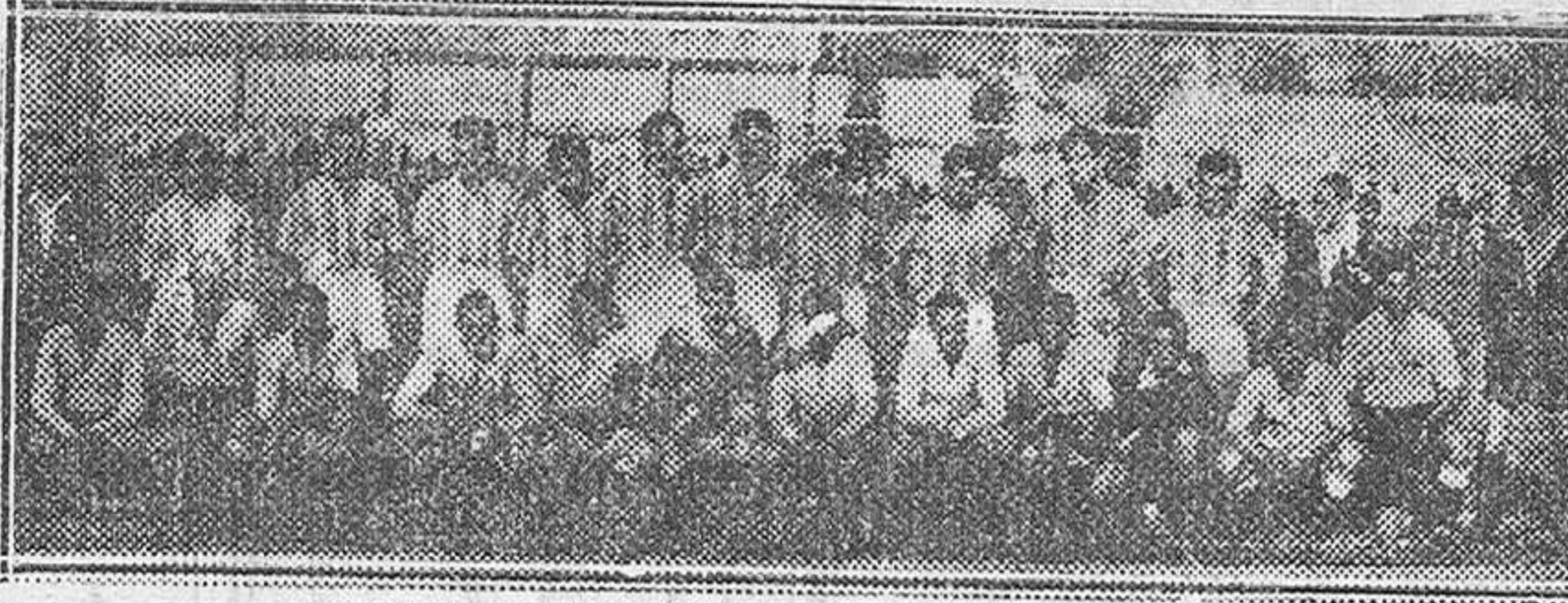
EL DOMINGO CONTENDIERON EN LA TORRE, EN EL PRIMER PARTIDO DE FUTBOL DE FERIAS, LOS EQUIPOS D EL REAL VALLADOLID Y DEL BURGOS. -- AQUI VEMOS A AMBOS CON JUNTOS POSANDO PARA NUESTRO FOTOGRAFO DURANTE EL DESCANSO. -- (Foto FEDE)