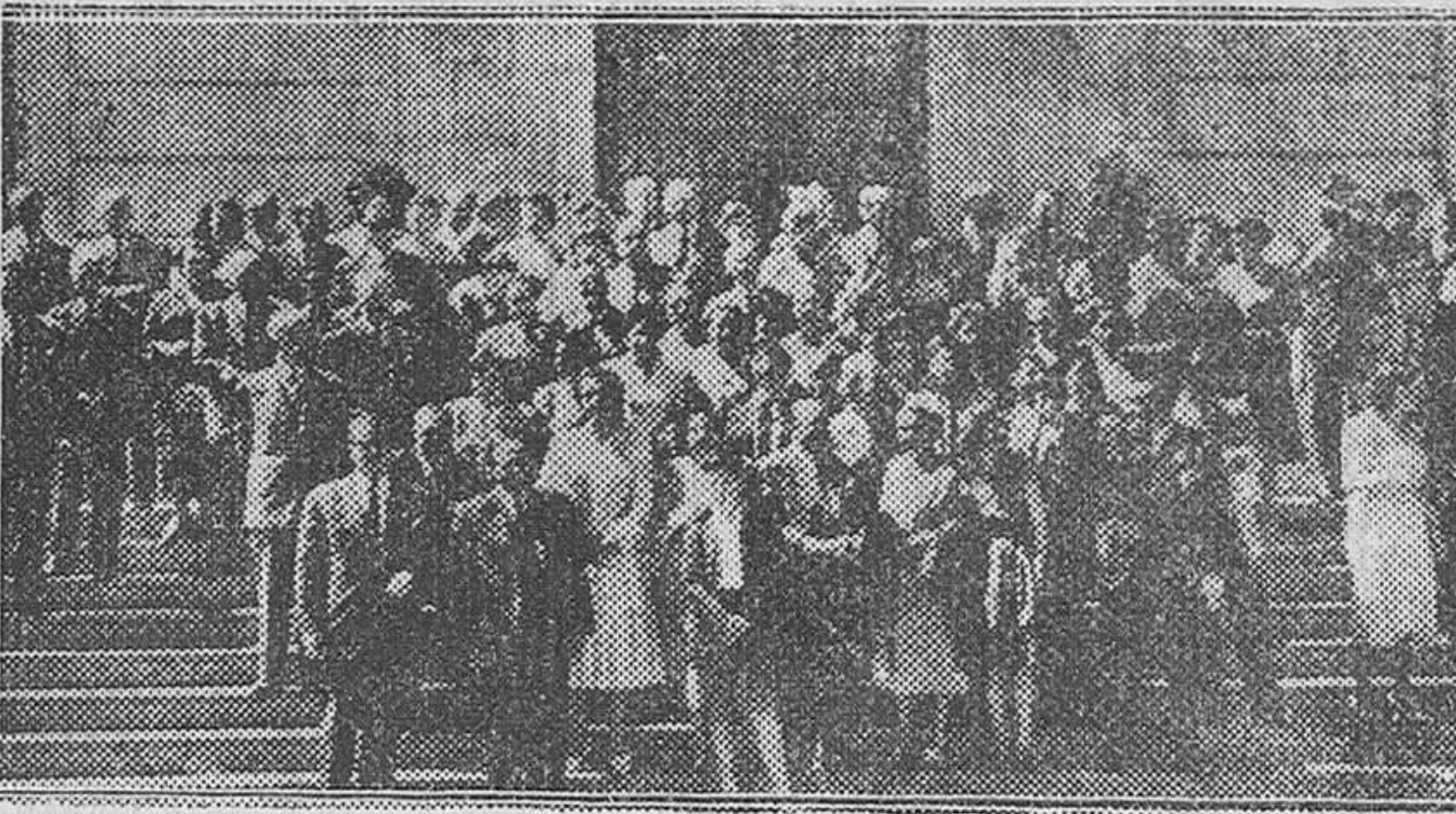
LOS MIEMBROS DEL CONGRESO HISPANO - LUSITANO DE HIDROLOGIA POSAN PARA "FEDE" EN LA ESCALINATA PRINCIPAL DE LA RESIDENCIA DE OFICIALES, DONDE ALMORZARON AYER, AL REGRESO DE LOS BALNEARIOS DEL NORTE.