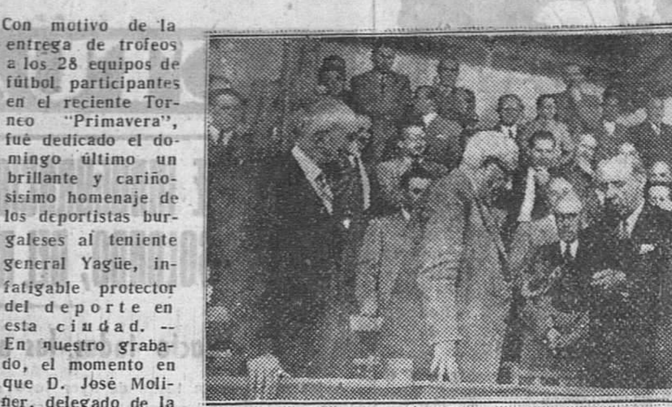
Con motivo de la entrega de trofeos a los 28 equipos de fútbol participantes en el reciente Torneo "Primavera", fue dedicado el domingo último un brillante y cariñoso homenaje de los deportistas burgaleses al teniente General Yagüe, infatigable protector del deporte en esta ciudad. En nuestro grabado, el momento en que D. José Moliner, delegado de la Federación Guipuzcoana en Burgos, entrega al glorioso soldado un álbum con las fotografías de los equipos participantes en el aludido torneo.