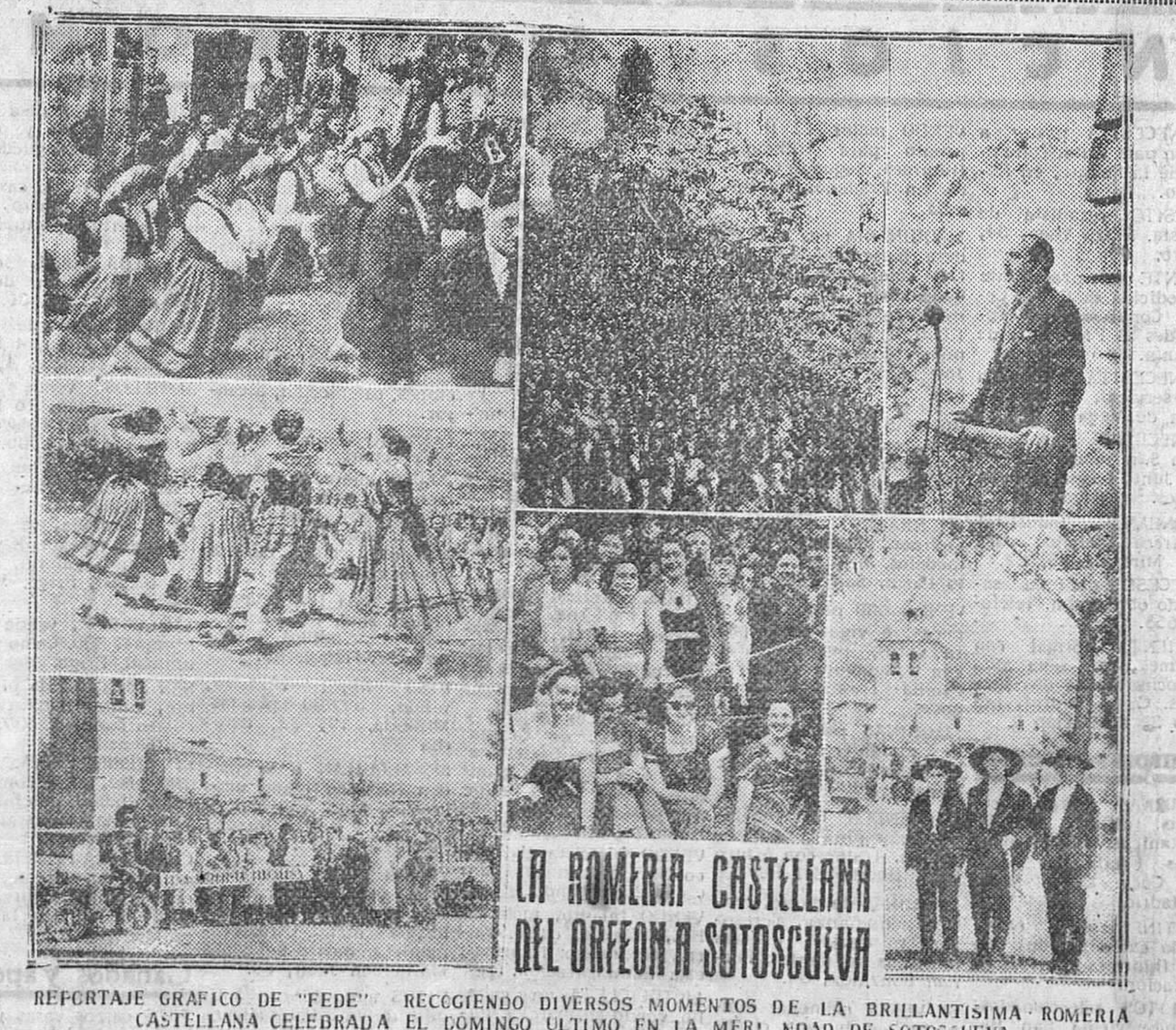
REPORTAJE GRAFICO DE "FEDE" RECOCIENDO DIVERSOS MOMENTOS DE LA BRILLANTISIMA ROMERIA CASTELLANA CELEBRADA EL DOMINGO ULTIMO EN LA MERINDAD DE SOTOSCUEVA

Palencia.—Sobre Villamoriel de Cerrato, ha descargado esta tarde una fuerte tormenta, acompañada de gran aparato eléctrico y una lluvia torrencial que inundó muy pronto las calles del pueblo. Al mismo tiempo, en el paraje de la magnitud, que por las laderas convertidas en enormes cauces, discurren verdaderos ríos. Las aguas inundaron en su totalidad las bodegas del pueblo, en algunas de las cuales llegaron hasta el techo. Poco después cayó una enorme granizada. El temporal ha causado daños muy considerables.