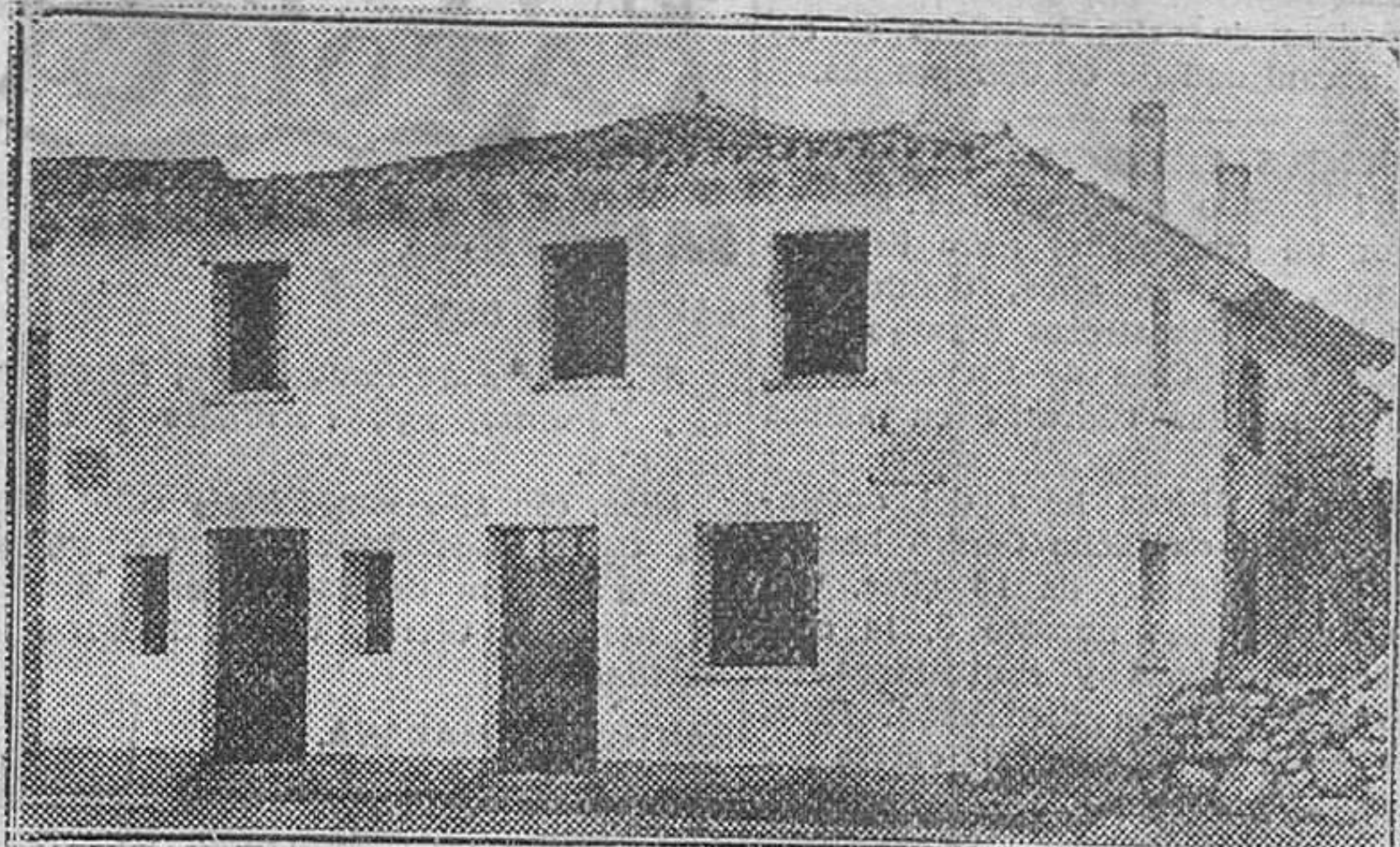
HE AQUÍ LA ESCUELA INAUGURADA POR LA PRIMERA AUTORIDAD DE LA PROVINCIA EN ALBILLOS, OBRA REALIZADA POR LA JUNTA TÉCNICA.