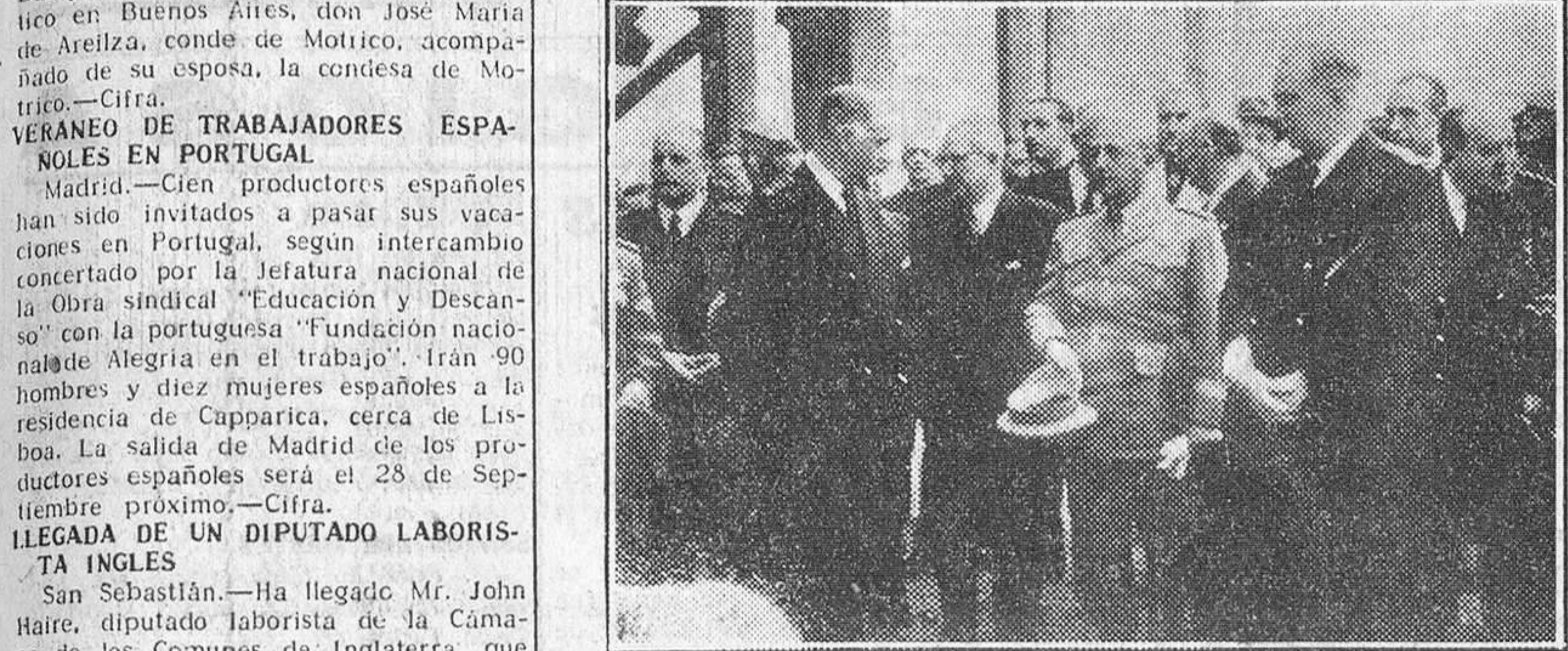
Gijón.—S. E. el jefe del Estado con los ministros de Industria y Comercio, Obras Públicas y Marina y otras personalidades recorren las instalaciones de la mina "La Comocha".