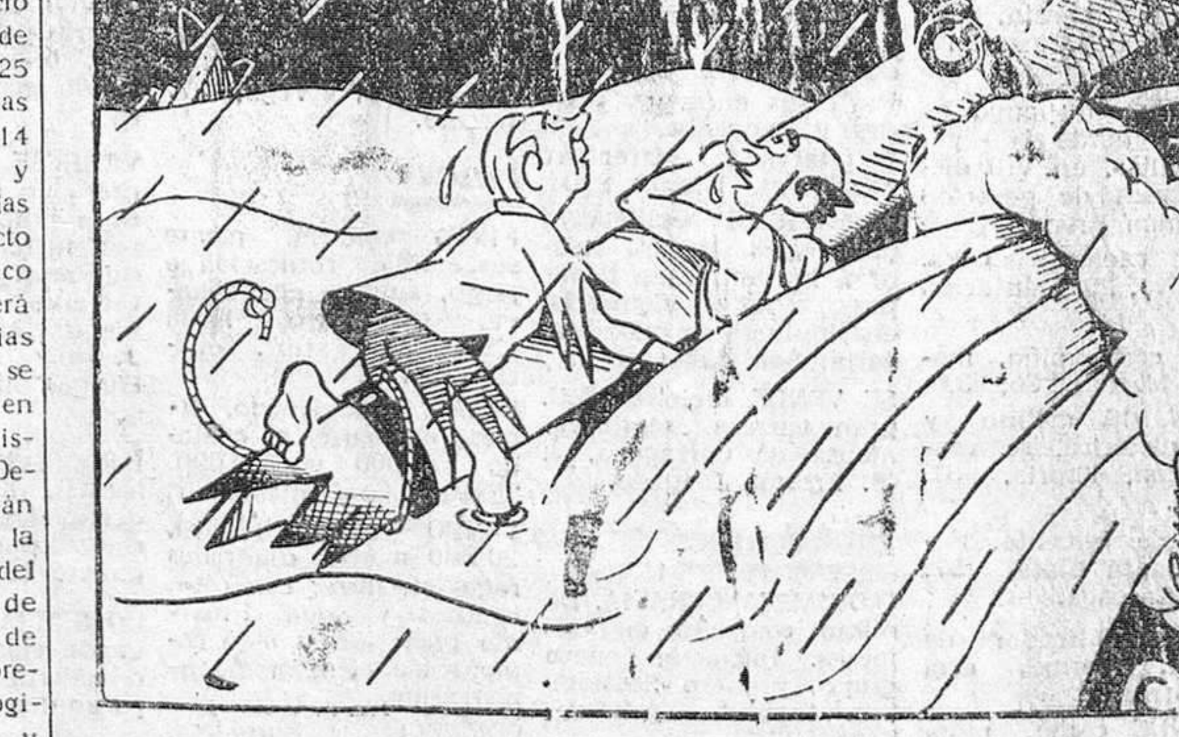
—¡Qué mala suerte. Ahora se pone a llover!