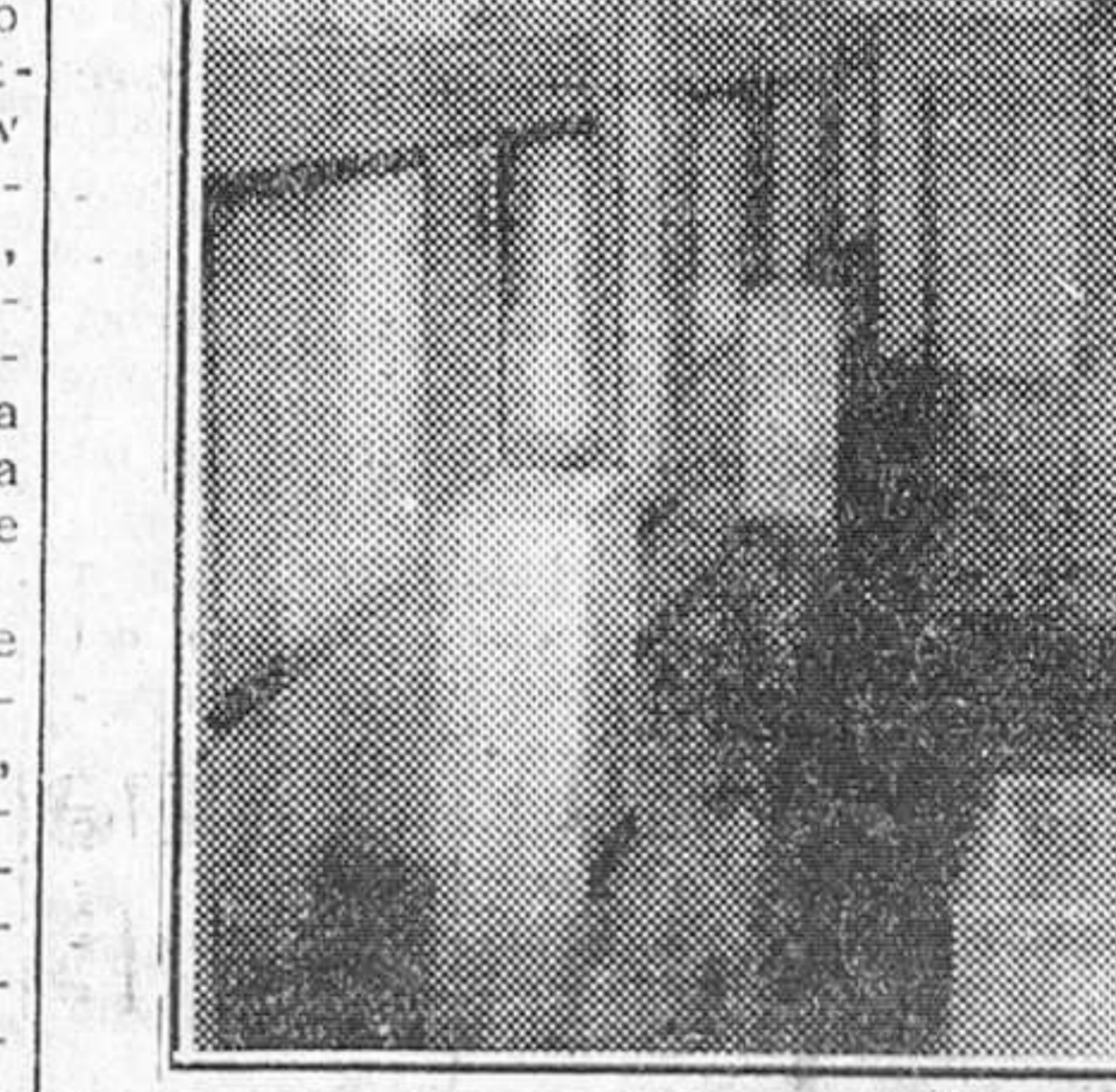
Vista de conjunto del Museo de Ricas Telas, instalado en la antigua Sala del Auditorio del Real Monasterio de Las Huelgas.

gera descripción apenas si basta para dar una idea de lo que el Museo de Ricas Telas es en sí. No obstante, puede considerarse suficiente al propósito de difundir la excepcional importancia presentada por el hecho feliz de que muy pronto —inmediatamente— sea abierta al público la exhibición de tan excepcionales pruebas históricas y el no