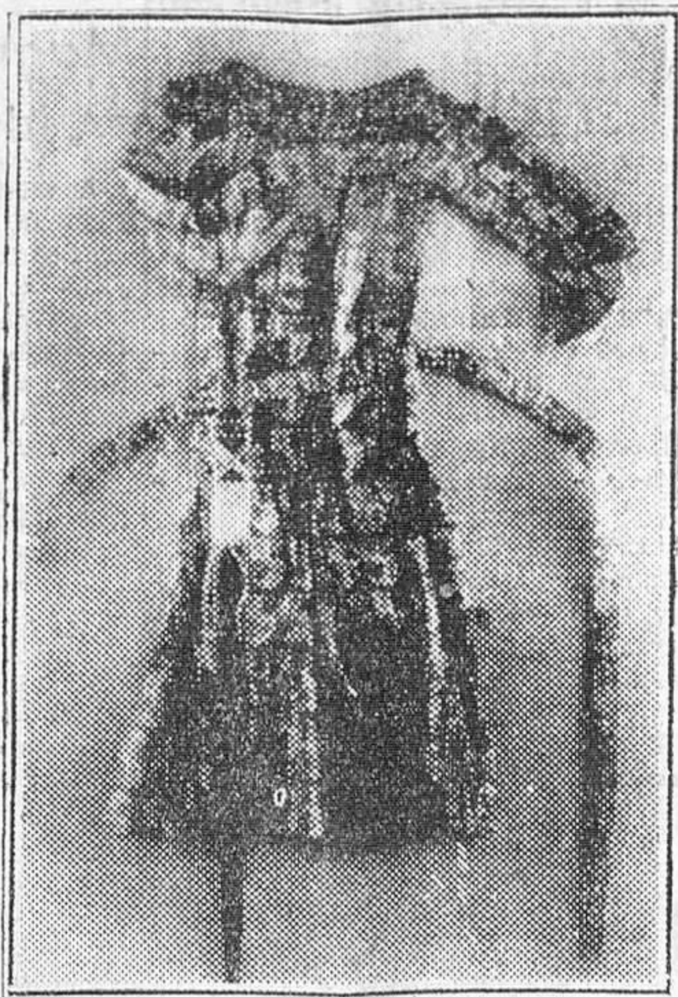
Aljuba usada por el infante don Fernando de la Cerda; ceñidor bellísimo, con artística y rica heribilla, esmaltado de complicadísima heribilla y encajado de pedrería y espada de combate del Príncipe.

Figura después un pelote (españa de gahán) de brocado, perteneciente al Príncipe niño don Enrique I, muerto, como es sabido, por causa de un golpe de teja.