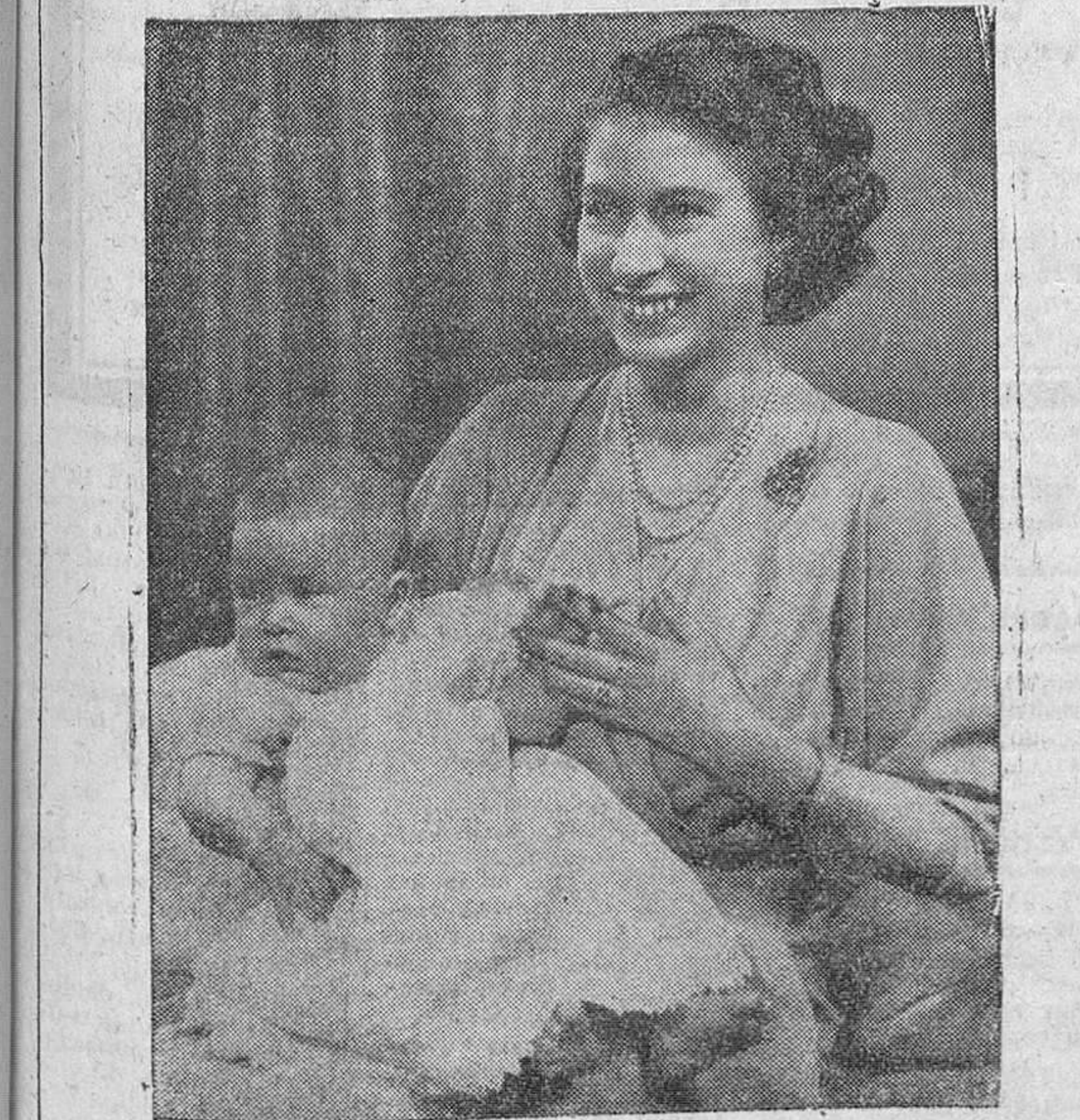
He aquí la más reciente fotografía de la princesa Isabel, heredera del trono británico, con su hijo el príncipe Carlos, heredero también, por línea directa de sucesión, de la Corona inglesa.