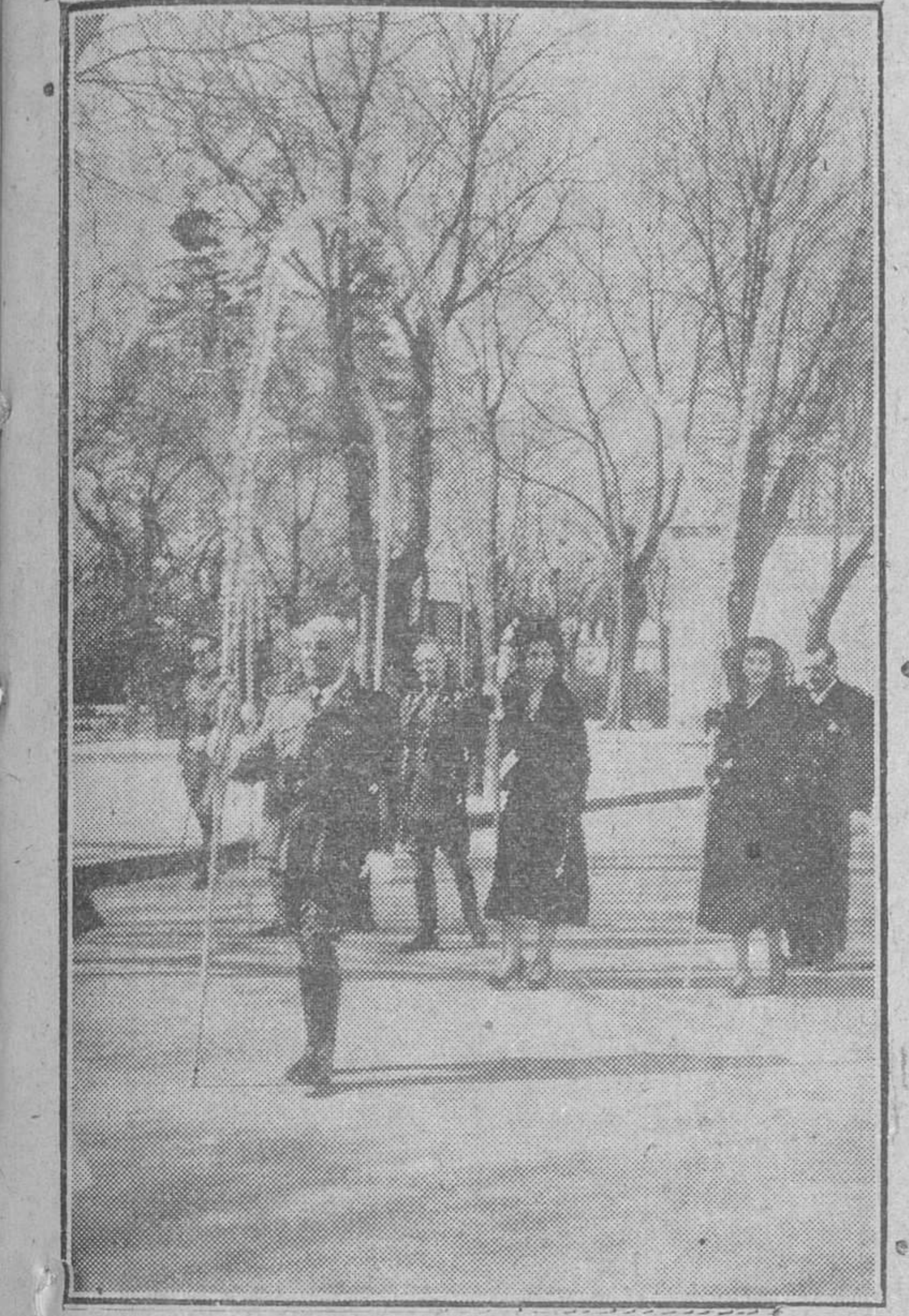
Madrid.—Con motivo de la festividad del Domingo de Ramos, Su Excelencia el Jefe del Estado, con su esposa e hija, oyó misa en la iglesia de la residencia de El Pardo. Acompañaban al Caudillo los jefes de sus Casas Militar y Civil y ayudantes de servicio. Además asistieron al acto los jefes y oficiales del Regimiento de la guardia, alto personal de la Casa Civil y del Patrimonio nacional y autoridades de El Pardo. Su Excelencia y séquito tomaron parte en la procesión de las palmas, que se efectuó dentro del recinto de la residencia.

TITO "REELEGIÓ" Londres.—Informan de Belgrado las elecciones del frente popular yugoslavo han terminado con la "reelección" de Tito como presidente del Comité Federal del Frente.—Efe.