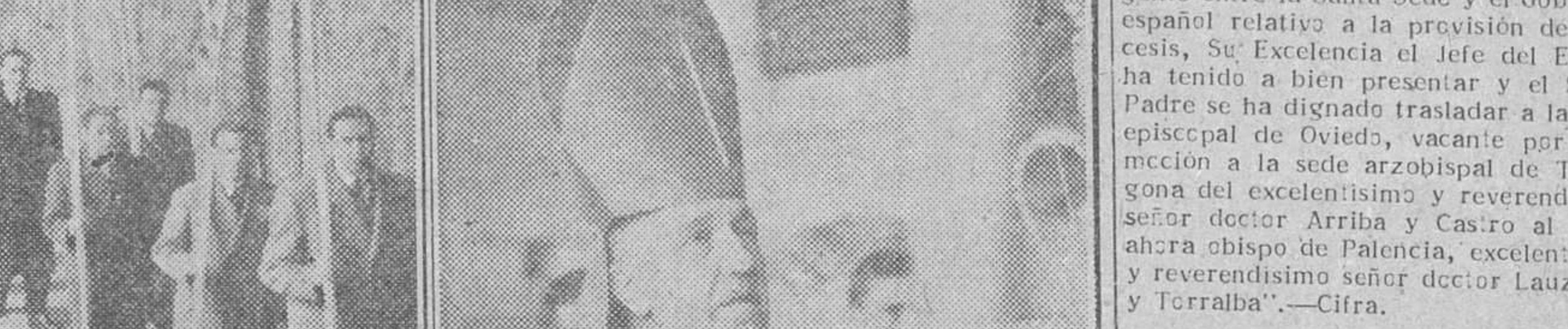
Tres detalles de la solemnisima fiesta del Domingo de Ramos en nuestra ciudad. Arriba, de izquierda a derecha, la Corporación municipal durante la procesión del S. T. M. y nuestro reverendísimo Prelado, revestido de pontifical y presidiendo el cortejo. Abajo, procesión infantil con palmas en el Colegio La Salle.