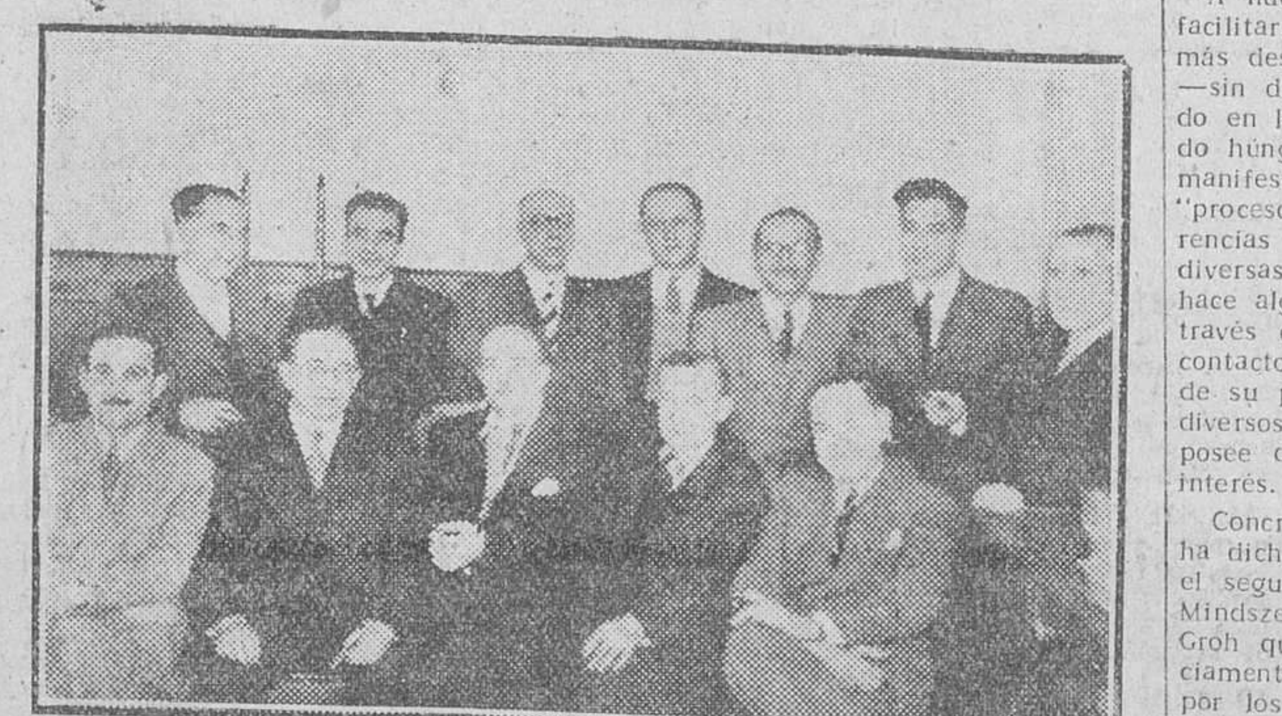
AYER CELEBRARON LA FIESTA DE SU PATRONA, SANTA APOLONIA, VIRGEN Y MARTIR, LOS ODONTÓLOGOS BURGALESES. EN NUESTRA FOTO, DESPUES DEL ACTO DE HERMANDAD EN QUE SE REUNIERON.