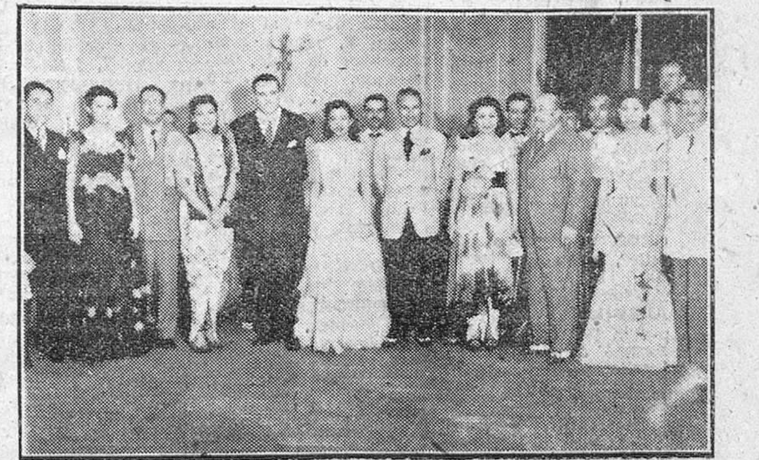
MADRID.— EL MINISTRO DE FILIPINAS EN ESPAÑA, AL DAR POR CONCLUIDA SU ESTANCIA EN MADRID, HA OFRECIO UNA BRILLANTE RECEPCION EN HONOR DE LAS AUTORIDADES ESPAÑOLAS. HE AQUÍ UN DETALLE DEL APTO AL QUE ASISTIERON VARIOS MINISTROS, DIPLOMATICOS Y OTRAS PERSONALIDADES