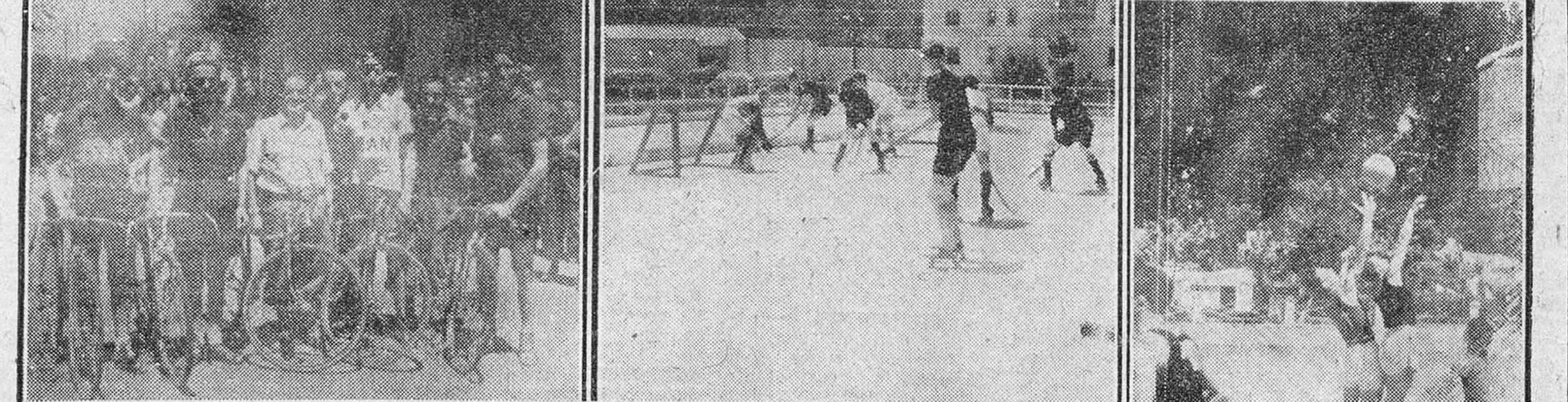
Todos los domingos, se desarrolla en nuestra ciudad una intensa actividad deportiva. En nuestras fotos: Un grupo de participantes en el campeonato provincial ciclista de productores...