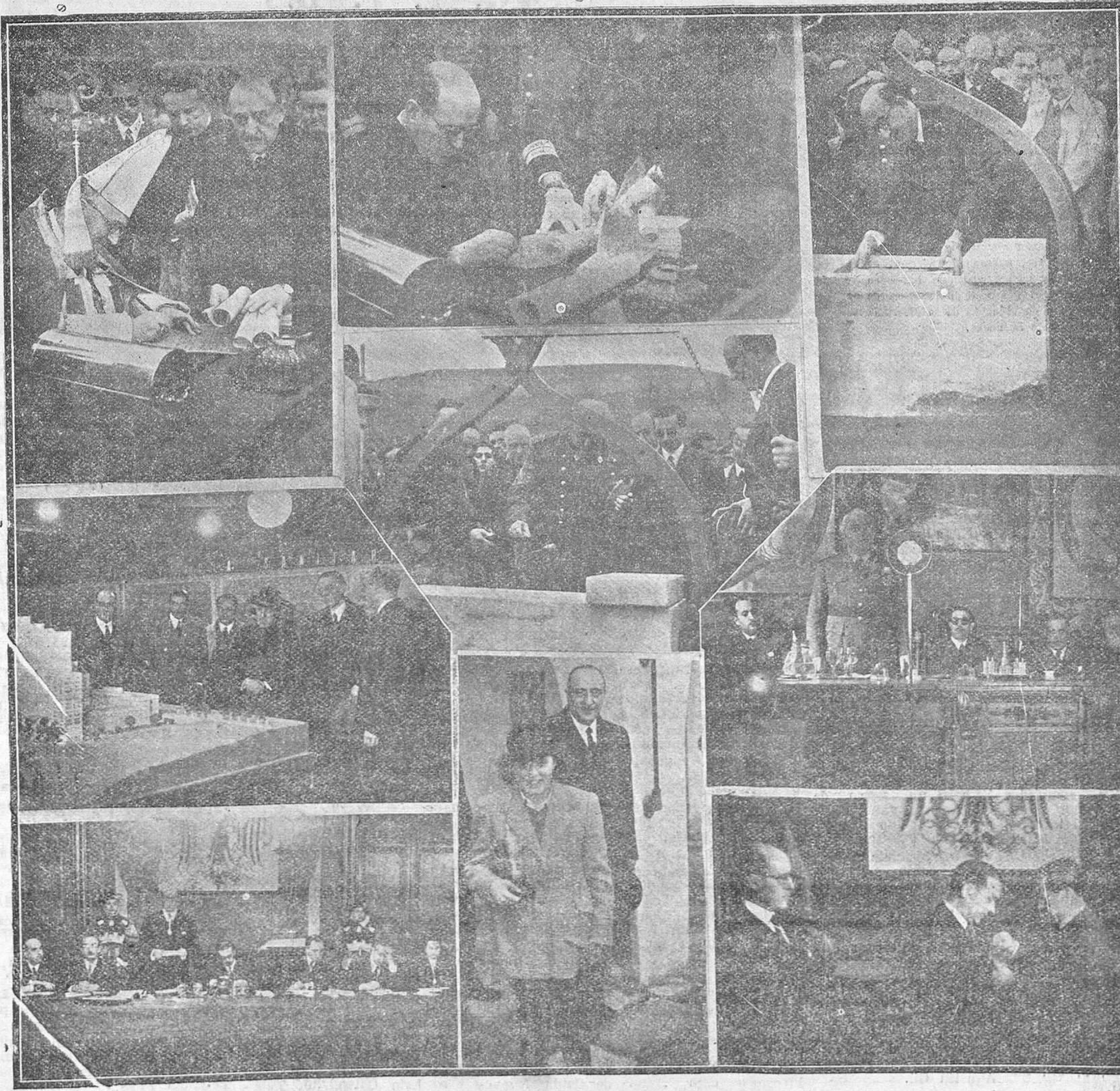
De izquierda a derecha y de arriba abajo: Nuestro Rvdmo. Prelado y el comisario del Instituto, firmando el acta de colocación de la primera piedra de la Residencia Sanitaria. El director de la Caja del Seguro de Enfermedad, colocando la arqueta simbólica. El capitán general de la región, depositando la primera piedrita, inaugural de las obras. Visita a la Exposición de proyectos y maquetas. El teniente general Yague, pronunciando su trascendental discurso. Un detalle de la sesión estatutaria del Consejo del Instituto Nacional de Previsión. La hija del capitán general de la Región, después de la prueba de amazonas, en la que resultó vencedora. Imposición de la Medalla de Oro al presidente de la Diputación provincial.