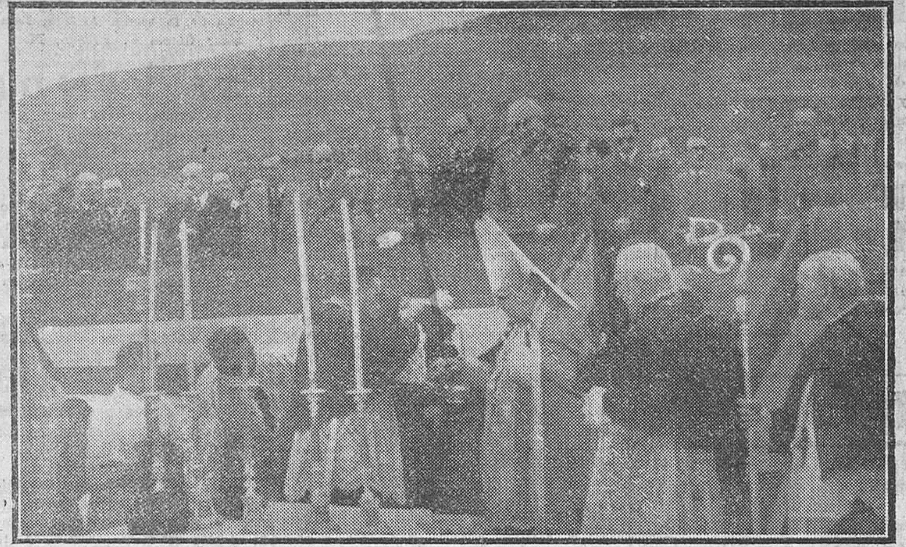
EL EXCMO. Y RVDMO. SEÑOR ARZOBISPO EN UN MOMENTO DE LA 'CEREMONIA DE BENDICION DE LOS TERRENOS DONDE HA DE EDIFICARSE LA RESIDENCIA SANITARIA DE BURGOS

De inusitado esplendor y brillantez resultaron los actos celebrados ayer en nuestra ciudad por el Instituto Nacional de Previsión, con motivo de la conmemoración del XL aniversario de su fundación y de la bendición y colocación de la primera piedra de la gran Residencia Sanitaria que ha de construirse en esta ciudad. En las primeras horas de la madrugada llegaron a Burgos diversos consejeros del Instituto, así como otros altos cargos del mencionado organismo, para asistir a los solemnes actos organizados. Y durante toda la jornada, dichas personalidades, en unión de todas las autoridades, locales, presidieron las distintas solemnidades celebradas, que abarcaron todo el día de ayer.