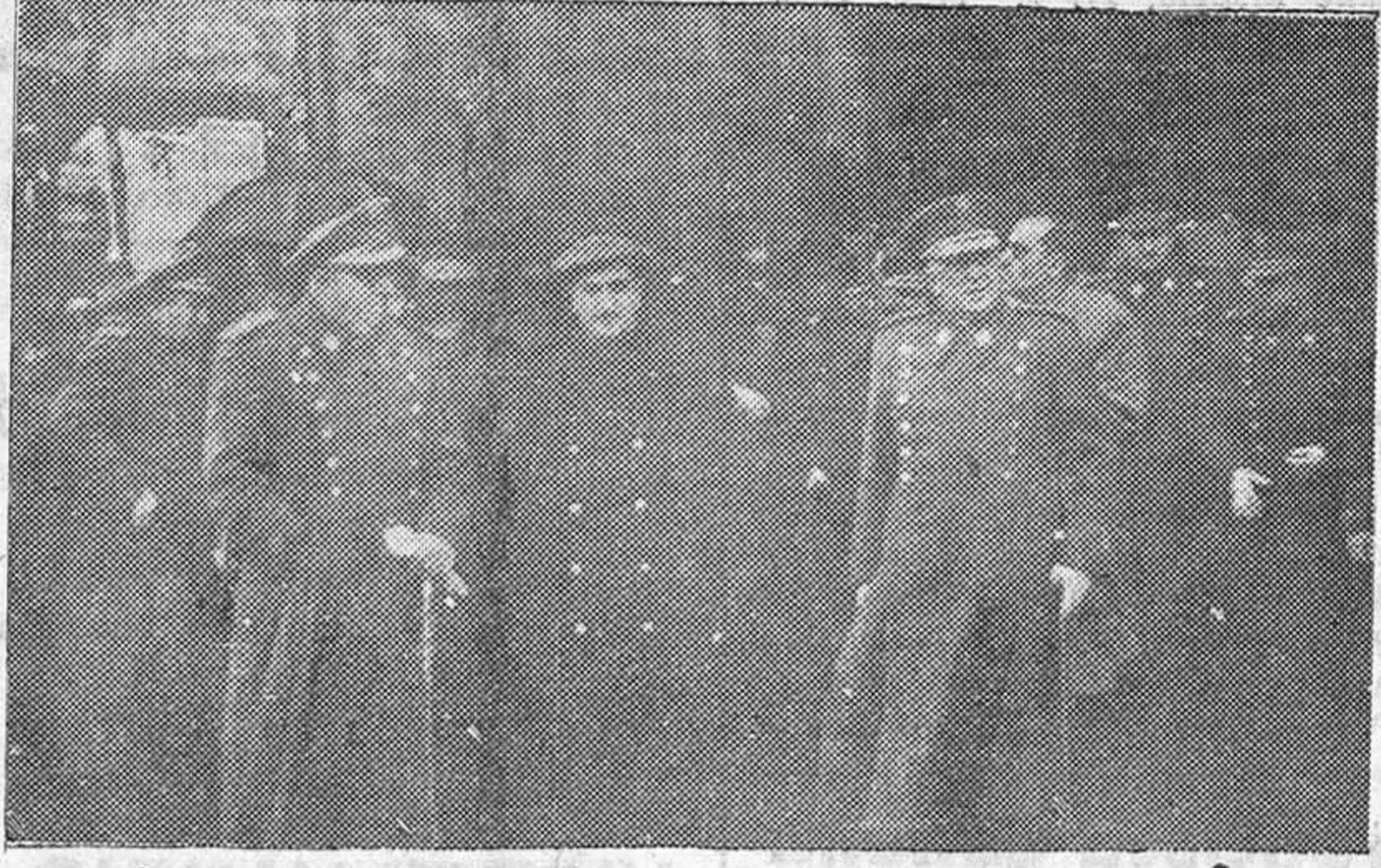
Las autoridades burgalesas, a la salida del templo de la Merced, después de la solemne fiesta religiosa-militar celebrada, el domingo último con motivo de la festividad de la Inmaculada Concepción