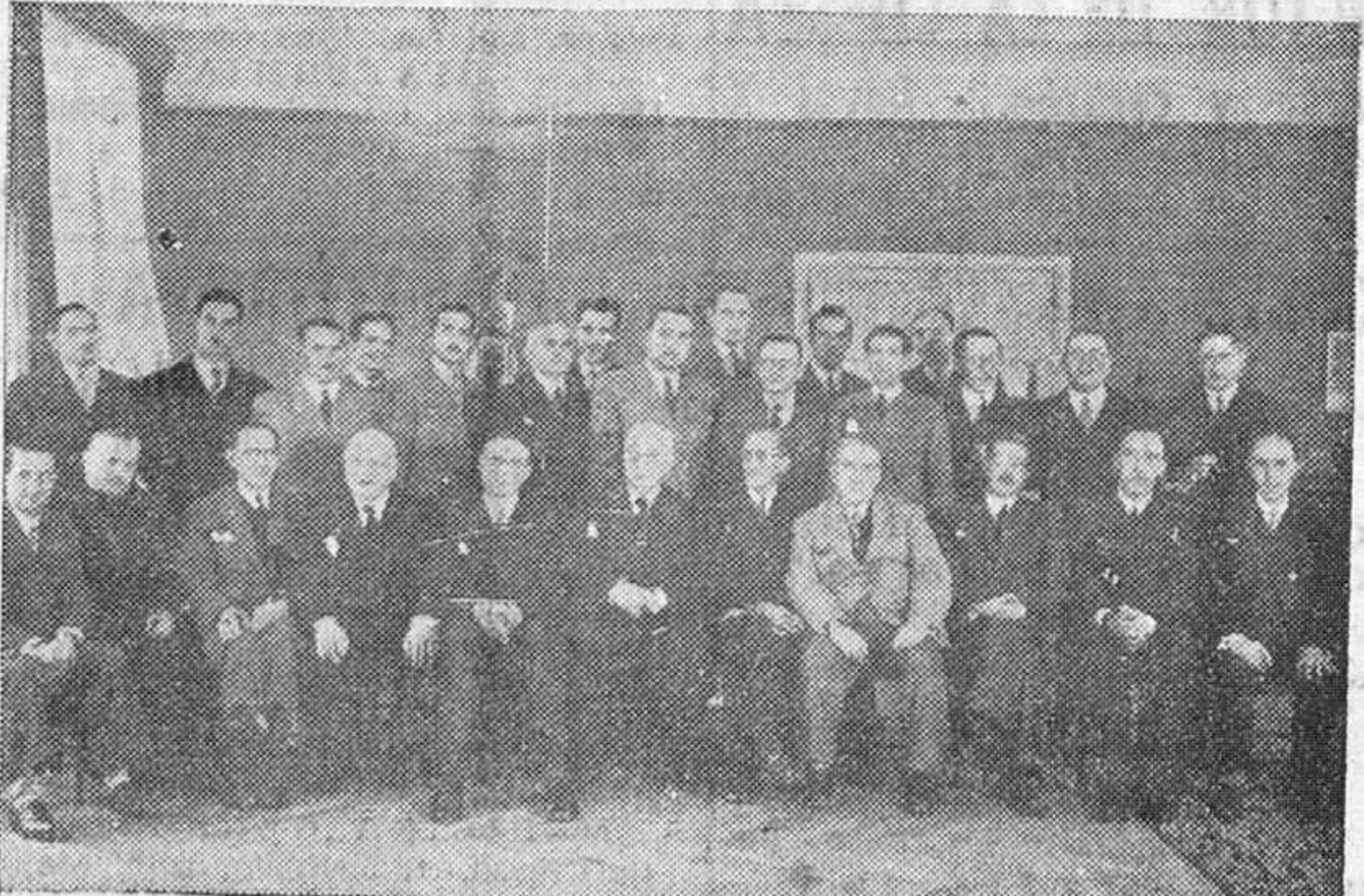
Un grupo de letrados burgaleses, reunidos el pasado domingo para conmemorar la festividad de su excelsa Patrona, la Inmaculada Concepción de Nuestra Señora, (Foto FEDE)