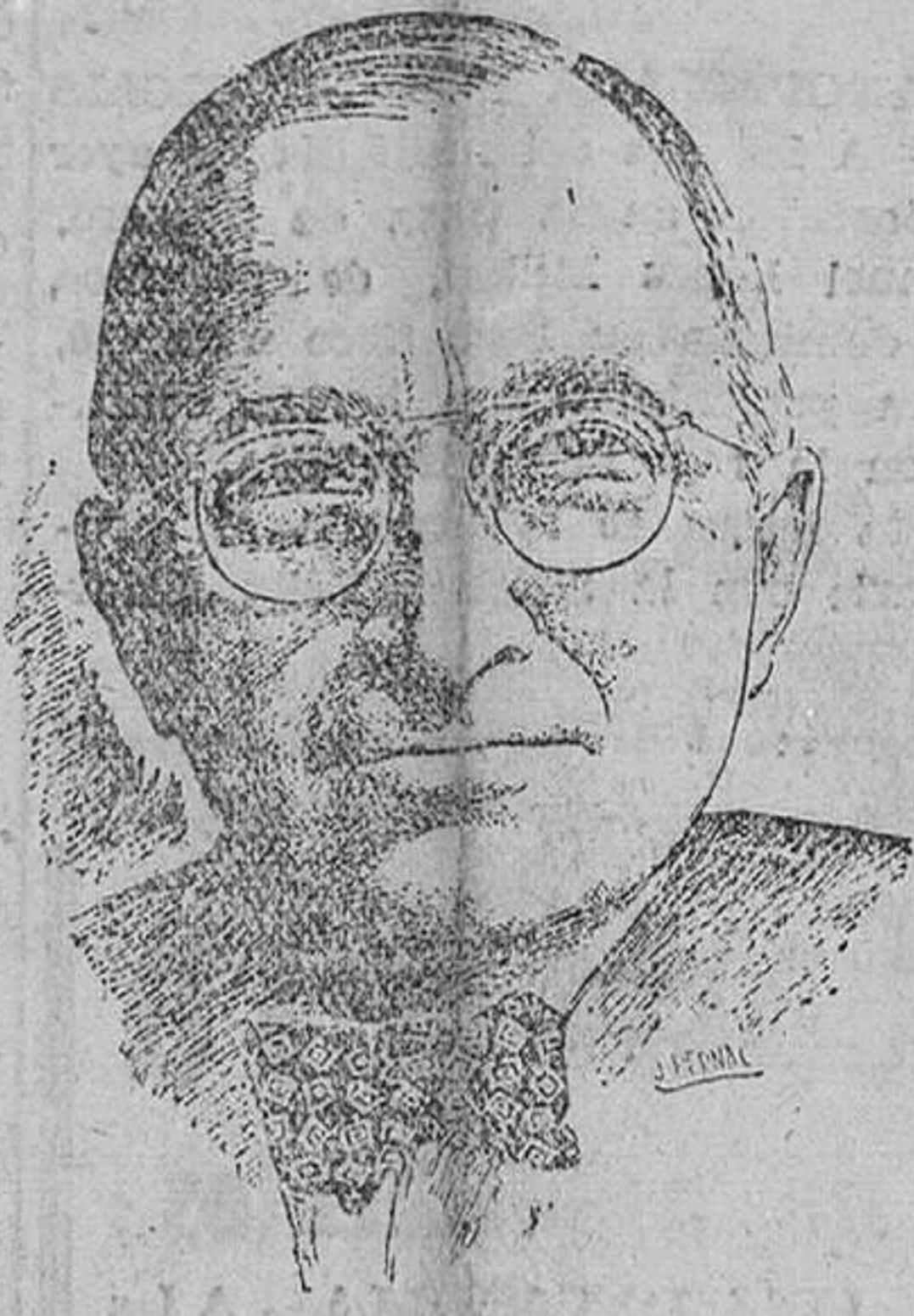
Washington.—El senador demócrata, Robert Hennegan, ha pedido a los republicanos y demócratas que cooperen con sus esfuerzos para el logro del mismo objetivo de fortalecer y conducir a la nación por la ruta del bienestar.

Washington.—El senador demócrata, Robert Hennegan, ha pedido a los republicanos y demócratas que cooperen con sus esfuerzos para el logro del mismo objetivo de fortalecer y conducir a la nación por la ruta del bienestar. En sus primeras declaraciones, después de las elecciones, admitió el triunfo republicano al lograr la mayoría del Congreso y envió sus calurosas felicitaciones a todos los candidatos elegidos de ambos partidos. “Habiendo conseguido la mayoría —dijo— el partido republicano, se enfrenta con una gran responsabilidad. Junto con el Gobierno demócrata, será responsable ante el pueblo de un programa para establecer la paz en el mundo y continuar la prosperidad de los Estados Unidos”. COMENTARIOS DE LA PRENSA INGLESA.— Los círculos de los republicanos en Estados Unidos respetivamente un voto de censura a la administración del demócrata presidente Truman y revise importancia trascendental para el resto del mundo, según ponen de relieve los diarios ingleses al comentar los resultados de las elecciones norteamericanas.—Efe.