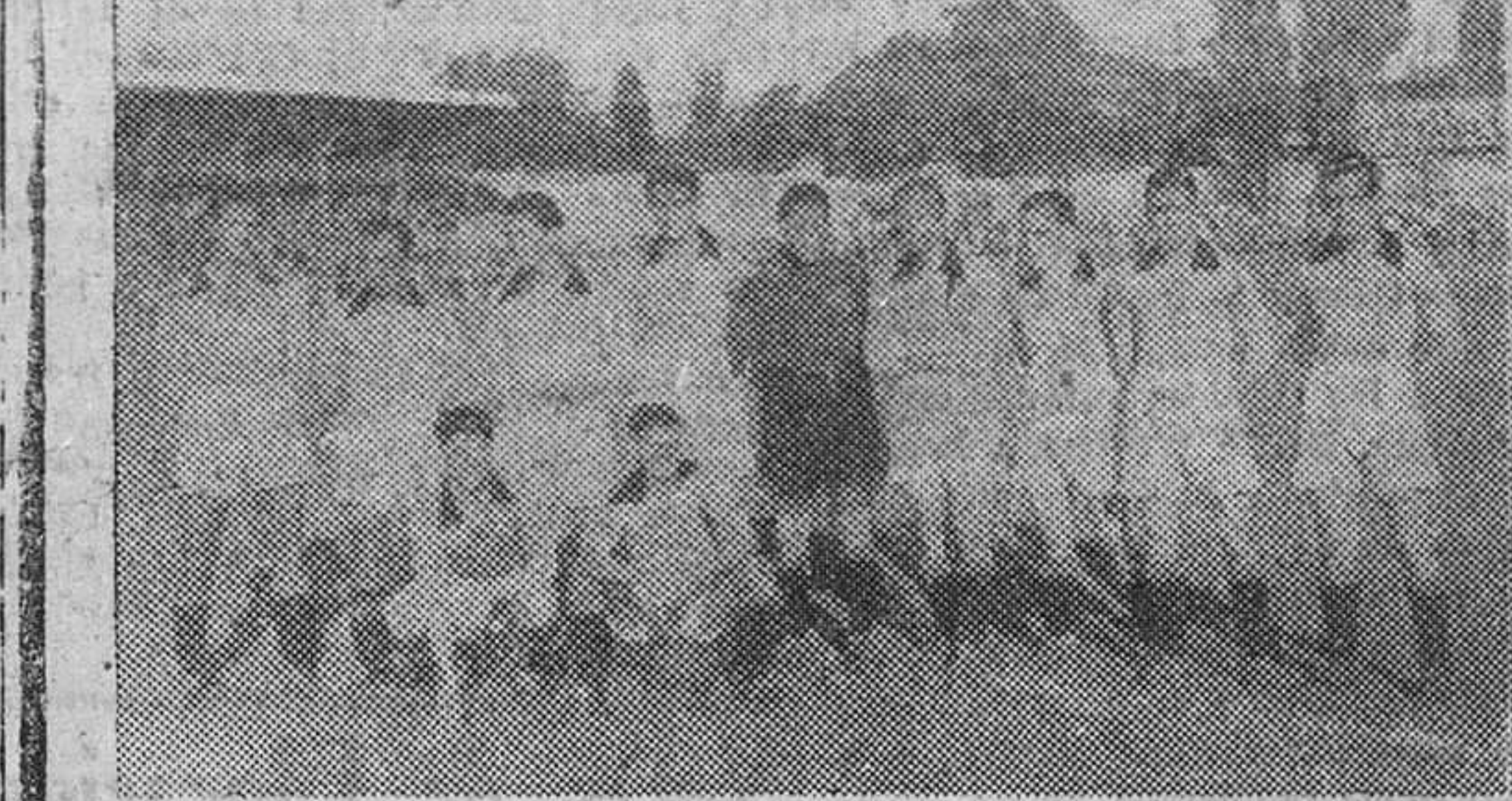
Abajo: El equipo de la Maestranza Aérea de Logroño, que por vez primera, en encuentro oficial de fútbol, pisó Zatorre el domingo, siendo derrotado por seis tantos a cero.