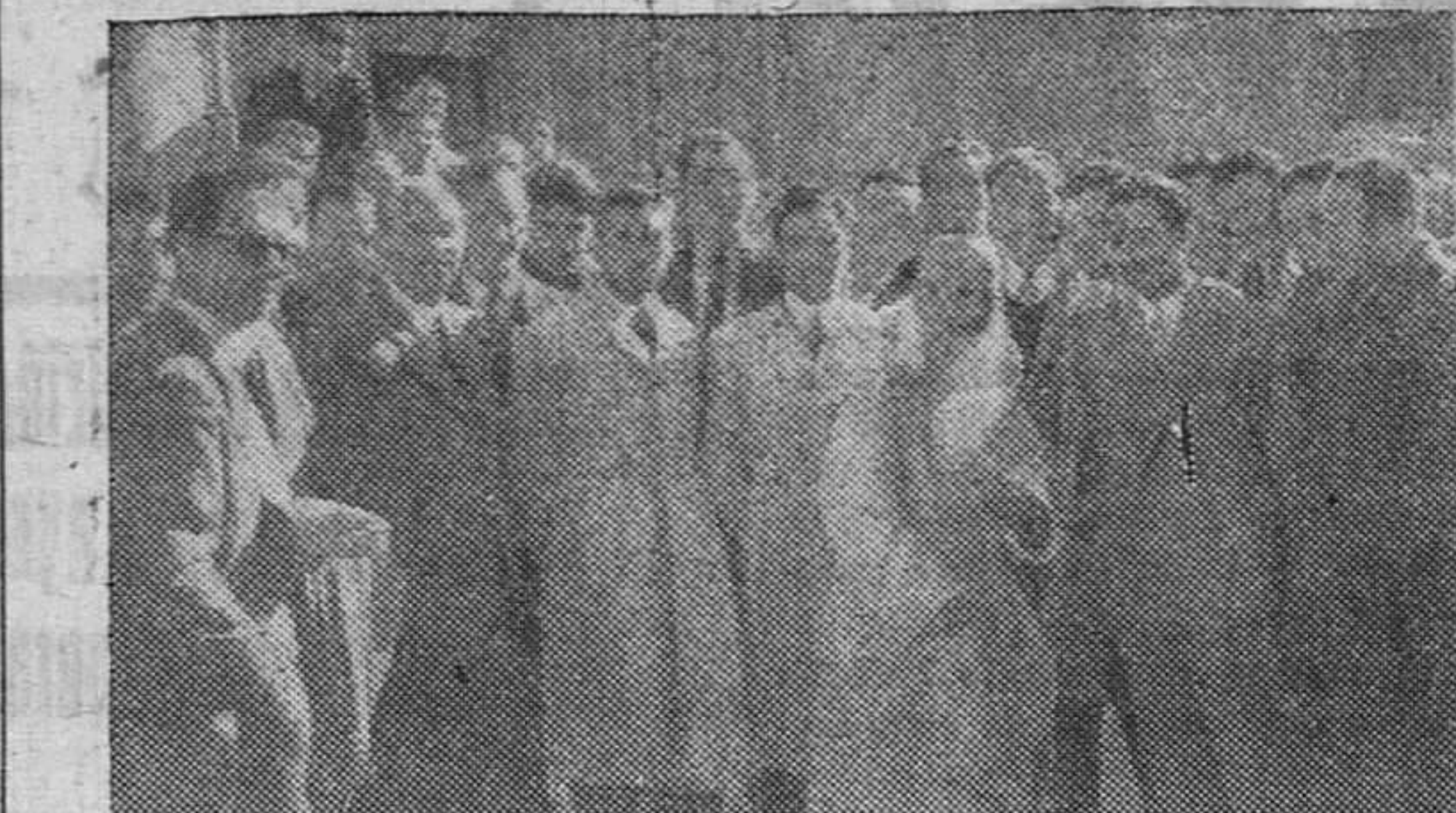
Arriba: Los estudiantes de la Facultad de Veterinaria, llegados a Burgos en viaje de estudios, posan ante nuestro fotógrafo, en la Cartuja de Miraflores.