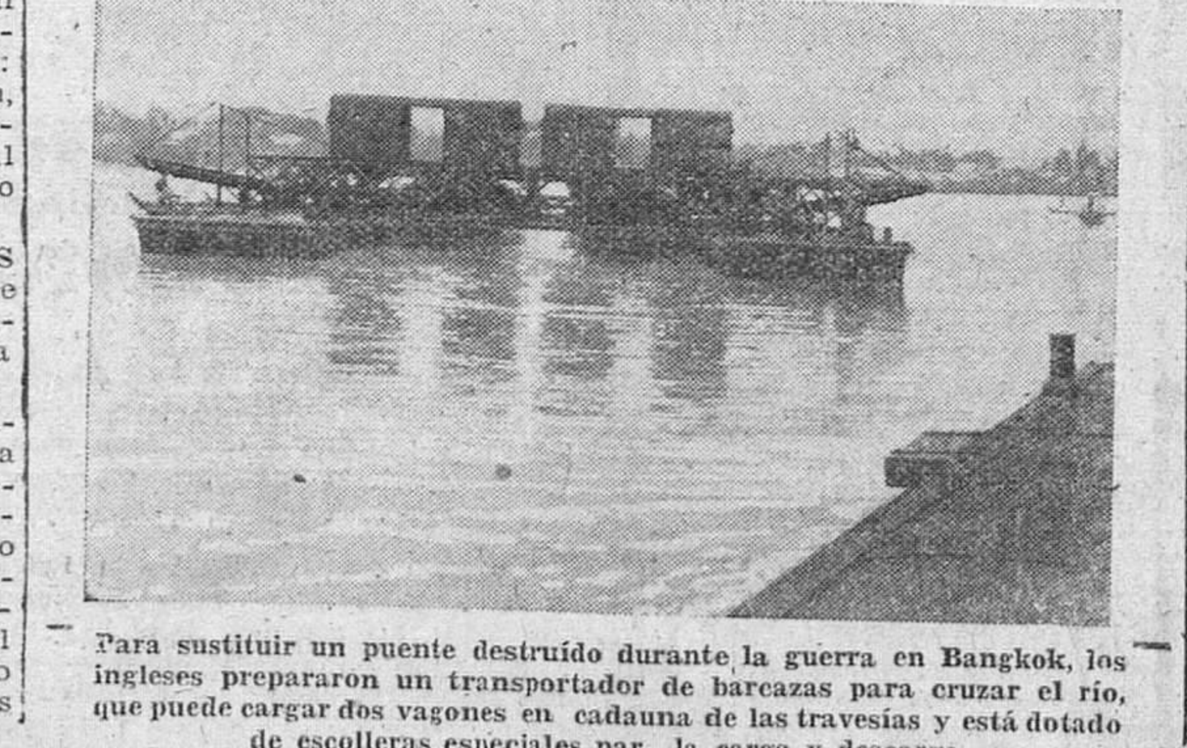
Para sustituir un puente destruido durante la guerra en Bangkok, los ingleses prepararon un transportador de barcas para cruzar el río, que puede cargar dos vagones en cada una de las travasas y está dotado de escolleras especiales para la carga y descarga