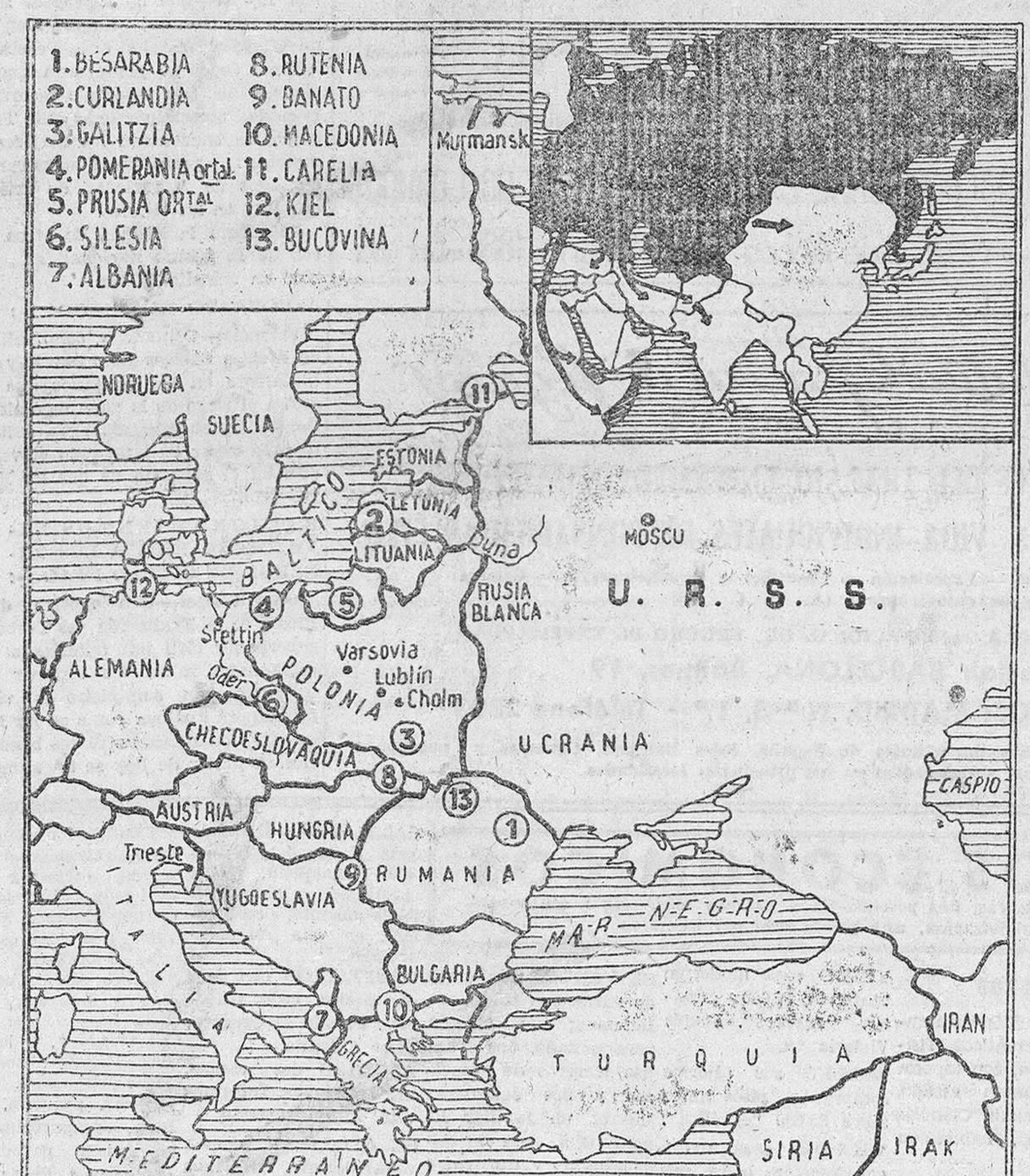
Los objetivos de una táctica múltiple y peligrosa

En el mes de Septiembre de 1942, circuló por el Mundo, la sensacional noticia de que Inglaterra estaba dispuesta a devolver a Guatemala el territorio disputado. A partir de entonces, el problema de Belice ha permanecido en la oscuridad hasta unos tres días. Hace unas semanas, Inglaterra propuso a Guatemala, que había resultado el tema, el arbitraje del tribunal internacional. El Gobierno centroamericano se negó a aceptar esta propuesta, que sólo determinaba los puntos jurídicos de la disputa, sin incuir para nada los aspectos político, económico y geográfico del caso de Belice. Las últimas conversaciones, entre Inglaterra y Guatemala, han tenido un violento final: el discurso del presidente guatemalteco, en el que amenaza cortar las relaciones de su país con la Gran Bretaña, en tanto no consiga la incorporación a Guatemala de los 22.000 kilómetros del territorio irredento.