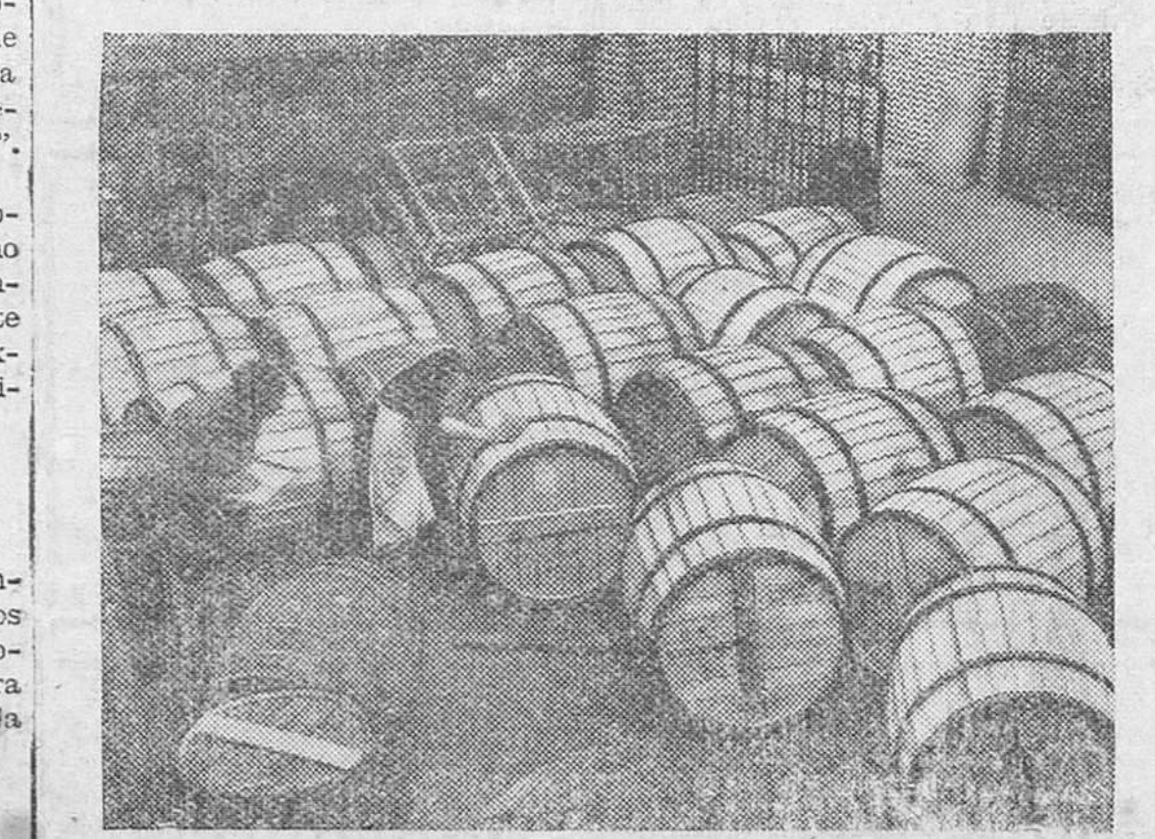
Envasada en estos barriles la porcelana fabricada en una importante alfarería inglesa, espera ser embarcada para su exportación a los puertos de ultramar